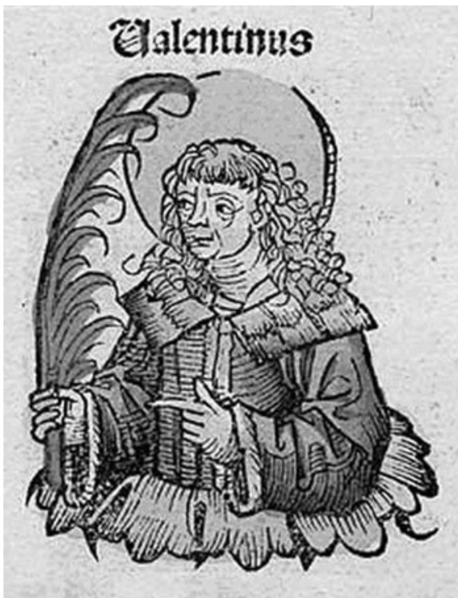
Святой Валентин Римский (средневековая миниатюра).

В житии, рассказанном Дмитрием Ростовским, нет упоминаний о тайных браках, которые устраивал молодой пресвитер – святой Валентин был схвачен солдатами и доставлен императору Клавдию за проповедь христианства.