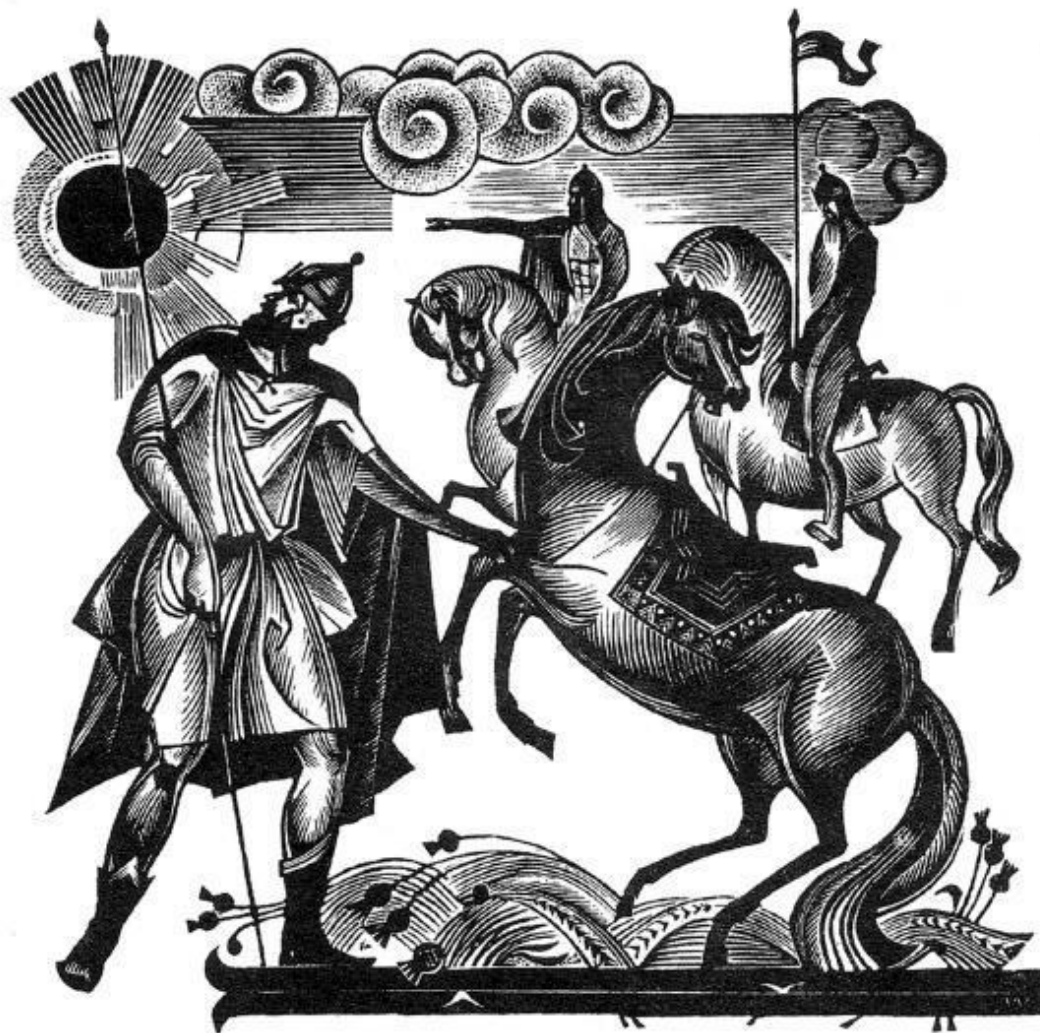
В. Сергеев. Русь православная.