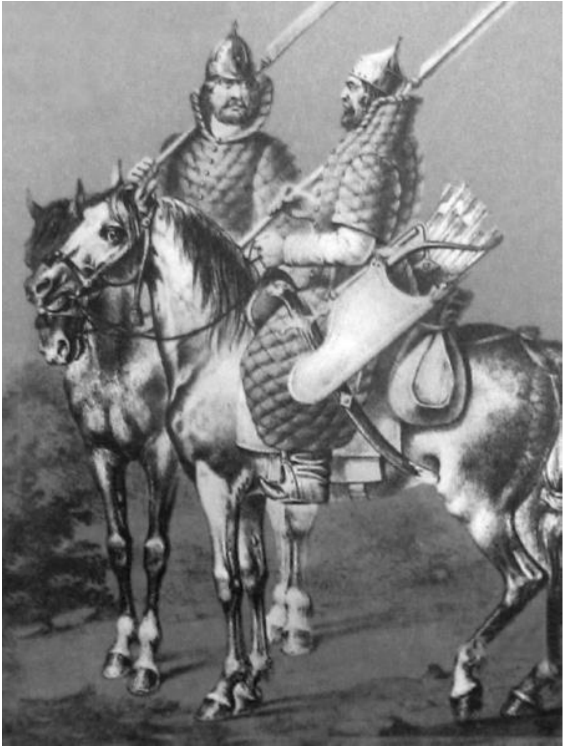
Русские войны XVI века

Тут ведь падала погодушка великая, Вот напал, напал туманушка ведь очунь-то, Очунь страшной туман да он по всем горам, Он по всем-то всё горам да всё ж тёмным лесам. И сделалось Орсёнушке тоскливо да скучно-то, И кругом-то ни зги не видать, ни голосу не слышать. Тут раздумалсе Орсёнушко-то сам с собой: «Ишше ладно ли иду я, и может быть, не ладно тут?»