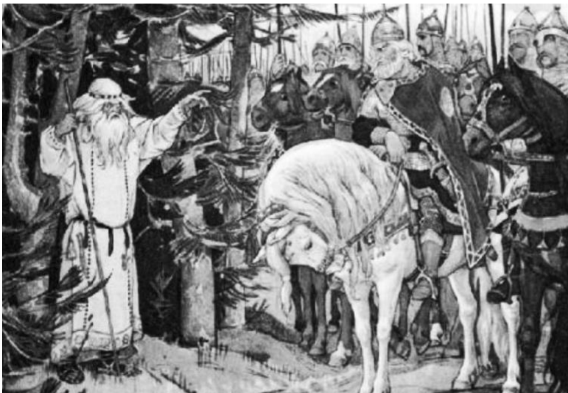
В. Васнецов. Встреча князя Олега с волхвом

Как Орсе́нушка-то брал же за белы ручки, Человал его в уста же во сахарные, Пировал-то с ним ведь кушал три сутоцьки. Вот ведь звал-то всё Горсе́нушка жить во матушку в каменну Москву; Отвечал ему: «Я сейчас же, государь царь Иван Васильёвич, Как ведь ехать-то с тобой да не поеду я, Потому што у меня осталась-то в деревни-то родна матушка, Родна матушка осталась и родна сестриця, Нужно съездить-то во деревню попроведати, - Не поедет если матушка в каменну Москву, Тогда надоть её ведь и переделать-то старой домичёк, Чтобы матушку воставить во приюти тут». Тут давал-то государь царь Иван Васильёвич, Много-много тут давал он золотой казны, Вот давал ему ведь и много-много чиста серебра, Как самого-то звал его же в каменну Москву, В каменну Москву его да при себе его, Штобы быть всегда при ём думным боярином, Без его-то никакого дела зачинать нельзя, Зачинать дела нельзя без его и кончити. Распрошшалсе государь царь со Арсе́нушком, Государь-от царь Иван же свет Васильёвич, Он садилсе тут в корету-ту в золочёную, Вот уехал он во славну в матушку в каменну Москву;