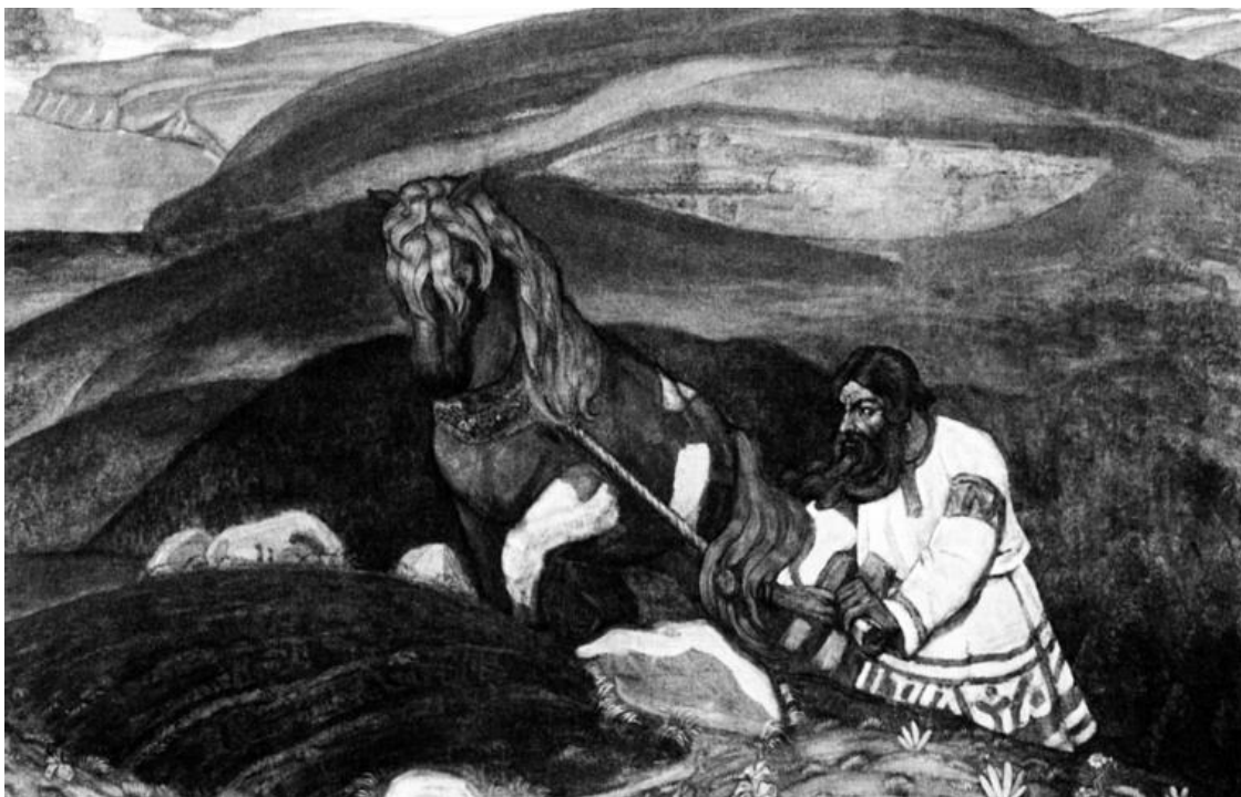
Н. Рерих. Микула Селянинович

Как опекло-то всё его же красно солнышко, А ведь вышел на дорожку-ту Вологду, Как на саму-ту, вела она во втору Москву. Как пришол-то наш Арсёнышко во втору Москву, Во втору Москву пришол он, во Божью церковь, Во Божью церковь пришол он, да в Николин храм; Во второй Москвы Арсёнышко помолился он, Он ведь клал-то кладом денег золотой казны, Вот положил эти деньги – сорок тысячей, Как которые были всё они украдены. Некого-то в храме не было, не случилось, Только в храме-то ведь и был да один старик тут; Как ведь сторож никому про то не рассказывал. А и как Арсёнышко тогда пошел по городу, Вот по городу ходил же он, разгуливал, Осмотрел-то, оглядел да славну Вологду, Славну Вологду оглядел же он, втору Москву, Как тогда-то подходил ко царёву-то большому кабаку, - А у царёва-то у большого славна кабаку, Тут ведь много-то стояло голи кабацкою, Вот кабацкой-то ведь голи было, посадьскою. Подошел к йима Арсёнышко поздоровался: «Уж вы здравствуйте, ребятушка, голь кабацкая, Голь кабацкая, ребятушка, посадьская! Каково же вы, ребятушка, поживаете? Каково ваше, ребятушка, здоровьице?» Отвечала тут ведь голь же вот кабацкая: «Как здоровье нашо всё же у всех – здоровья;