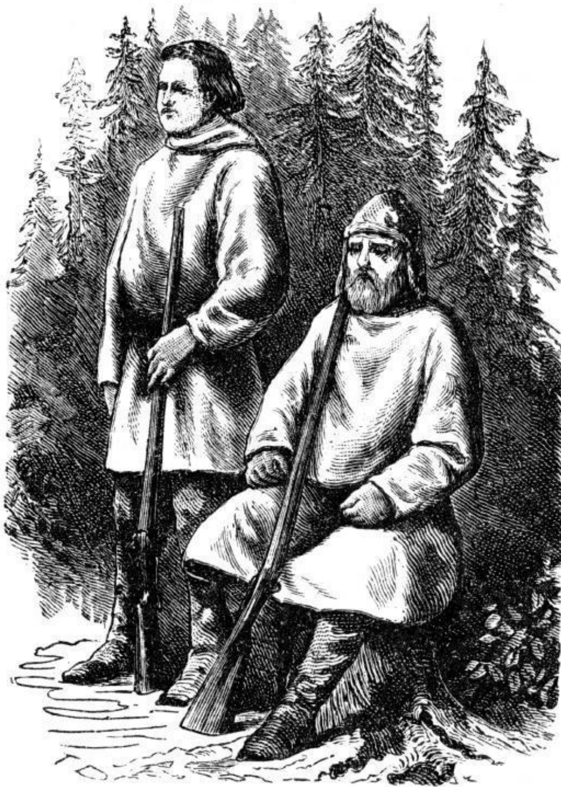
Зыряне. XIX век.

«Как оставь-ко-се, Орсёнушко, ведь силушки, Вот положь-ко-се на ихну-ту на глупость тут» Перестал боле ведь силушки-то бить же он. Все народ-люди ведь тут ужасались. Тут подъехала корета-то золочёная, Тогда ведь взял-то государь царь Иван Васильевич