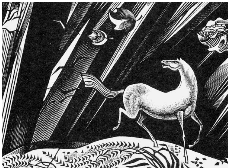
В. Сергеев. Лошадь в поле

Много-много было подвигов богатырских тут, Перестрелочных боёв да числа-счёту нет. Ишше как той нашої стариனுшке конец пришол. Славной Вологды-рекой, да ей на тишину, Славной матушки каменной Москвы на чесь-славу вели- кую, Вам, учёным-то людям младым, на прописаньицо, А от вас пойдёт премладым на рассказаньицо, А от младых-то пойдёт пропеваньицо.