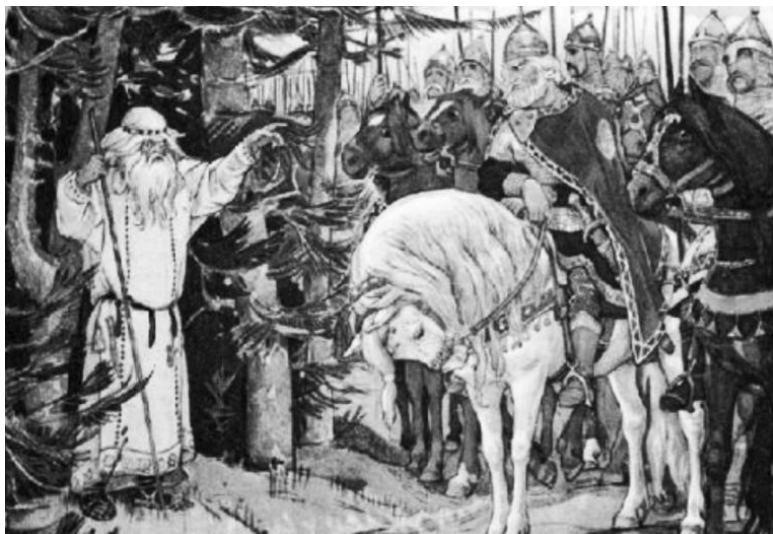
В. Васнецов. Встреча князя Олега с волхвом

Как самого-то звал его же в каменну Москву, В каменну Москву его да при себе его, Штобы быть всегда при ём думным боярином, Без его-то никакого дела зачинать нельзя, Зачинать дела нельзя без его и кончити. Распрошшалсе государь царь со Арсёнушком, Государь-от царь Иван же свет Васильёвич, Он садилсе тут в корету-ту в золочёную, Вот уехал он во славну в матушку в каменну Москву;