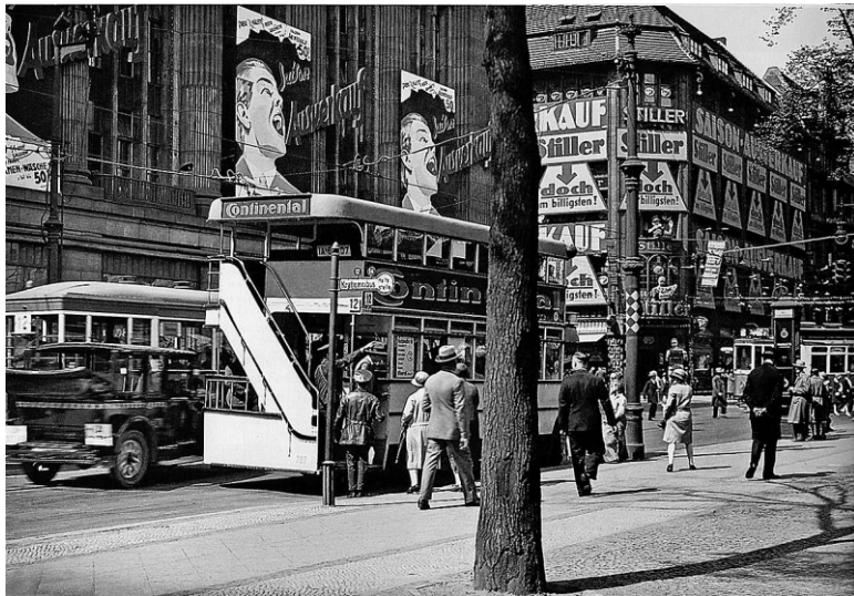
Теда Беем. Реклама на улицах Берлина. 1930 г.

Но вот уже несколько десятилетий, особенно после великой войны, отчие дома стоят в этом мире как неприкаянные, этакие открытые всем ветрам словесные каркасы, в которых хоть и полно мебели, коридоров, родителей, детей, солонок и сахарниц, но держится всё это кое-как, скорее, по созвучию лада и уклада, обычая и привычки, а еще по прихоти ленивой силы, которая по недоразумению именуется у нас «традицией». Дети появляются теперь на свет не в родительских опочивальнях, а в просторных, светлых чертогах родильных клиник, где за час сходят с конвейера (чуть ли не