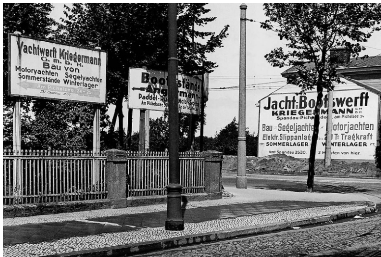
Тогда Беём. Реклама на улицах Берлина. 1930 г.

К числу бесплатных объектов всё еще принадлежат пресловутые весенние облака, а также «ласковые майские дуновения», которыми так любят пользоваться поэты, равно как и голубое небо, за которым с прежним упорством прячется Господь, дабы без помех удовлетворять ходатайства особо набожных граждан. Так называемые перелетные птицы, живые воплощения человеческой тоски, всё еще возвращаются с юга, неисправимые в своем стремлении к перелетам, всё еще подчиняясь непостижимой тяге к нашей старушке Европе, которая, если подумать, несколько им не нужна. Власть обычая и инстинкта столь неодолима в племени этих перна-