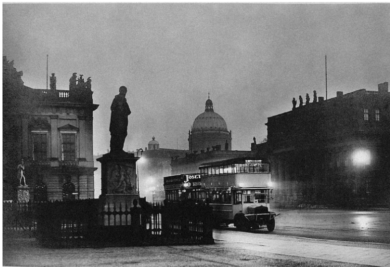
Автобусы на Унтер ден Линден. Около 1925 г.

Хотел бы я знать, чем занимаются парковые смотрители зимой. Ибо почти невозможно помыслить, что они когда-либо покидают вверенную им территорию и коротают зиму в кухонном тепле среди жен и детишек. Наверное, они укутываются в тряпье и солому, а прохожие принимают их за кусты роз. А может, за мраморную фауну или бронзовых фонтанных ангелочков. Либо они зарываются на зиму в землю, а по весне всходят вместе с примулами и первыми фиалками. Как они, наподобие лесных обитателей, кормятся ягодами шиповника, я видел собственными глазами. Когда их о чем-