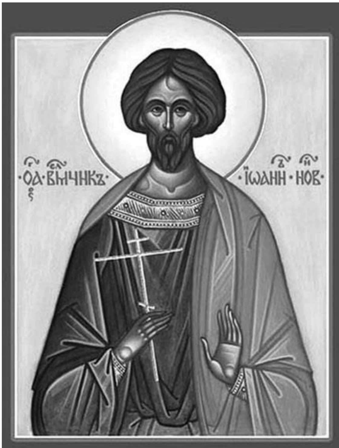
Святой великомученик Иоанн Новый Сочавский

Иоанн Сочавский в своей земной жизни был купцом, и благодаря твердой вере в Бога дела его шли весьма успешно.