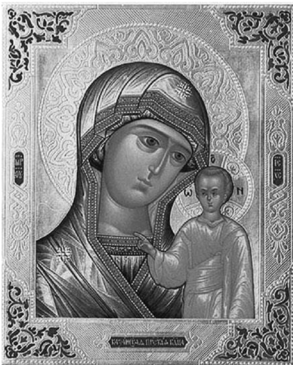
Икона Божьей Матери «Казанская»

Эту молитву обязательно нужно читать при выполнении любого дела, в том числе и коммерческого. Пресвятая Богородица всегда дарует успех в делах, если направлены они на добро и процветание.