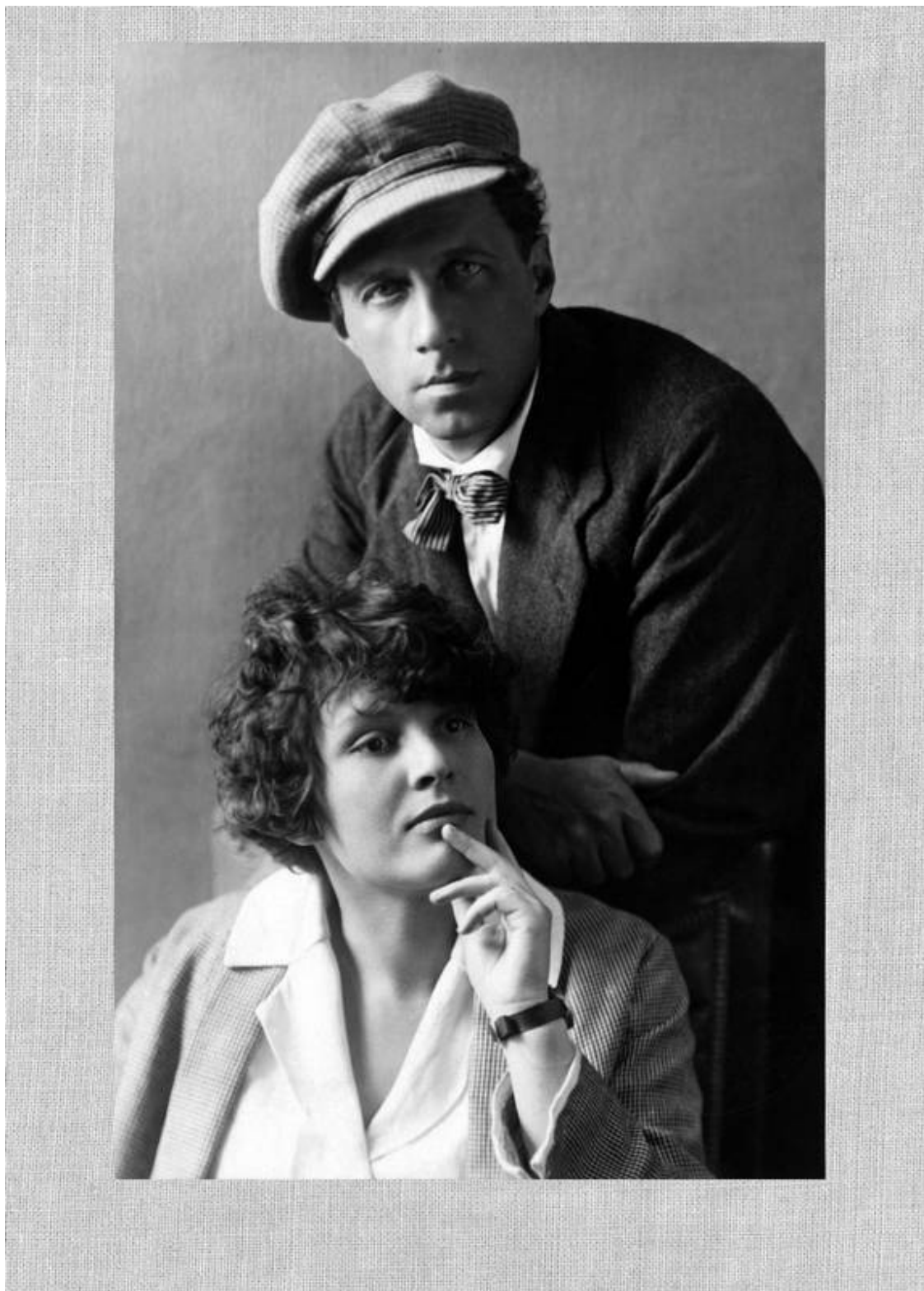
З.Н.Райх и В.Э.Мейерхольд. 1923