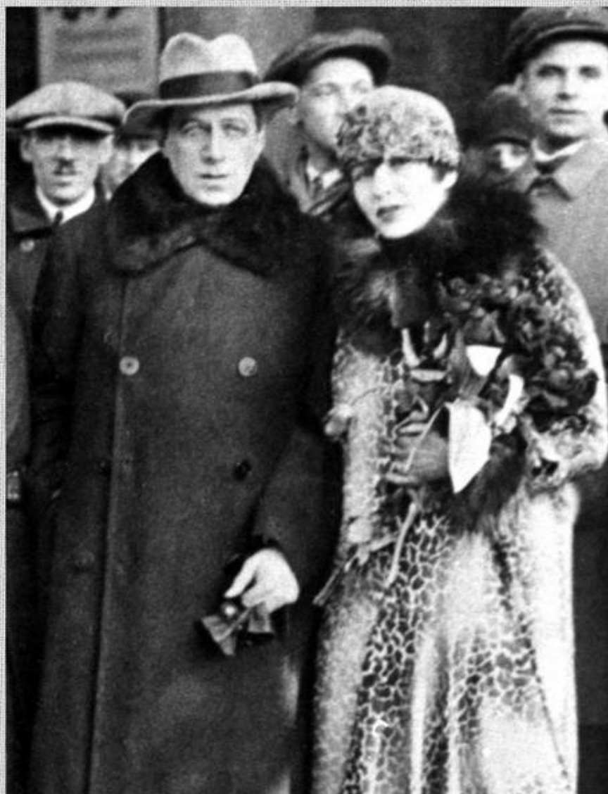
З.Н.Райх и В.Э.Мейерхольд. 1930. (Гастроли в Германии. На вокзале в Берлине)