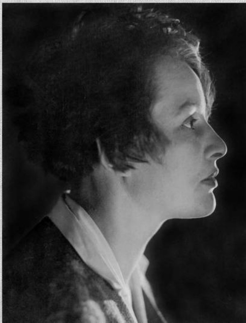
З.Н.Райх. Середина 1920-х