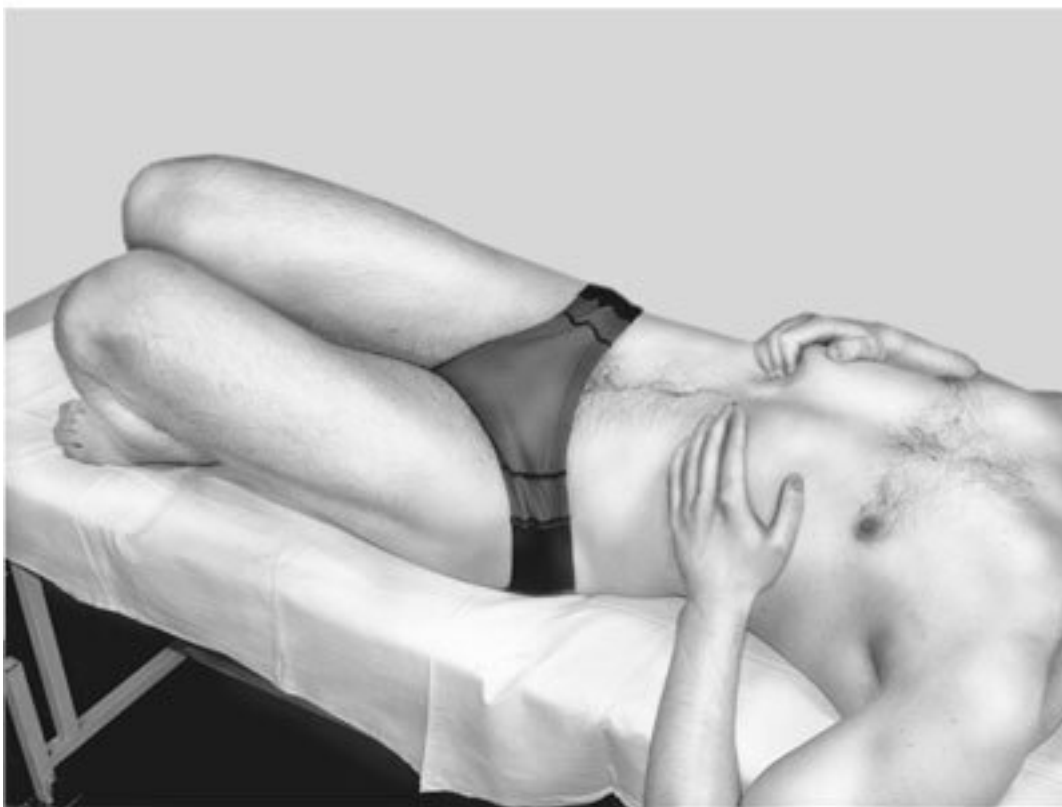
Рис. 2. Поза-движение для расслабления диафрагмы (1-я фаза)