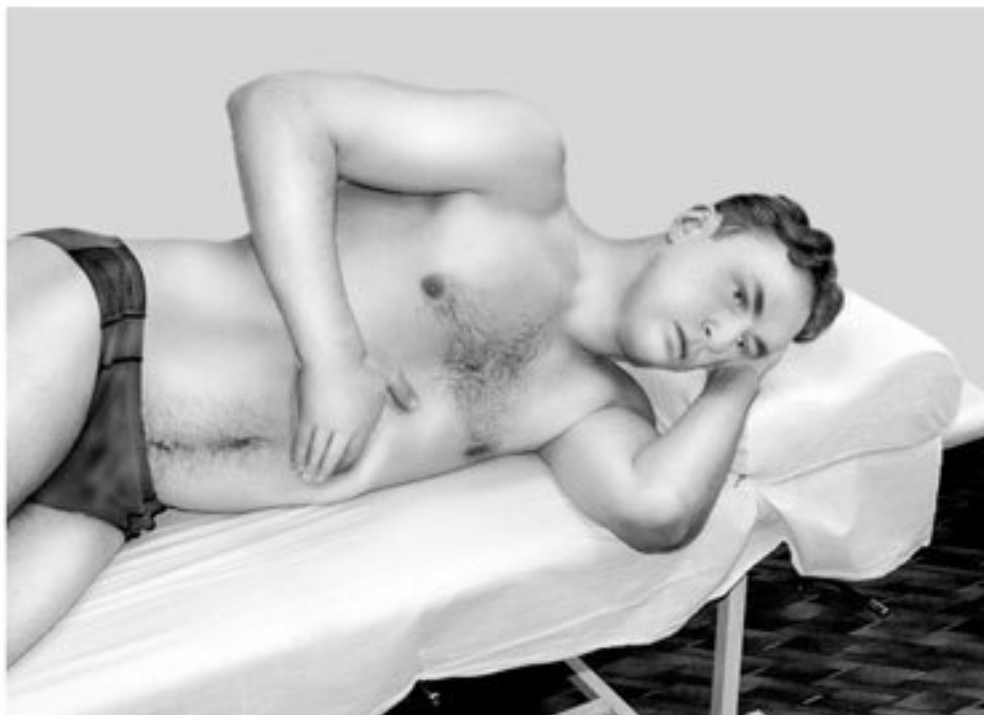
Рис. 6. Поза-движение для расслабления половины диафрагмы

Лечебное движение выполняют в положении на левом боку, ноги слегка согнуты в коленных и тазобедренных суставах, левую руку заложить за голову, правую кисть – под левое подреберье. Во время медленного вдоха в течение 9–11 секунд давить правой кистью под левую реберную дугу в направлении левого плеча, за тем 6–8 секунд расслабления, отдых, во время которого удерживать положение, достигнутое при давлении. Лечебное движение повторить 3–6 раз). Аналогично проводить процедуру с другой стороны (рис. 6).