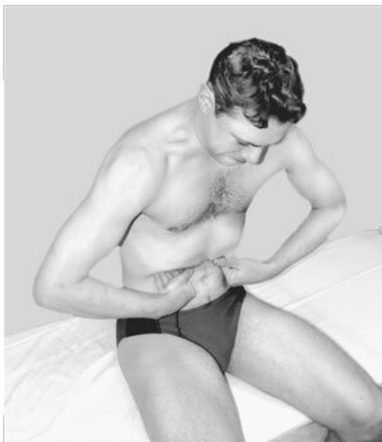
Рис. 5. Позиция-движение для расслабления диафрагмы