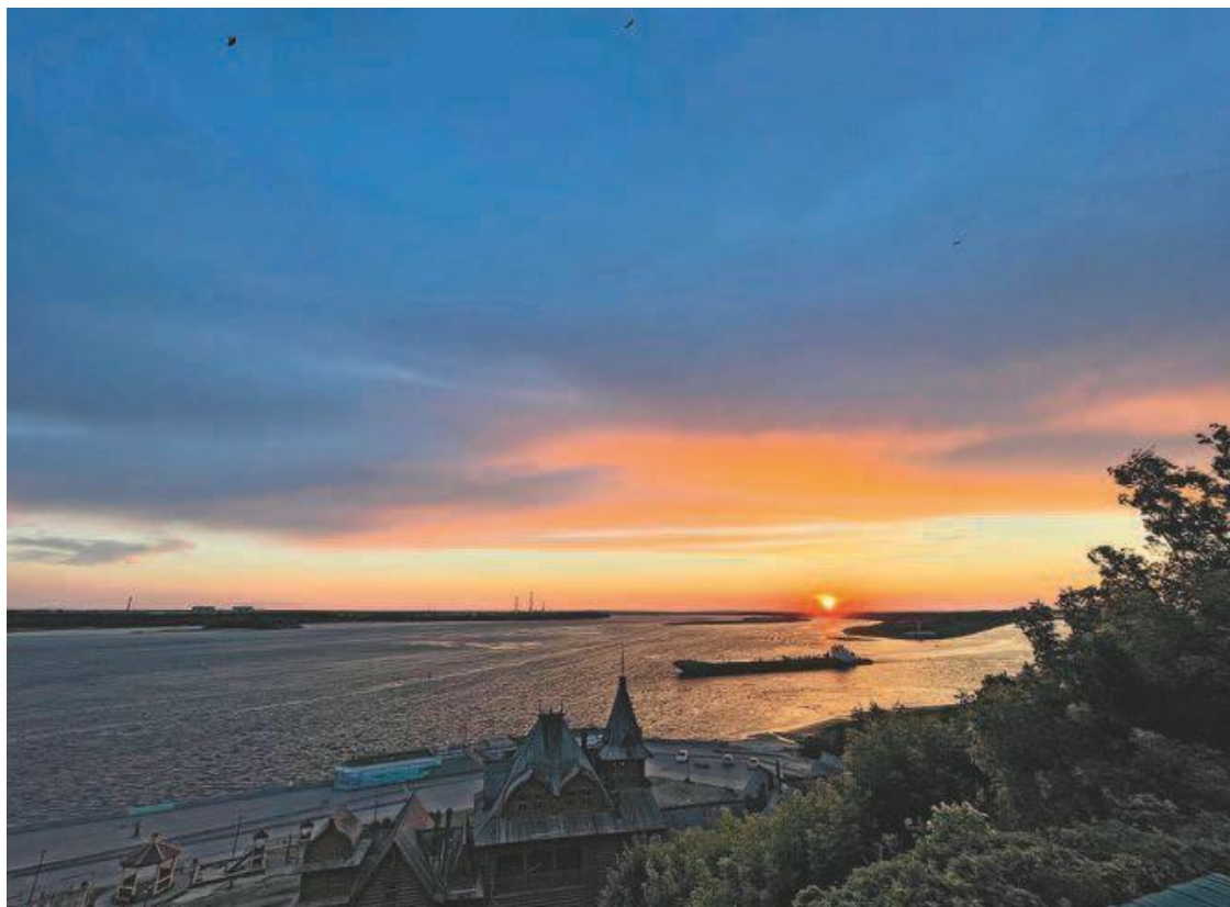
Вид на Волгу из Городца. 2022 г.