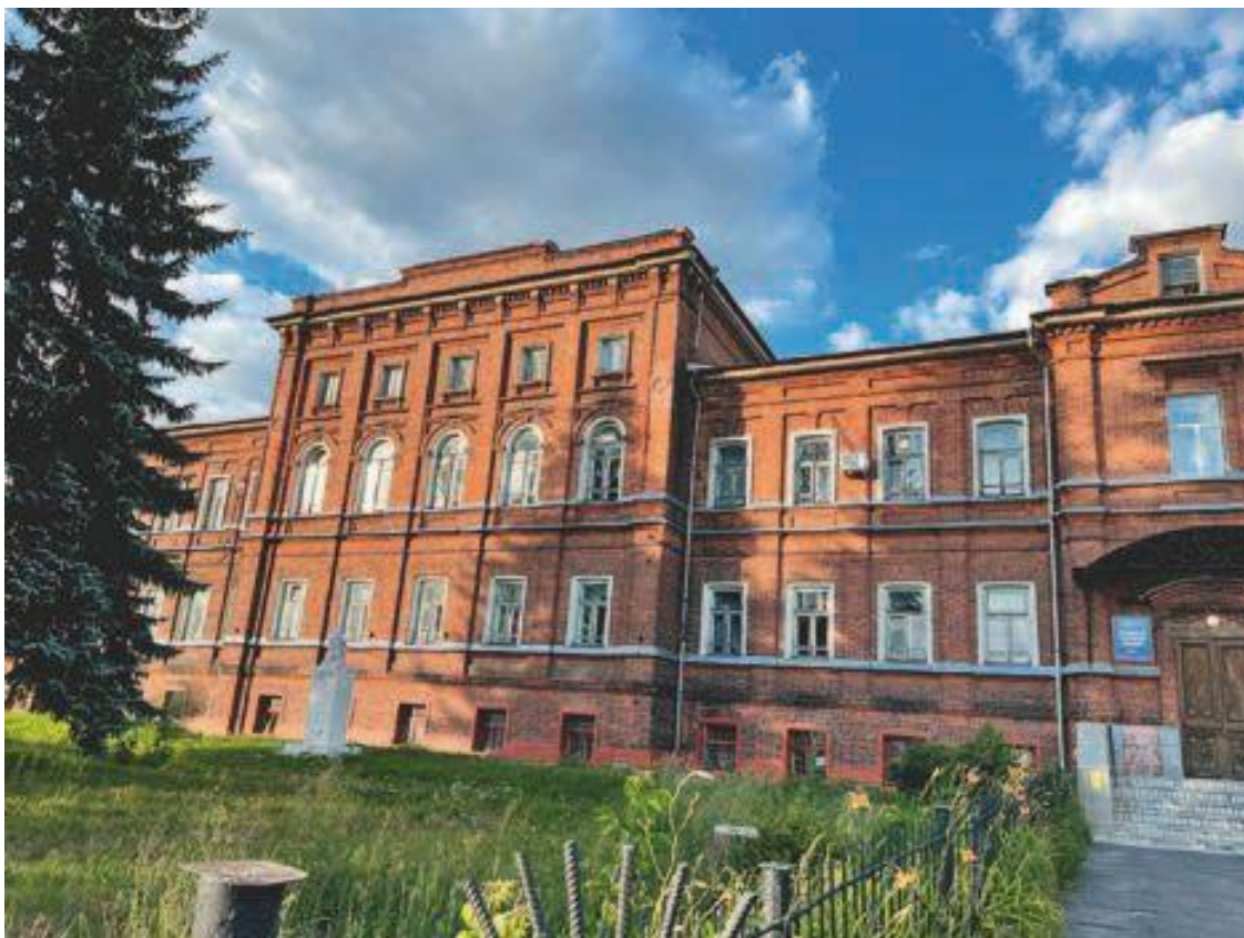
Здание Городецкого педучилища. 2022 г.