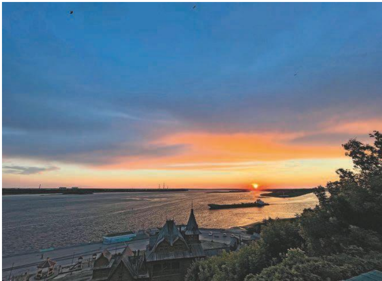
Вид на Волгу из Городца. 2022 г.