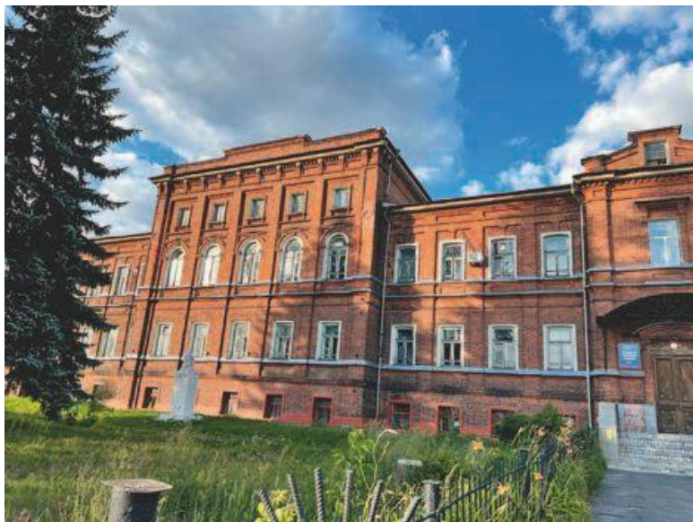
Здание Городецкого педучилища. 2022 г.

казалась им легкой прогулкой после четырех лет, проведенных в красном здании на холме.