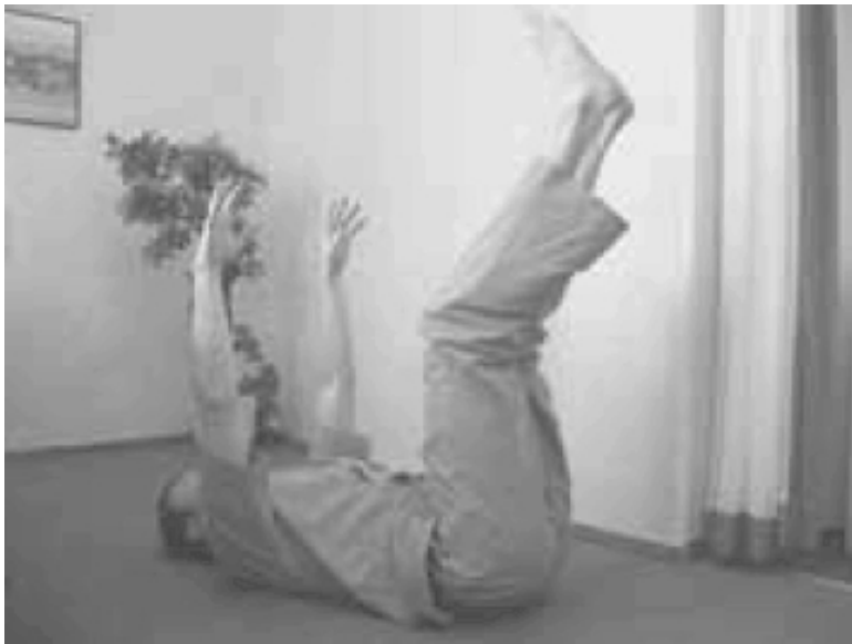
Рис. 2.8. Упражнение «жучок»

Хорошей профилактикой варикозного расширения вен нижних конечностей является велотренажер или велосипед.