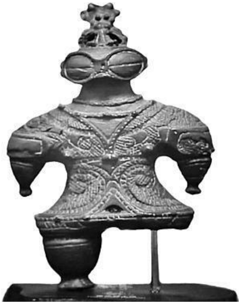
Статуэтка «догу», Музей Гиме, Париж