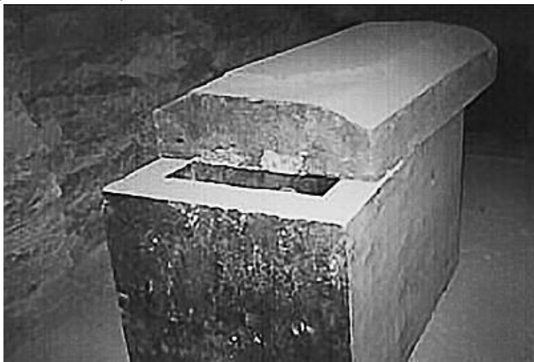
Гигантский саркофаг, Серапеем, Египет

«Я вполне допускаю, что мастера, обучавшие людей, прибыли к нам из космоса. Они предоставили им технику. Не ту, сложную, которой пользовались сами, а гораздо проще, но тем не менее гораздо более совершенную, нежели та, которая имелаась у людей».