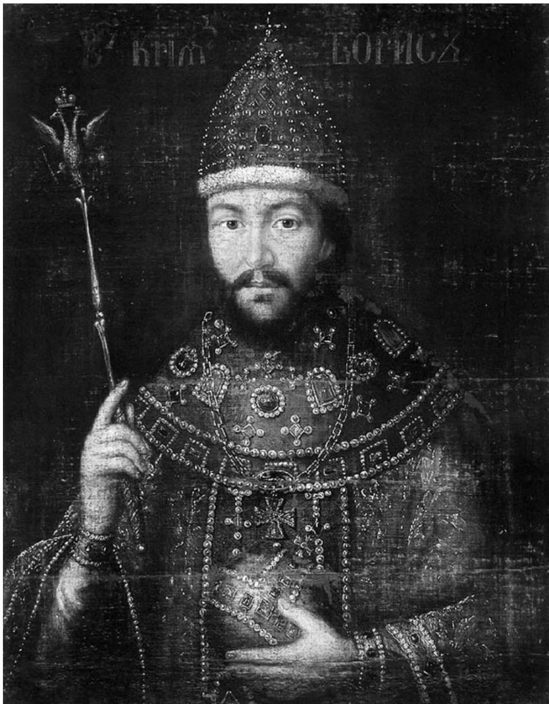
Парсуна с изображением Бориса Годунова. XVII–XVIII вв.

Мы представляем, как выглядели некоторые представители династии Рюриковичей благодаря парсунам, портретам, изображениям в Титулярнике (понятно, что многие из них даны с изрядной долей условности), скульптурам и даже реконструкциям по методу Герасимова – историка, предложившего способ восстановления облика человека по его черепу.