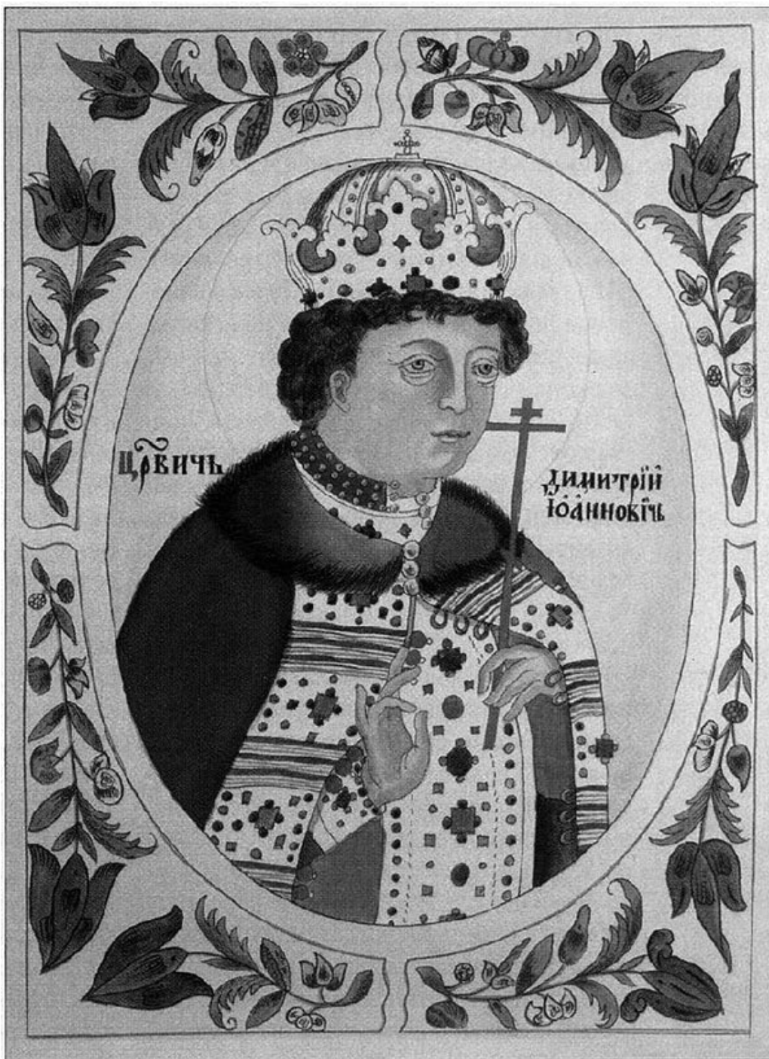
В. Н. Нечаев. Царевич Димитрий Иоаннович, копия из Титулярника XVII в. 1887 г.

Всего было убито 15 человек, и это, говоря языком юридическим, стало основанием для возбуждения «обыкновенного дела» 2 :