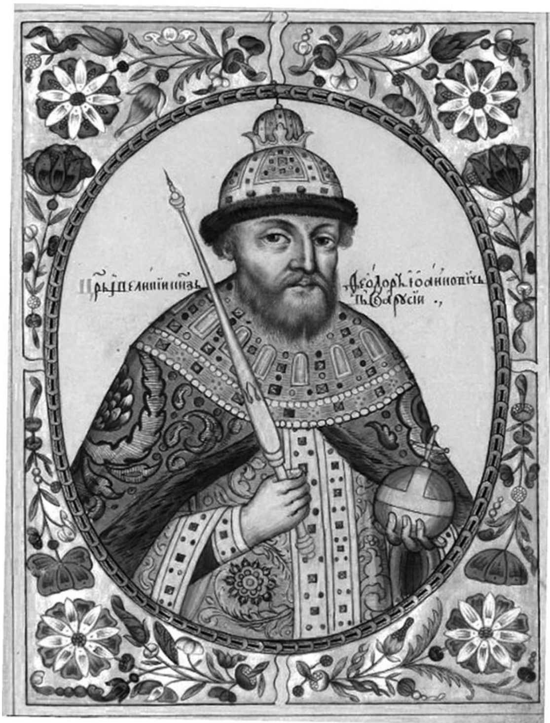
Федор Иоаннович, портрет из Царского титулярника, лицевая рукопись. 1673 г.

У Ирины Годуновой есть родной брат Борис, который на долгое время станет одним из главных героев нашей истории. Расклад получается изящным: не особенно интересующийся делами государства царь, «о мирских ни о чем попечения не имея, токмо о душевном спасении», и брат жены, амбициозный, заинтересованный, выдвинувшийся еще при Грозном, зять Малюты Скуратова.