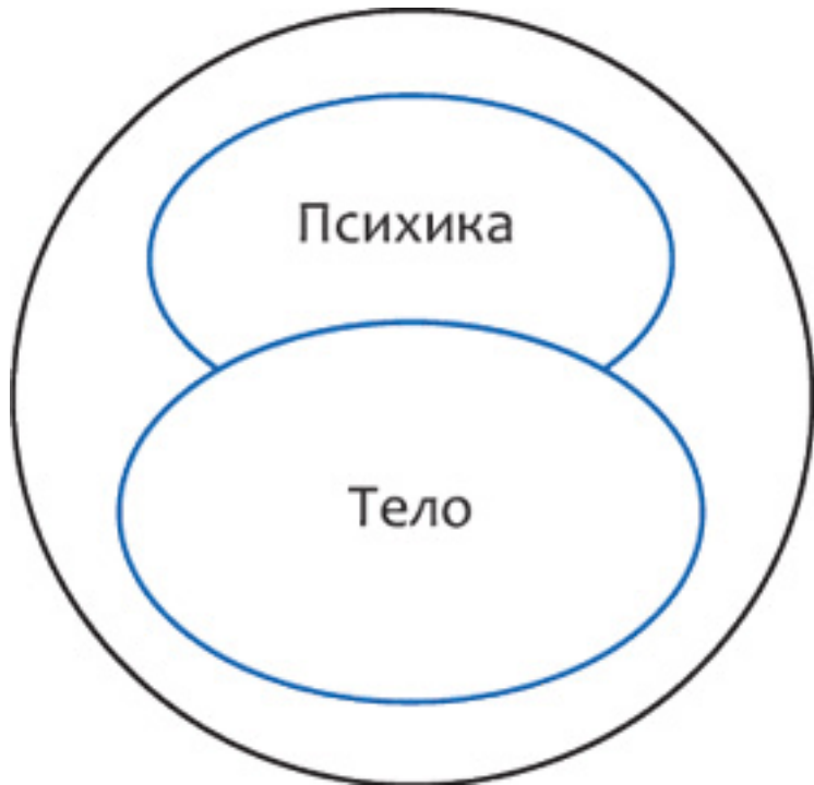
Рис. 1. Единство телесного и психического начал в человеке

И тело, и психика в ходе эволюции приобрели различные способы саморегуляции и адаптации к внешним условиям жизни.