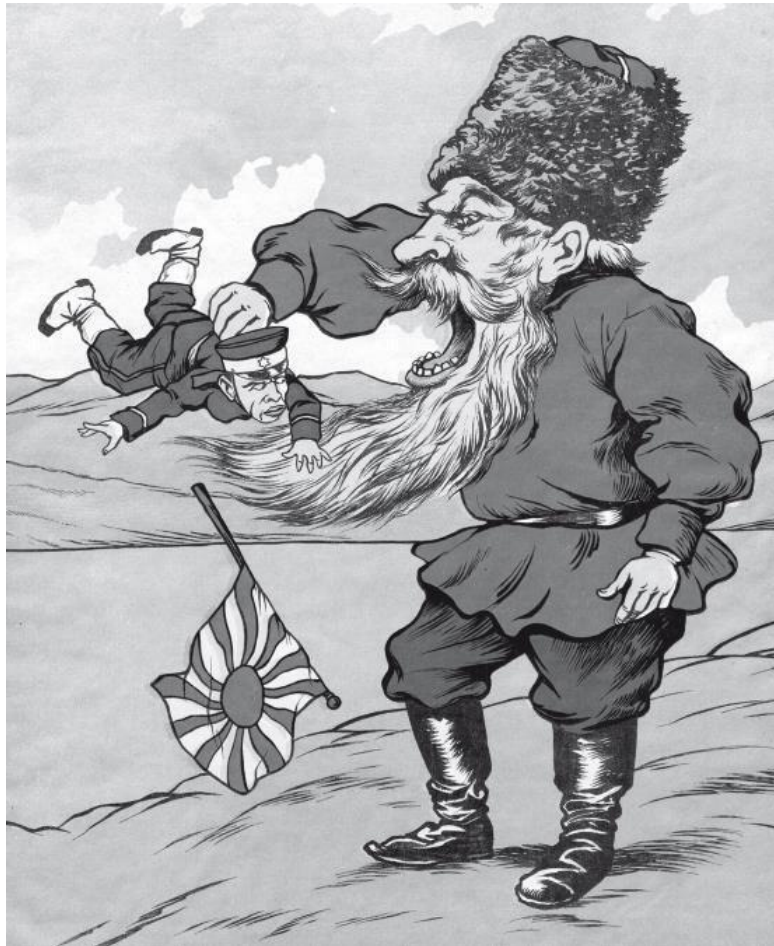
Милитаристский плакат времен русско-японской войны