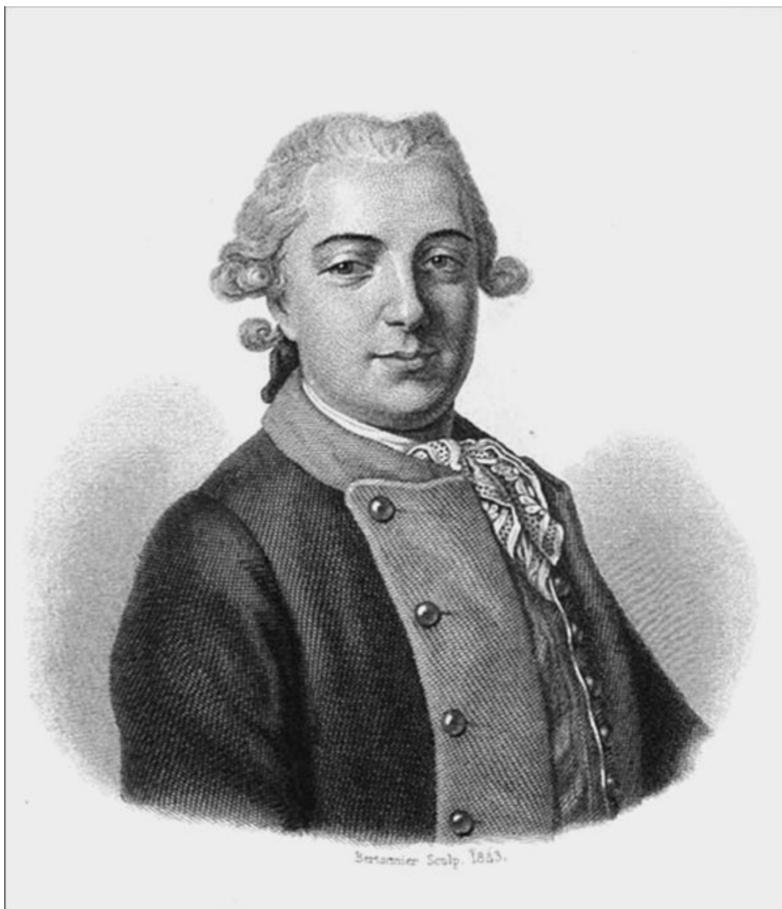
С. А. Порошин. Старинная гравюра

Тут следует пояснить, что Ролленовой историей в ту пору именовали «Историю о римских императорах с Августа по Константина», начатую Ролленом Шарлем (1661–1741) и законченную Жаном Батистом Луи Кревье (1693–1765). Перевод с французского языка выполнен был Василием Кирилловичем Тредиаковским (1703–1769), русским поэтом, переводчиком и филологом, которого называли «отцом русского стихосложения», поскольку он явился одним из основателей силлабо-тонического стихосложения, в основе которого чередование в определённом порядке ударных и безударных слогов. Эта «История...» была издана в четырёх томах в 1767–1769 годах типографией при Морском шляхетском кадетском корпусе.