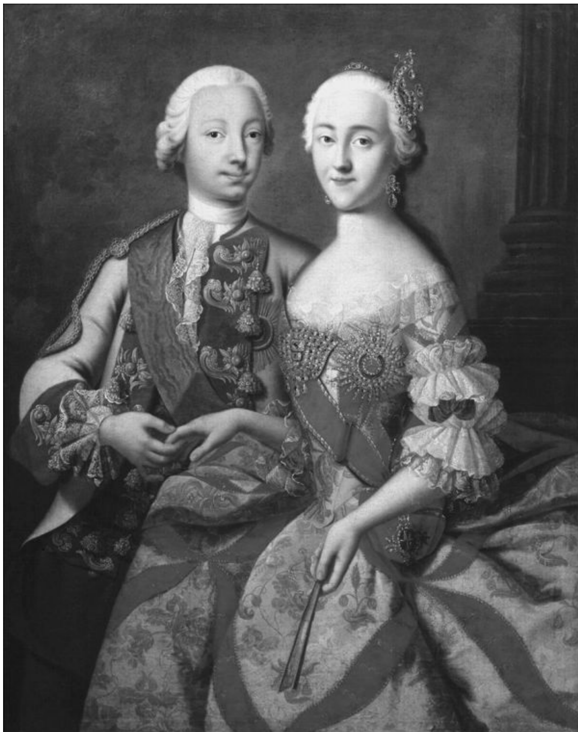
Портрет цесаревича Петра Фёдоровича и великой княгини Екатерины Алексеевны. Художник Г. Гроот

Многое открывает в тайне рождения наследника то, что рассказала Екатерина в своих записках: