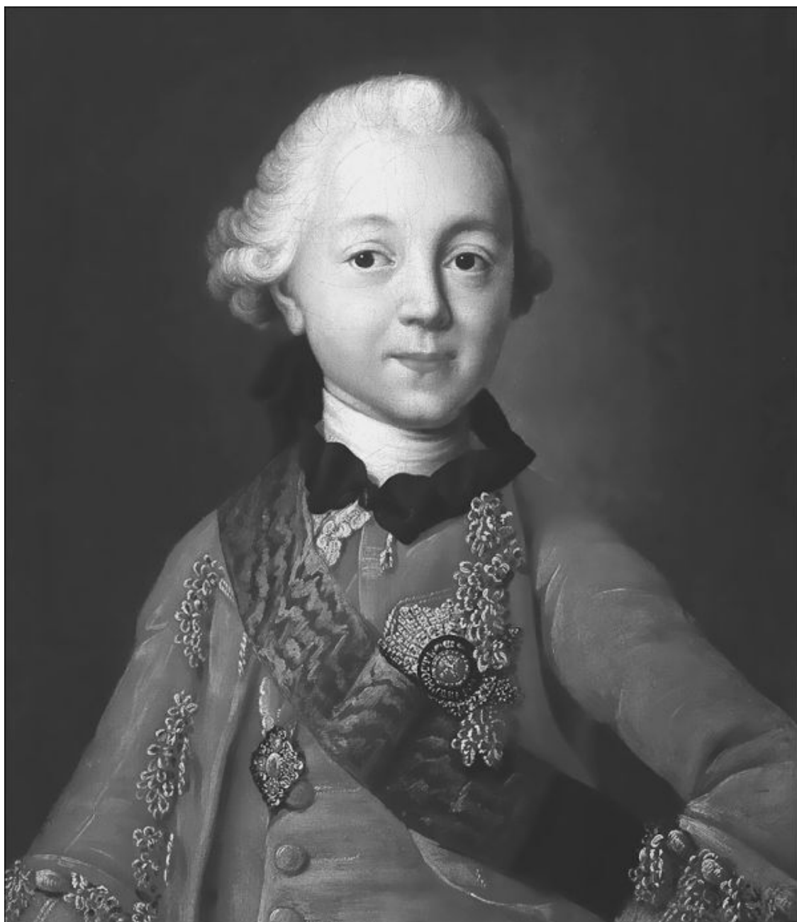
Портрет великого князя Павла Петровича в детстве. Художник А. П. Антропов