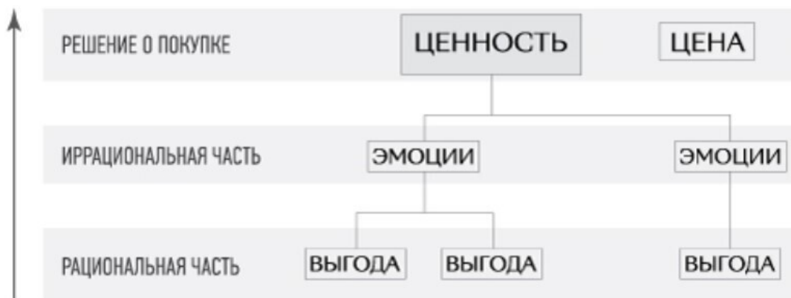
Рис. 3. Влияние рациональных выгод на решение о покупке

Очень много школ продаж, зная об эмоциональной природе принятия решений, пытаются научить менеджеров и целые сбытовые подразделения давить именно на эту эмоциональную кнопку. Продавцы учатся НЛП, психологическим приемам продаж – привязке, установлению раппорта, активному слушанию, технике комплиментов... Маркетинг задействует популярных актеров, яркие цвета и милых животных, чтобы надавить на эмоции человека. И, конечно же, маркетинг прекрасно умеет апеллировать к иррациональной ценности предложения – комфорту, эстетике, морали. И зачастую, когда мы говорим о рынке FMCG или о консьюмерском рынке 12 , это срабатывает, потому что человеку в ряде случаев достаточно приятных эмоций, которые сопровождают сделку, чтобы склониться к решению о покупке здесь и сейчас. То есть самому себе придумать, что у продукта есть рациональные выгоды, о которых ему будет приятно узнать после покупки. Обычно это связано с шопингом – тратой денег для удовольствия. Но только в ряде случаев.