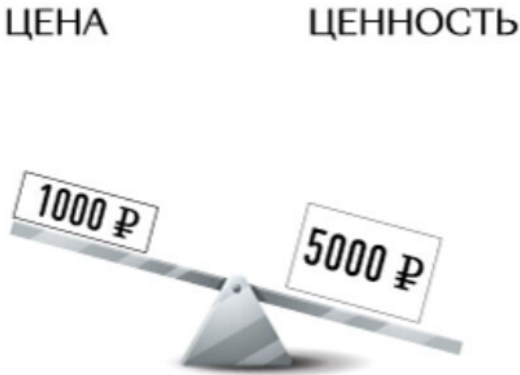
Рис. 4. Качели принятия решения о покупке

Пример. В магазине висят штаны за 1000 рублей, но ценник плохо закрывает (или не закрывает) предыдущий с надписью «5000 рублей». В голове покупателя сразу возникают те самые качели принятия решения следующего вида: