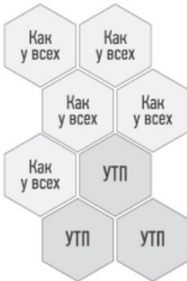
Рис. 5. Образ ценности как пазл

Представим, что клиент изучает информацию о предложении, и образ ценности формируется как пазл из выгод, который мы по факту можем разделить на две части.