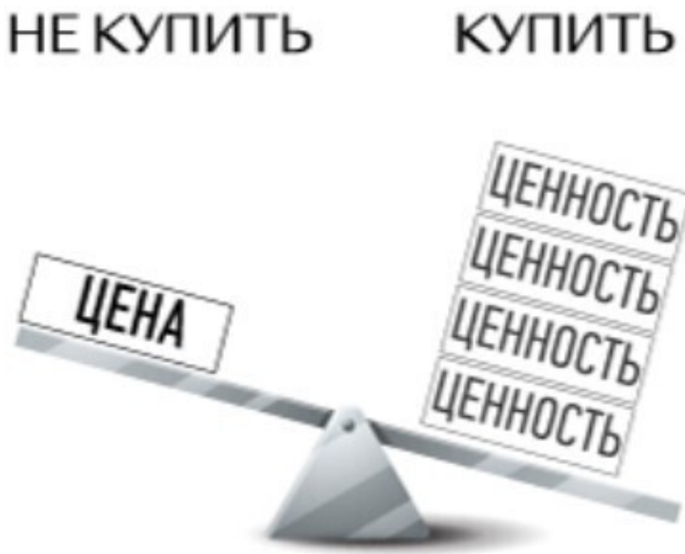
Рис. 1. Качели принятия решения

Взглянем пристальнее на классические качели принятия решения: