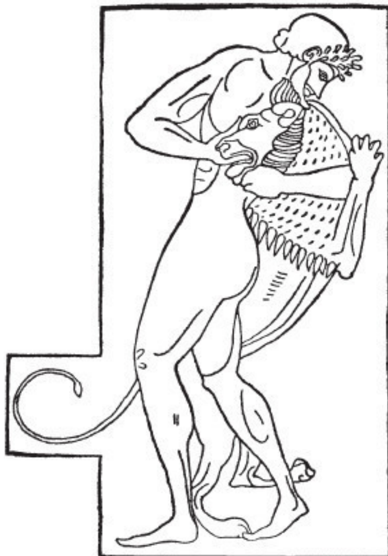
Рис. 1. Геракл, удушающий немейского льва