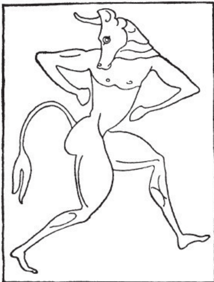
Рис. 5. Минотавр

Оба они, смущаясь, то вниз глаза опускали, То опять друг на друга снова взоры бросали Из-под светлых бровей, расточая отрадно улыбки.