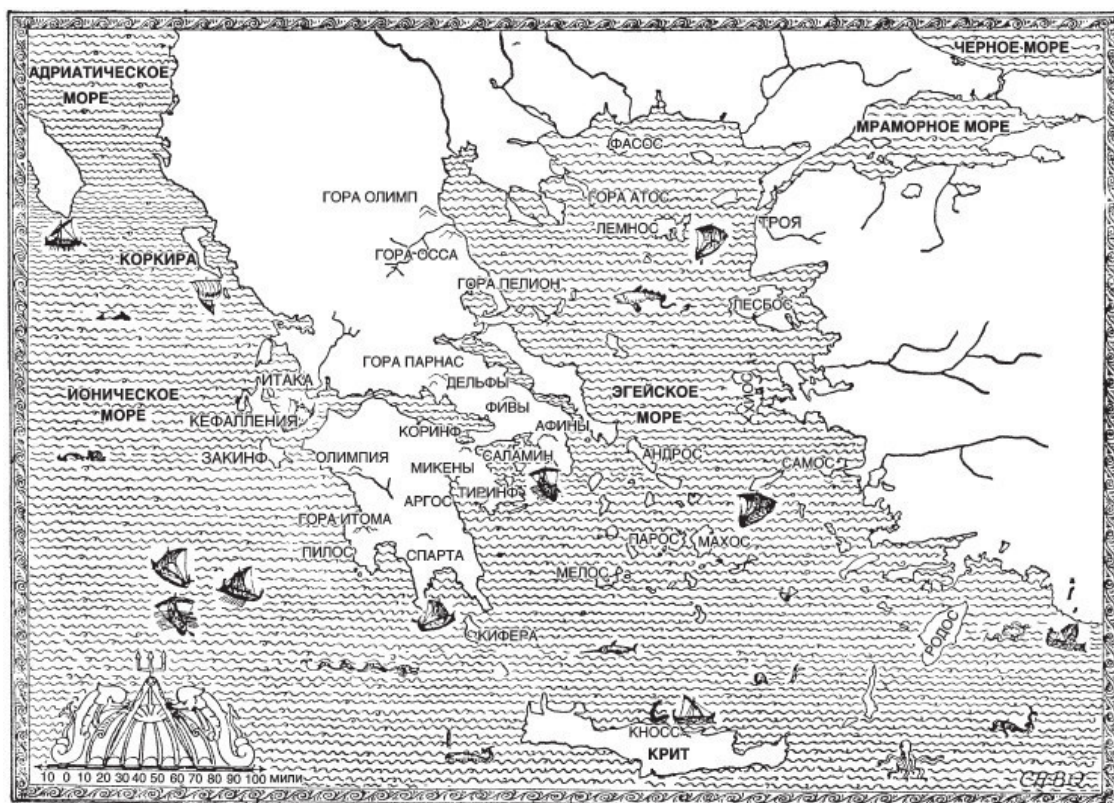
Карта Греции во времена Гомера вместе с окружающими ее морями

Поскольку самые вдохновенные строки поэмы посвящены любовной истории Ясона и Медеи, мы также вкратце остановимся на ней. Эрот пришел во дворец с Ясоном, и Медея могла наблюдать за беседой последнего с ее отцом Ээтом. Эрот выбрал удачный момент, натянул свой лук, вытащил стрелу из колчана и выпустил ее в Медею.