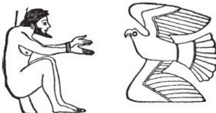
Рис. 4. Прометей

Между тем к их ногам Ликорей, Амика прислужник, С двух сторон положил по паре ремней сыromятных, Были сухими они и еще подсушены очень.