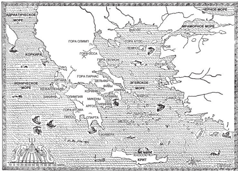
Карта Греции во времена Гомера вместе с окружающими ее морями

Поскольку самые вдохновенные строки поэмы посвящены любовной истории Ясона и Медеи, мы также вкратце остановимся на ней. Эрот пришел во дворец с Ясоном, и Медея могла наблюдать за беседой последнего с ее отцом Ээтом. Эрот выбрал удачный момент, натянул свой лук, вытащил стрелу из колчана и выпустил ее в Медею.