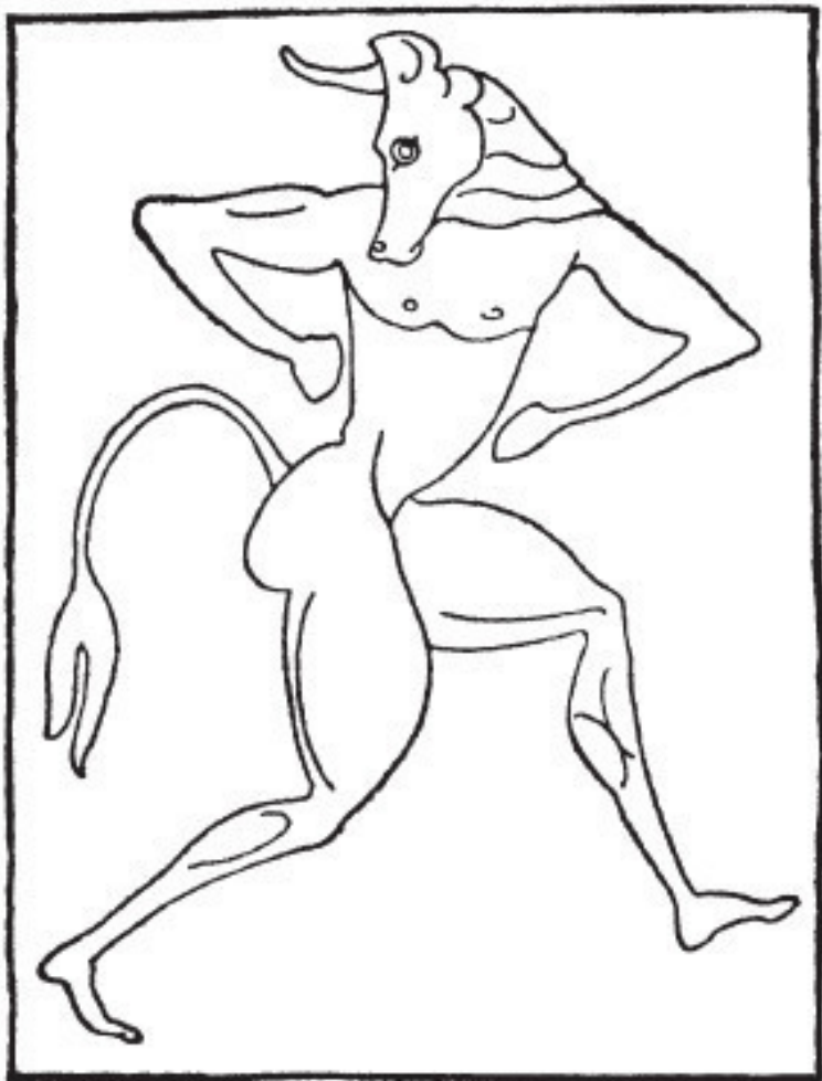
Рис. 5. Минотавр