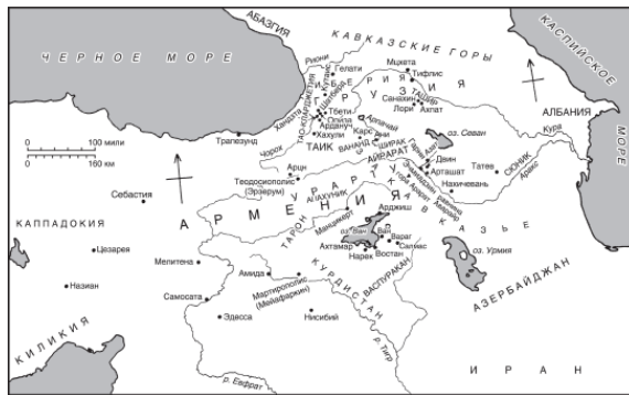
Рис. 1. Армения и соседние страны

Систематические раскопки на склонах гор Арагац и Арарат, в Сатани-Даре и вдоль среднего течения реки Раздан доказали, что Армянское нагорье обитаемо начиная с периода нижнего палеолита. Каменные орудия, найденные в соответствующих слоях в названных районах, имеют все характерные черты артефактов этого периода. Кроме того, была найдена усовершенствованная техника среднего и верхнего палеолита. Сцены охоты, вырезанные на стенах пещер их обитателями середины каменного века, изображают людей, вооруженных луками и стрелами и сопровождаемых собаками, которые преследуют оленей, серн и диких баранов. Переход от кочевого к оседлому образу жизни произошел в период неолита; люди начали селиться в домах круглой или прямоугольной формы, построенных из необожженного кирпича, а иногда и из камня, и обрабатывать землю, выращивать быков, коров и овец.