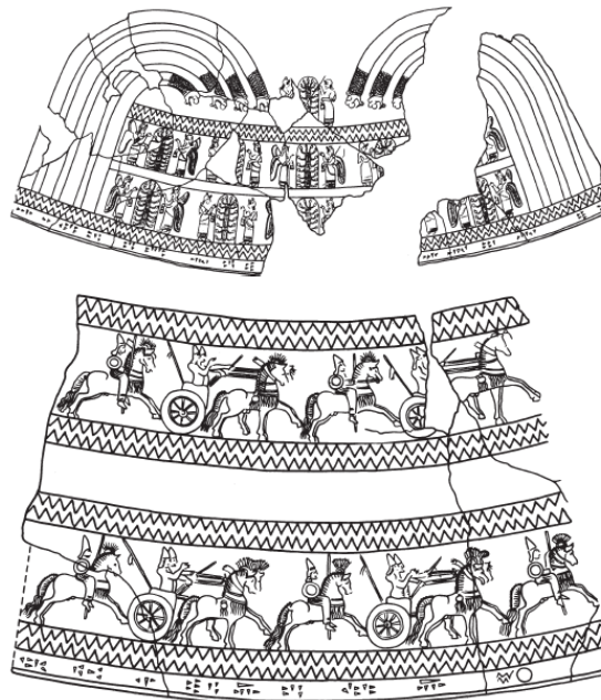
Рис. 4, 5. Изображения на бронзовом шлеме Сардури II. Ереван, Армянский исторический музей (по Пиотровскому)

На первом этаже было около 150 комнат, в некоторых сохранились гигантские кувшины для хранения вина или зерна. В комнате, украшенной настенной росписью, один из кувши-