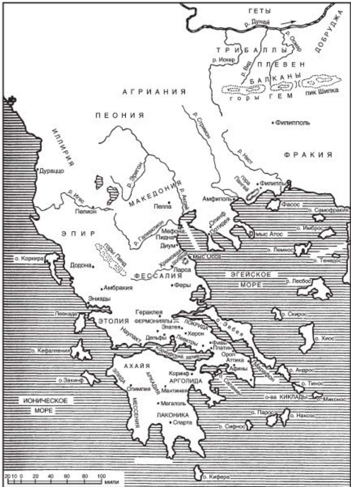
Карта 1. Греция

Фиванцы, обретя на короткое время контроль над Амфикиктией, чтобы отомстить фокийцам, которые сражались на стороне Спарты в сражении при Левктрах, через совет передали угрозу, что, если фокийцы, во главе которых тогда стоял Филомел, не заплатят выкуп за возделывание земли возле Дельф, в области, посвященной Аполлону, им будет объявлена война. Фокийцы отказались платить, и осенью 355 г. до н. э., когда Фиванцы объявили войну