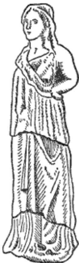
Рис. 3. Мраморная статуэтка из Нисы, видимо изображение богини. Масштаб примерно 1:2. II в. до н. э.

Далее пробел в истории Парфии вплоть до 217 г. до н. э., когда Тиридат занял Гирканию и Комитену, получив богатые земли у юго-восточных берегов Каспия. После этого он перенес свою столицу в селевкидский город Гекатомпил, местоположение которого до сих пор не обнаружено, но известно, что он находился на главном торговом пути через Иран. После его смерти около 211 г. до н. э. царем стал его сын; по-видимому, первый Артабан. К 209 г. до н. э. парфянам принадлежала территория, простиравшаяся до Экбатаны в Мидии, но в этот момент преемник Селевка Антиох III получил возможность отвоевать взбунтовавшиеся провинции. В ходе долгой кампании он снова взял Экбатану, обратил в бегство парфянских всадников, отправленных Артабаном разрушить драгоценные подземные каналы у соляной пустыни, и без труда занял Гекатомпил. Затем он с жестокими боями прошел через Тапуру в восточном Эльбурсе, отвоевал Гирканию и, наконец, заключил союз с Артабаном. Антиох завершил свои успехи, заставив признать свое главенство и Евтидема, правителя Бактрии. Затем, чтобы продемонстрировать восстановление правления на востоке, Антиох прошел дальше, следуя по пути Александра Македонского по Гиндукушу, через перевал Хибер в Пенджаб, и вернулся в Селевкию на Тигре через Сейстан и Карманию. Его экспедиция уменьшила размеры Парфии, однако государство сохранилось.