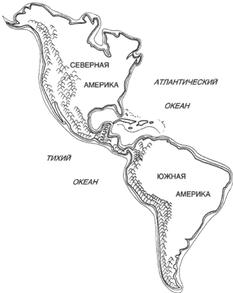
Карта Америки. Горы хребта, простирающегося с севера на юг, занимают всю площадь Центральной