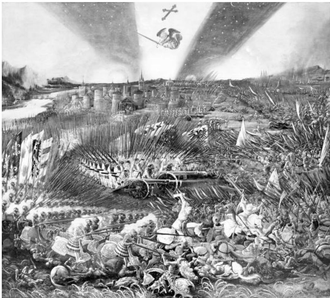
Победа Карла Великого над аварами. Художник Альбрехт Альтдорфер. 1518

В 805, 806 и 807 годах франкские войска опустошили земли сербов, гломачей и чехов и заставили эти племена признать свою зависимость от франкского короля. Биограф Карла Великого Эйнгард писал, что все варварские народы от Дуная до Вислы и Балтийского моря должны были признать себя его данниками.