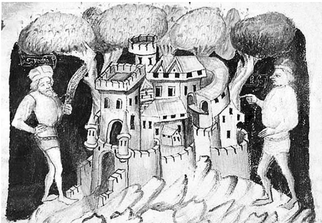
Легендарные Чех и Лех рядом с Пражским Градом.

Миниатюра из Будишинского списка «Чешской хроники» Козьмы Пражского. XIV век