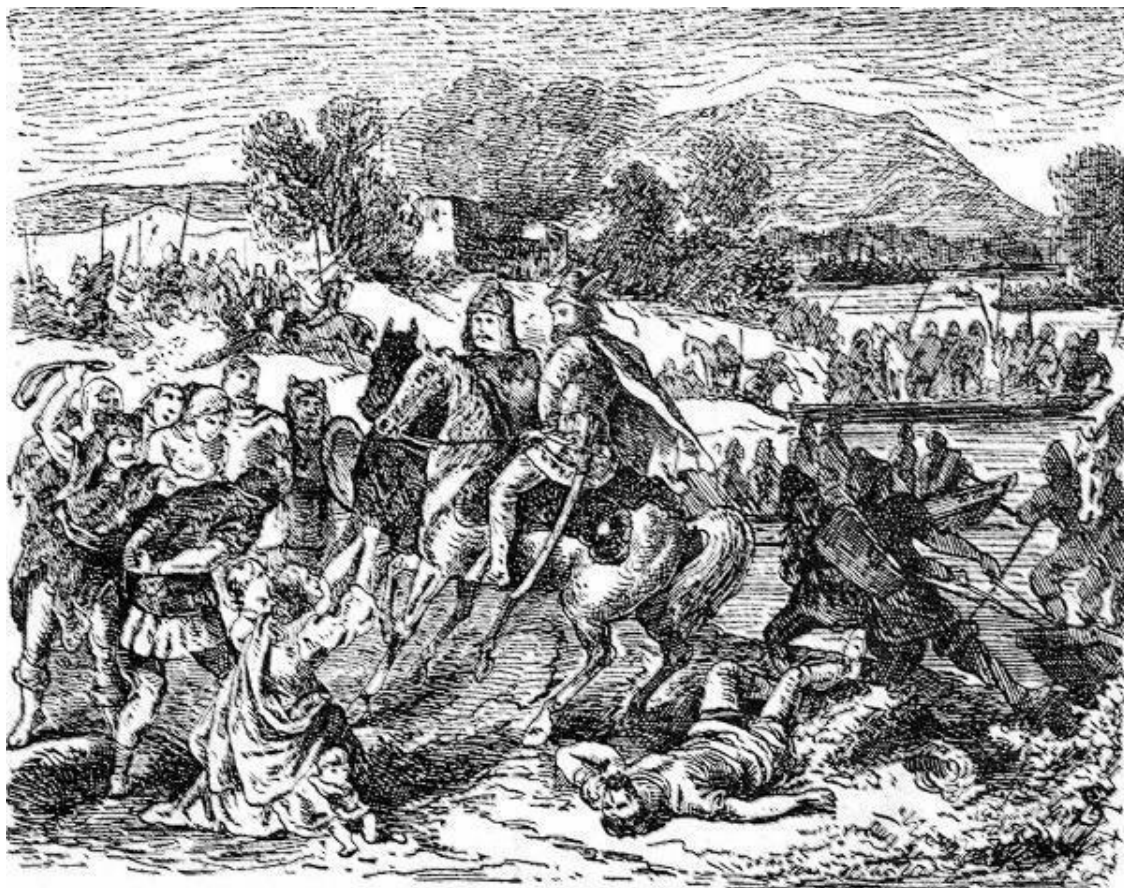
Авары разоряют славянские земли. Иллюстрация XIX века

Это было время процветания Византийской империи, которой приходилось отражать натиск как аваров, так и славян. С помощью дипломатических интриг византийцам иногда удавалось разжигать раздор между славянами и аварами для предотвращения набегов на собственные границы. В 581 году 100 тысяч славян вторглись во Фракию. Византийский император династии Юстиниана Тиберий II Константин послал к кагану посольство с просьбой, чтобы тот напал на славян. Во главе шестидесятитысячного войска Баян форсировал Дунай и, вторгнувшись в славянские земли, опустошил и разорил их селения.