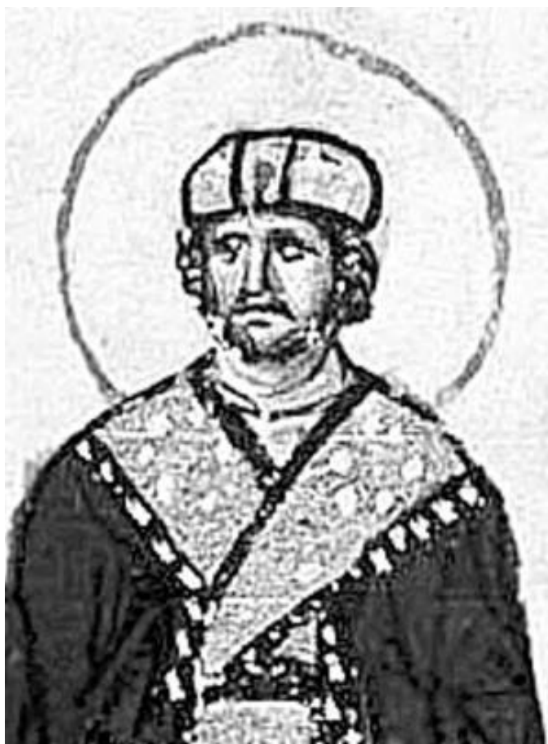
Император Михаил III.

Ростислав понимал, что для обретения настоящей независимости нужна церковь, не находящаяся под влиянием франков. С этой целью Ростислав решил найти политическую поддержку у Византии и создать национальную церковь, подчинявшуюся непосредственно Константинополю.