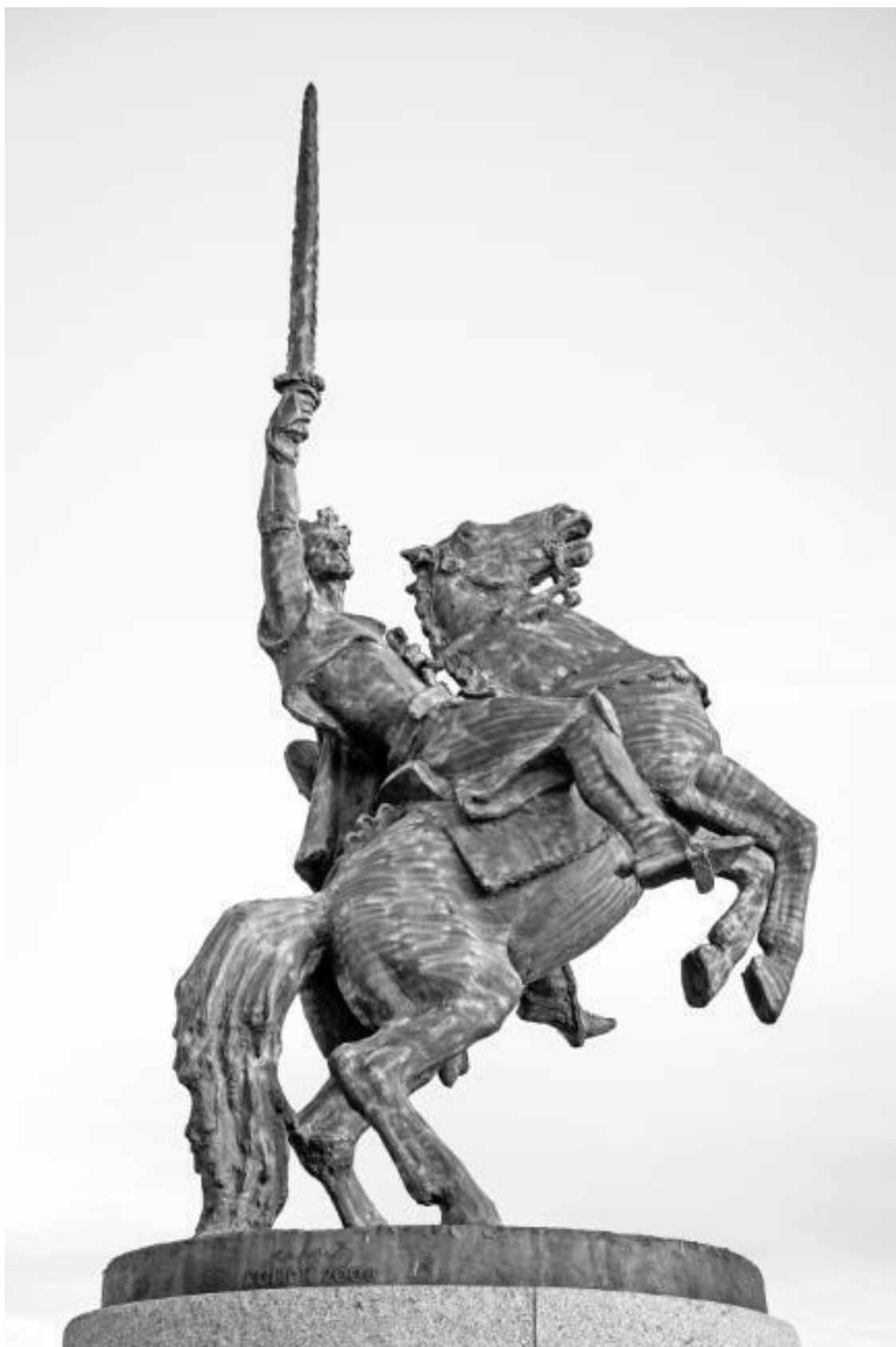
Памятник Святополку I в Братислав

В определенных рамках Моравия все же сохранила свою независимость. В результате военных набегов на близлежащие земли Святополк даже сумел расширить границы своих владений. С его правлением наступает период расцвета и подъема Моравии. В это время государ-