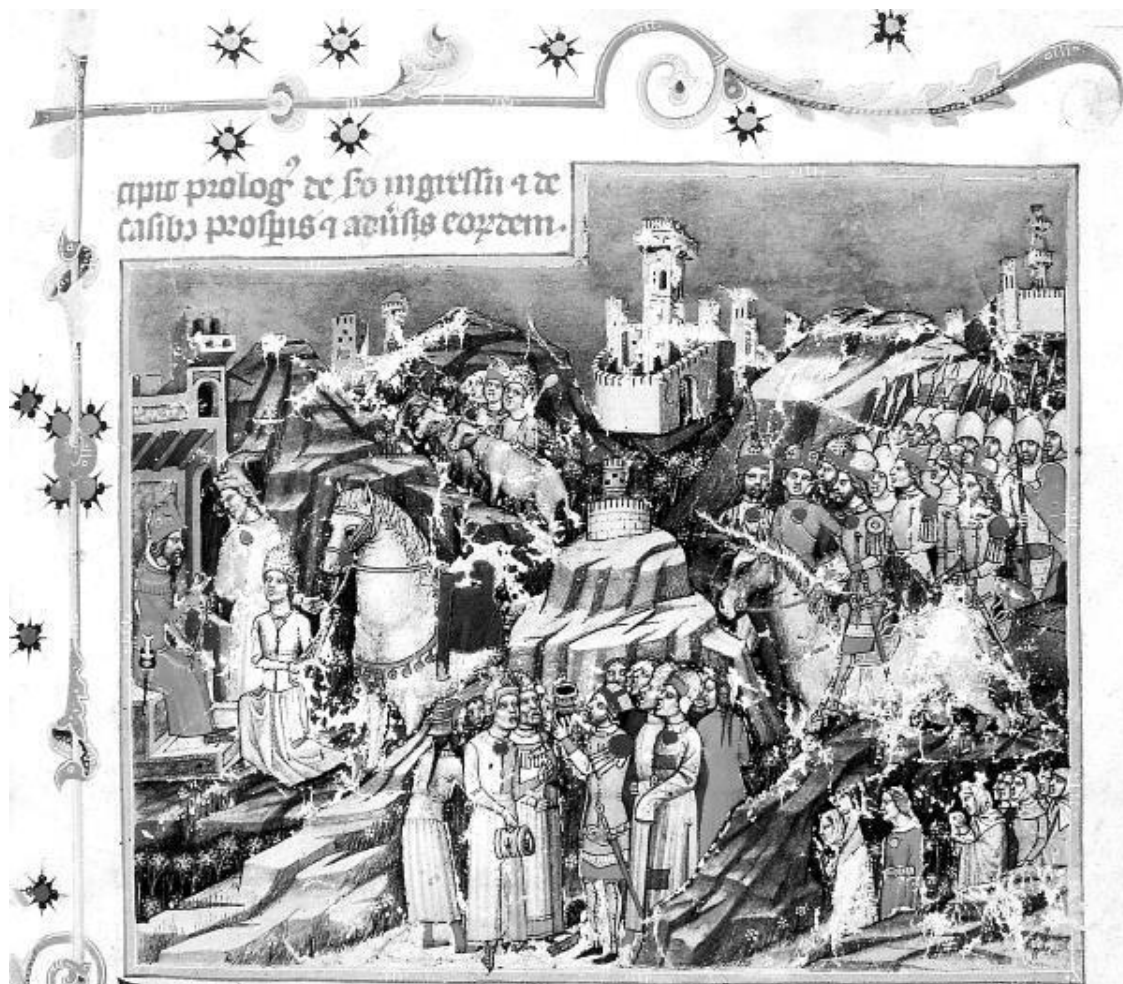
Переход мадьяр через Карпаты.

После смерти Святополка государство было разделено между его сыновьями – Моймир II стал верховным князем, а Святополк II получил в удел паннонские и словацкие земли. Местные князья увидели в этом благоприятный момент для восстания. Некоторые из них признали свою зависимость от Восточнофранкского государства. Например, чешские Пржемысловичи и лужицкие сербы.