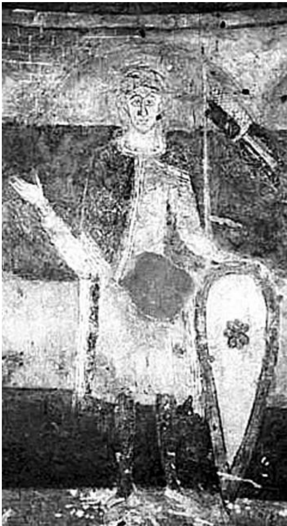
Князь Само. Фреска в ротонде Св. Екатерины в Зноймо. XII век