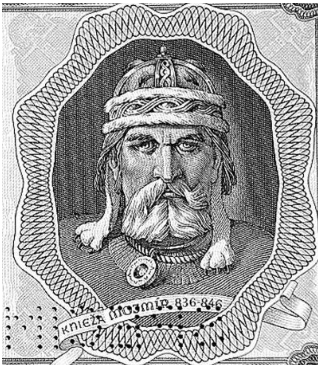
Моймир I. Изображение на словацкой банкноте. 1944

Великая Моравия включала в себя земли, находящиеся на территории нескольких современных стран – Венгрии, Словакии, Чехии, Польши, Украины и Германии. Столицей государства, как считают некоторые исследователи, был город Велеград.