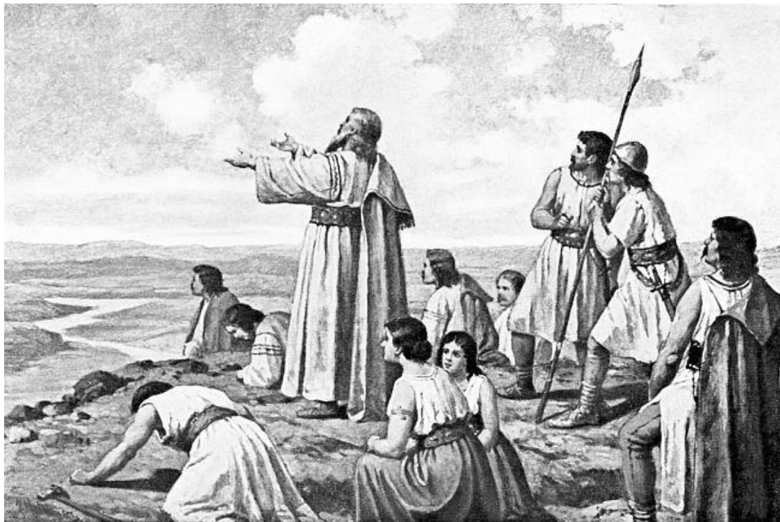
Праотец Чех на горе Ржип. Художник Йозеф Матхаузер. XIX век

северо-западной Чехии; по сравнению с южной Чехией племена были достаточно сильными, чтобы отражать натиск завоевателей. Кельтские племена оставили свой след в названиях некоторых рек – Лаба, Йизера и др. Впоследствии судьба боев сложилась следующим образом: они либо были вытеснены из областей, где проживали, либо уничтожены германскими племенами, мигрировавшими на юг.