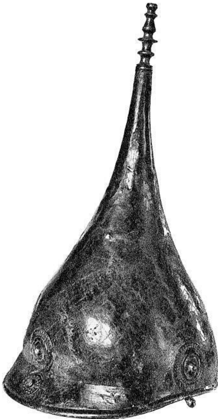
T.G.E. POWELL the CELTS