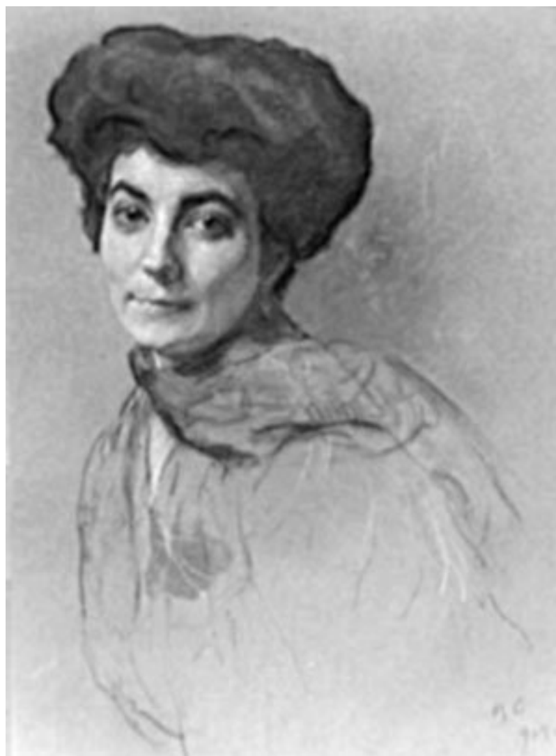
В.А. Серов. Портрет Е.И. Рерих. 1909 г.

Ее результаты поражают: Музей Николая Рериха, Мастер-Институт Объединенных Искусств, Международный художественный центр «Corona Mundi». Эти учреждения, организованные Н.К. и Е.И. Рерихами, стали крупными культурными центрами, влияние которых распространилось за пределы страны, став международным. Многочисленные общества, творческие клубы и образовательные учреждения, действующие во всем мире под эгидой этих организаций, объединили под всеобщим куполом Культуры не только творческих людей, но и всех тех, кто стремился к воплощению гуманистических идеалов и усовершенствованию жизни. «Радостно видеть, – пишет Елена Ивановна, – как в дни разрушения светлые души собираются во имя Культуры, стараясь сохранить огонь и дать радость творческого созидания и расширения сознания ищущим выхода из создавшегося умственного тупика, ведущего за собою и материальное бедствие».