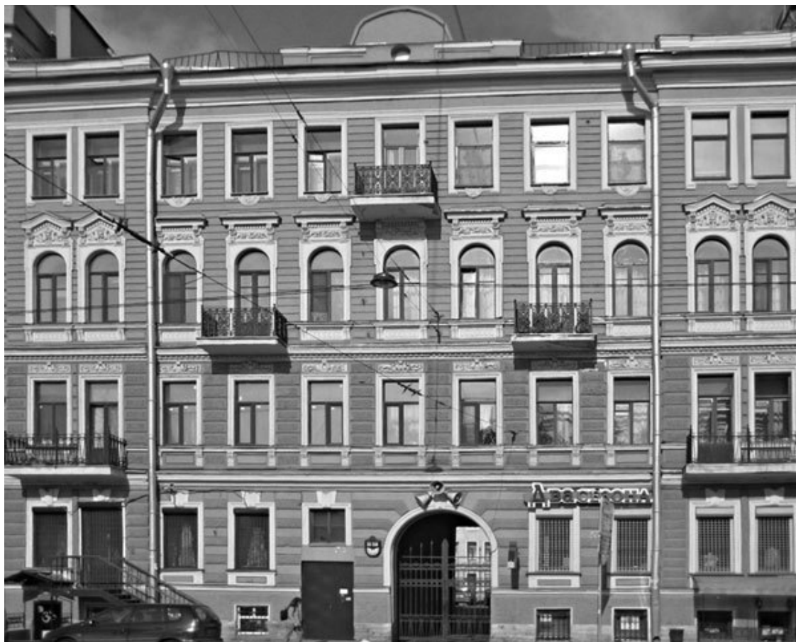
Дом № 17