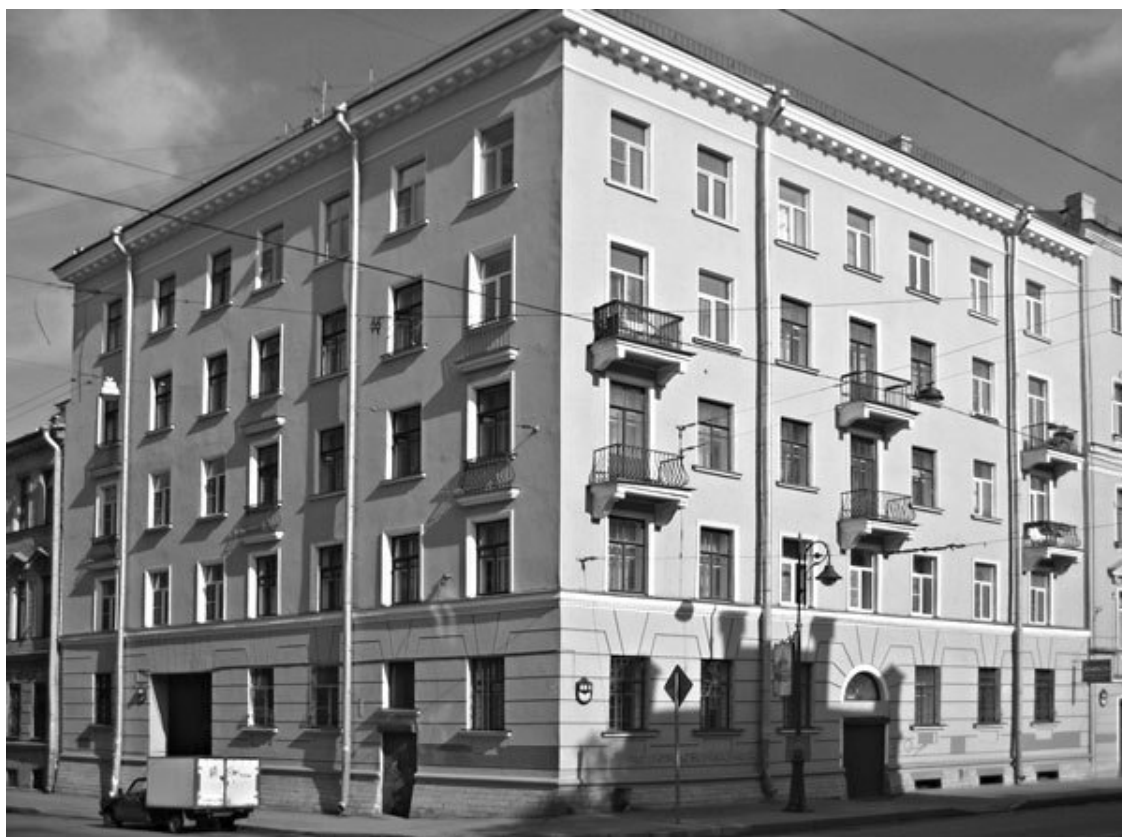
Дом № 7