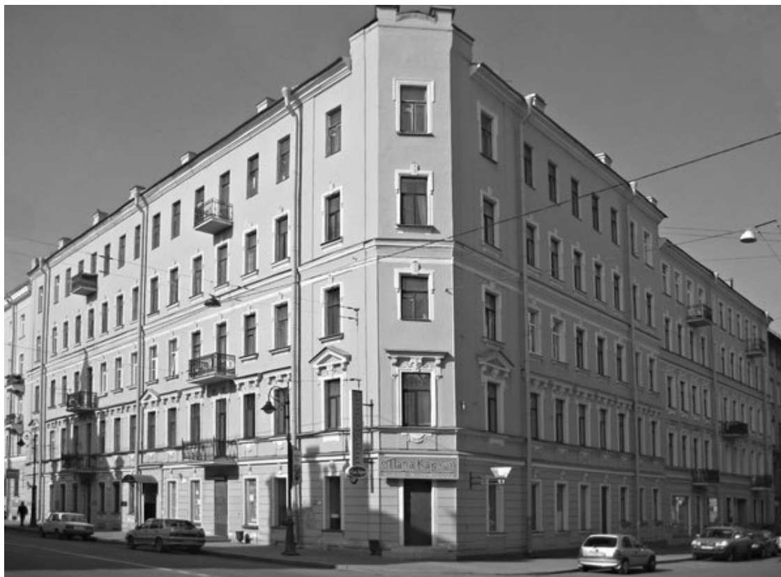
Дом № 3

Отделенный от здания гимназии Озерным переулком одноэтажный каменный дом, занимавший всю ширину участка по набережной (более 10 сажен), в середине XIX в. принадлежал жене действительного статского советника Анне Карловне Серовой. На Озерной переулок выходила более протяженная граница участка, общая площадь которого составляла 272 кв. сажени.