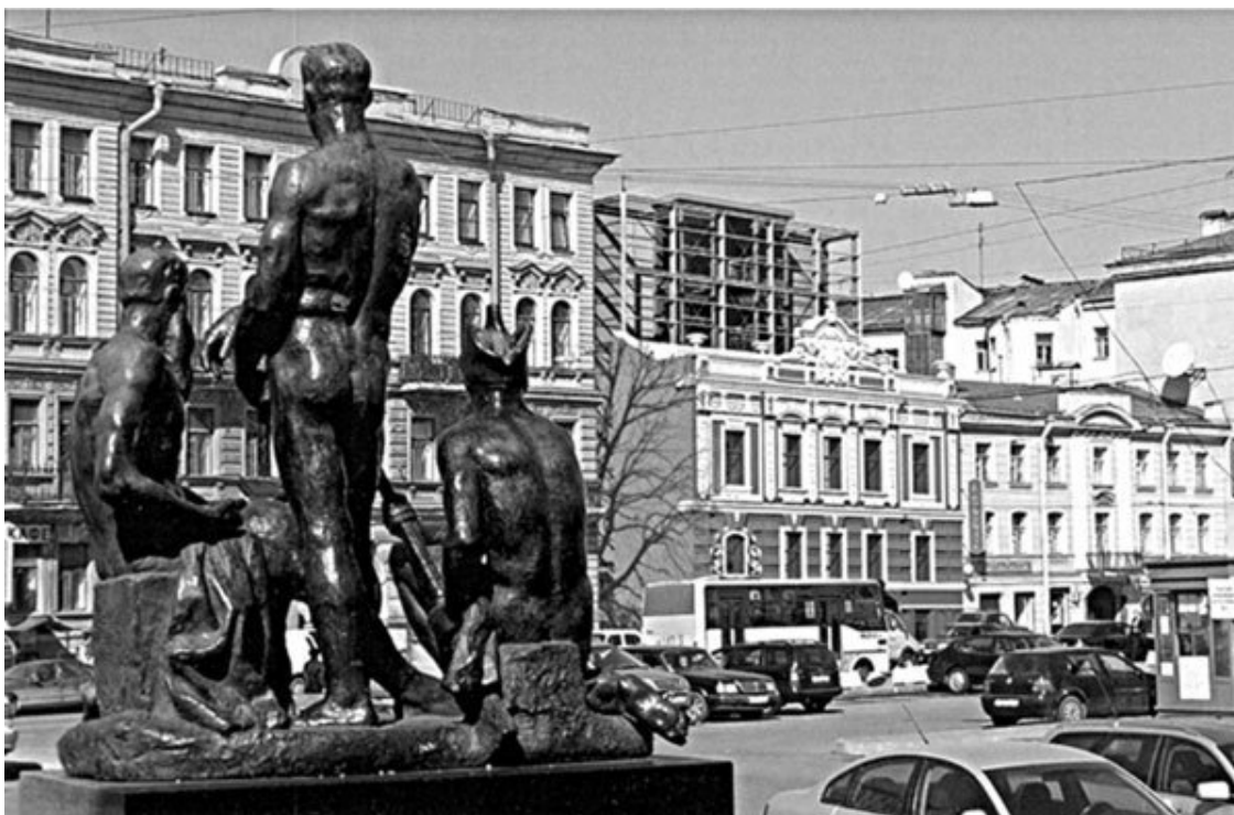
Строительство бизнес-центра на месте домов № 13—15

После постройки напротив дома № 13–15 Большого концертного зала «Октябрьский» (БКЗ) этот дом использовали как гостиницу для гастролирующих артистов, а позже в нем располагался административно-хозяйственный отдел БКЗ (здание передано концертному залу в 1994 г.). В 2001 г. весь комплекс трехэтажных зданий был включен в список вновь выявленных объектов культурного наследия, а уже через три года БКЗ получил разрешение на разборку здания, признанного аварийным, и строительства на его месте здания бизнес-центра, общей площадью вчетверо превышающей площадь разобранного. Все постройки на участке № 13–15 снесены в начале 2007 г.