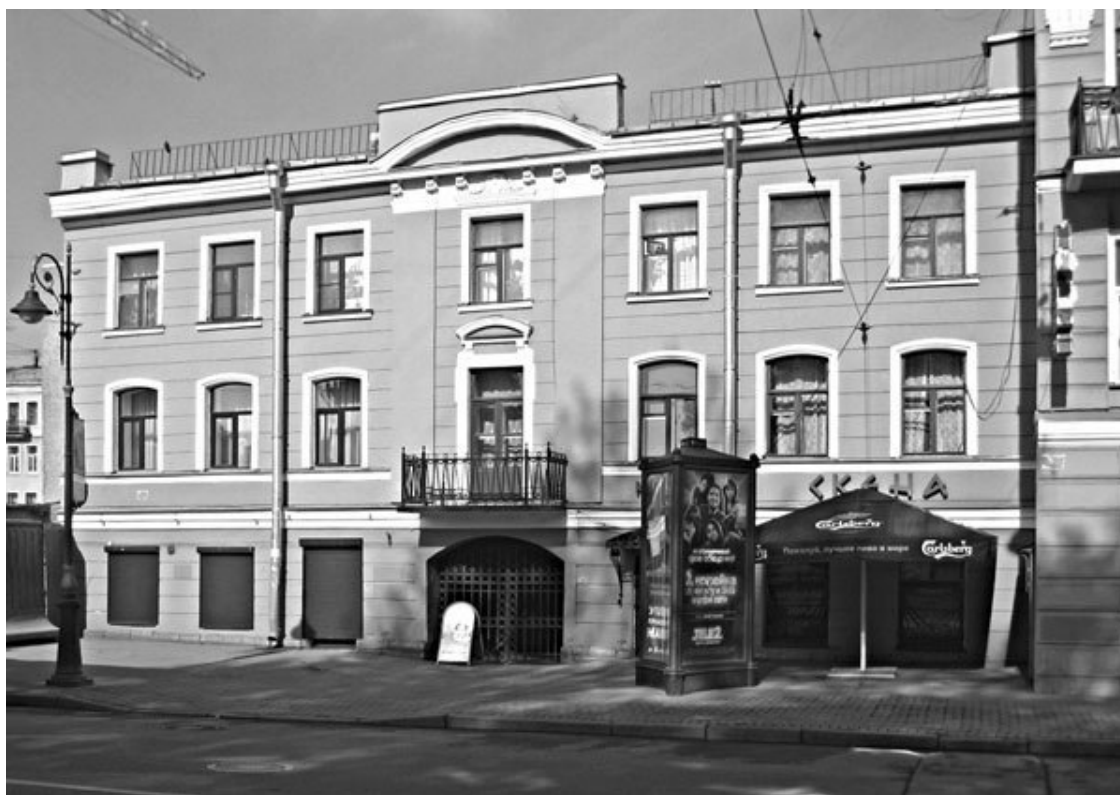
Дом № 11

В 1810—1820-е гг. здесь жил писатель Александр Ефимович Измайлов (1779—1831), баснописец и журналист. Он происходил из дворян Владимирской губернии, воспитание получил в Горном кадетском корпусе, по окончании которого в 1797 г. поступил в Министерство финансов. Всю свою жизнь Измайлов почти безвыездно провел в Санкт-Петербурге и только в 1826 г. отправился в Тверь, куда был назначен вице-губернатором, а в 1828 г. – в Архангельск на ту же должность. Не пробыв там и года, Измайлов перевелся в Санкт-Петербург, став чиновником особых поручений при Министерстве финансов, а в 1830 г. вышел в отставку.