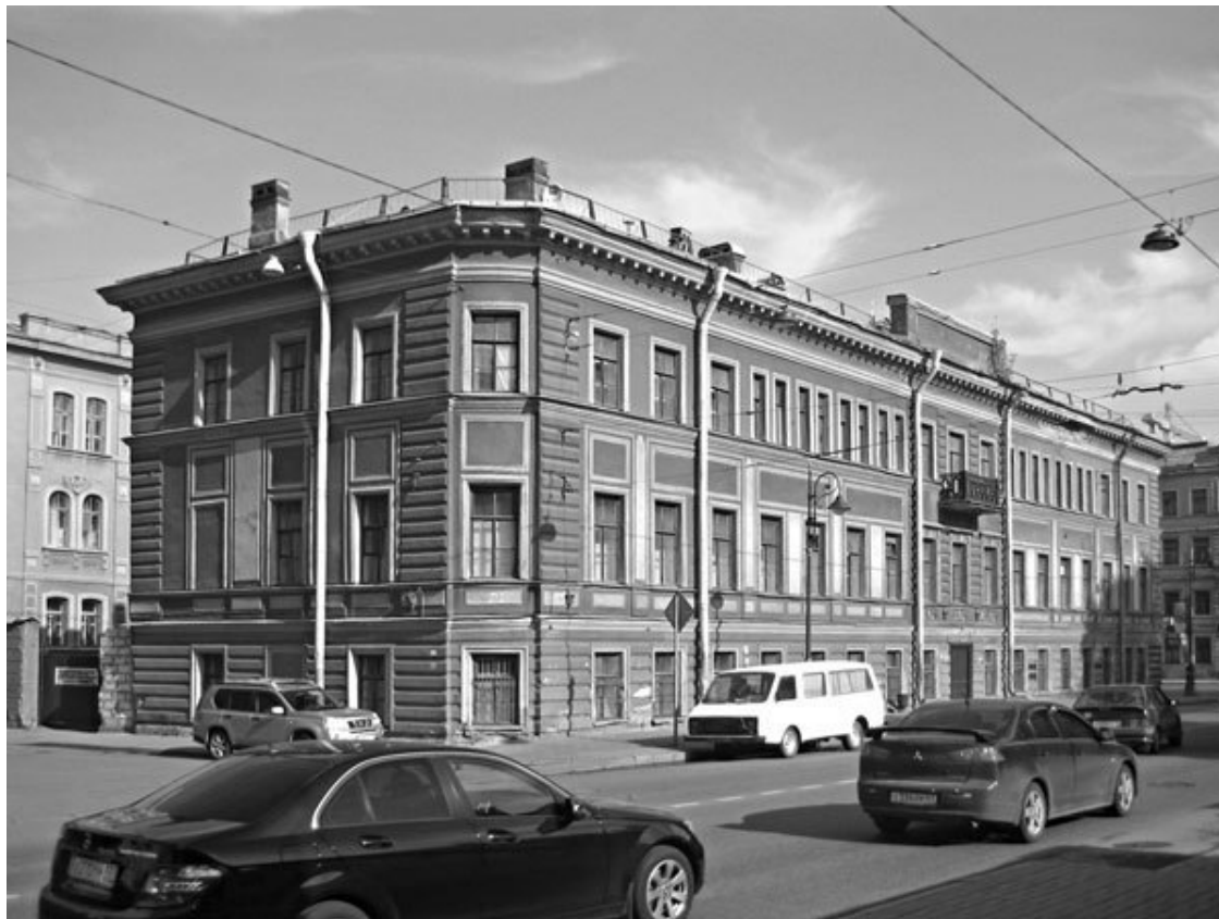
Дом № 1

В середине XIX в. участок принадлежал Артиллерийскому департаменту, и в Атласе Цылова на нем показан каменный дом, приобретенный в 1876 г. статским советником Ф.Ф. Бычковым для размещения частной гимназии и реального училища (с 1883 г. – гимназия и реальное училище Я.Г. Гуревича). По оценке архитектора Э.Г. Юргенса домовладение состояло из каменного трехэтажного Т-образного в плане дома и трехэтажного дворового флигеля и занимало 341 кв. сажень земли. Общая стоимость домовладения на конец 1876 г. составляла 88,4 тыс. руб. В домах, занятых учебными классами, было устроено газовое освещение, водопровод, ватерклозеты, верхние этажи отапливались калориферами, первые этажи – печами.