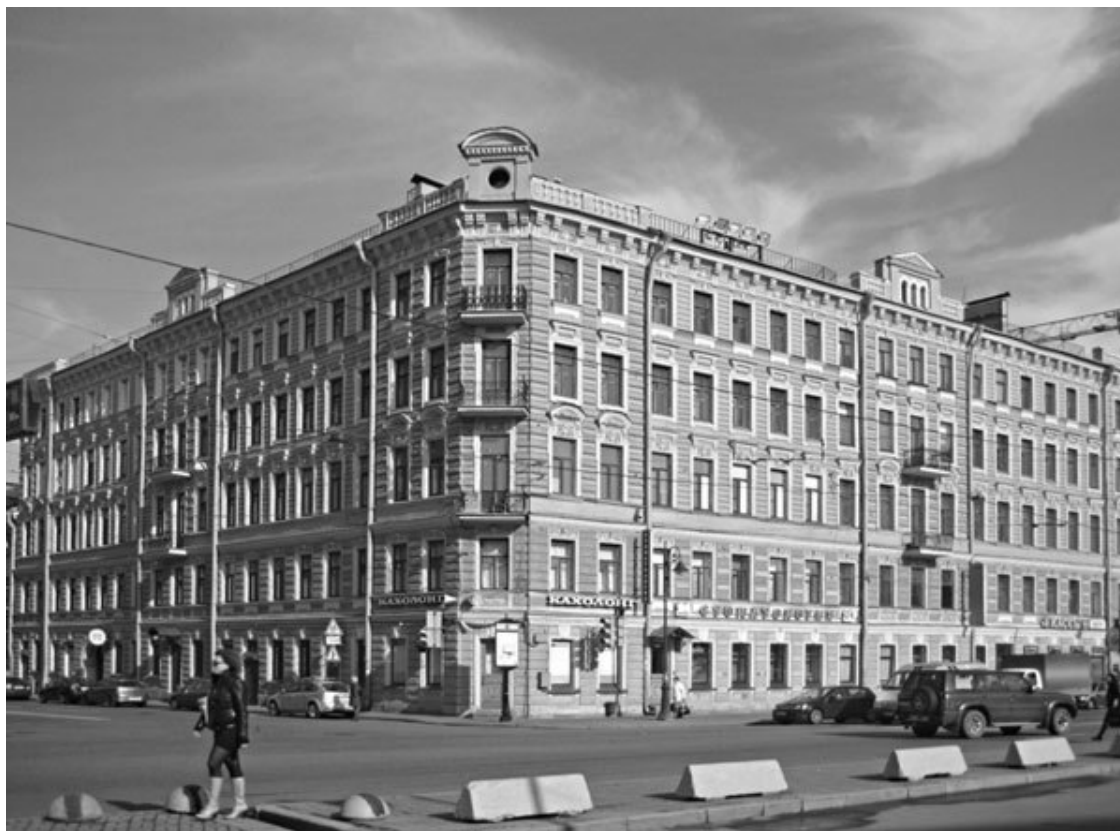
Дом № 19