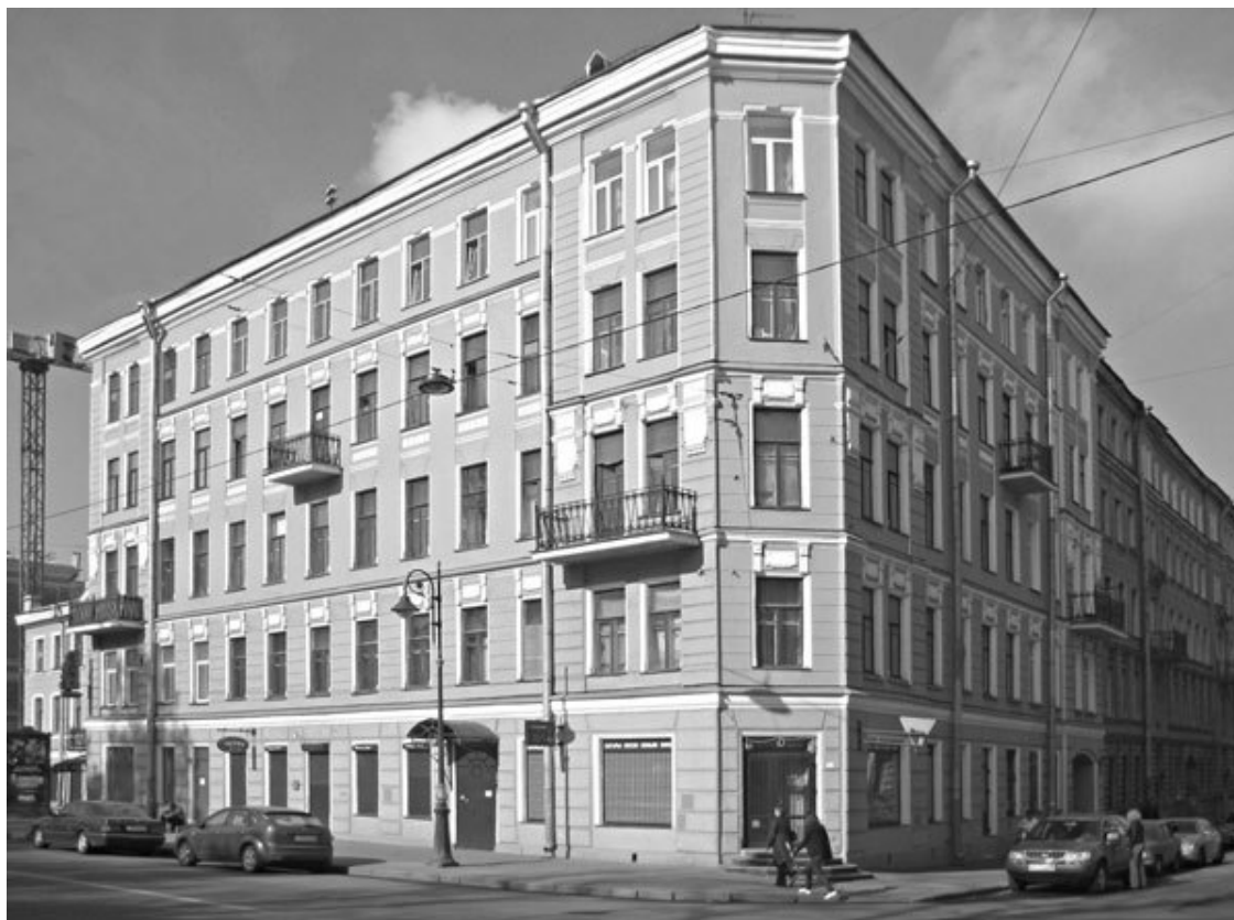
Дом № 9