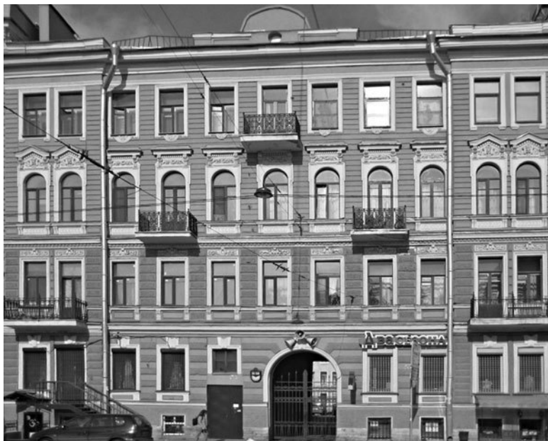
Дом № 17