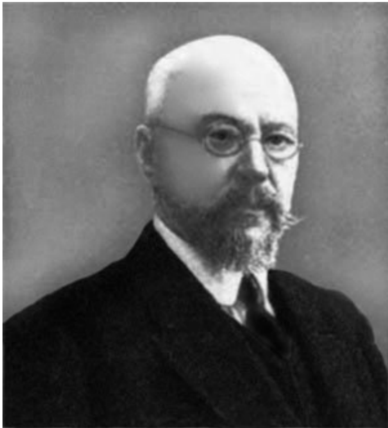
В.К. фон Анреп

В 1898 г. здесь поселился профессор Санкт-Петербургского университета действительный статский советник Александр Иванович Воейков (переехал из дома № 33 по 2-