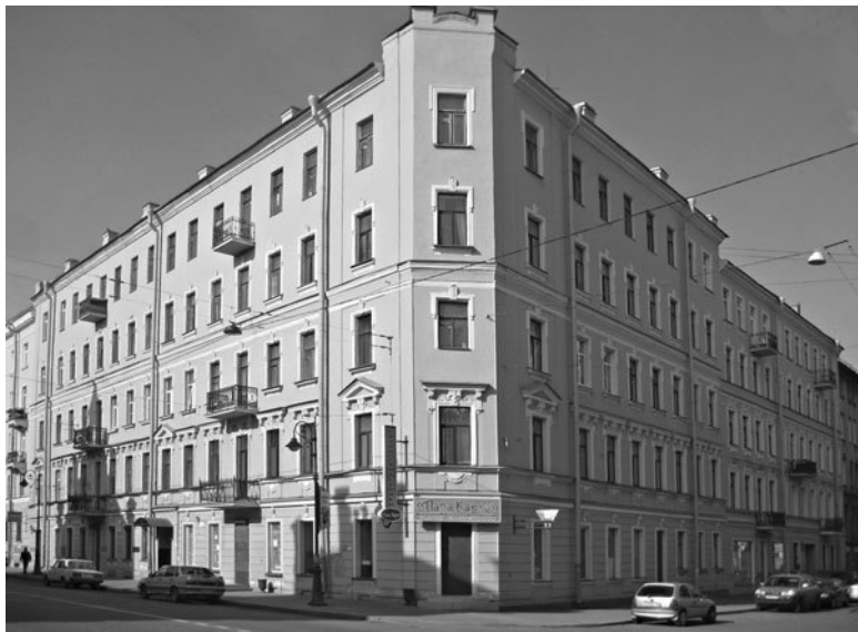
Дом № 3