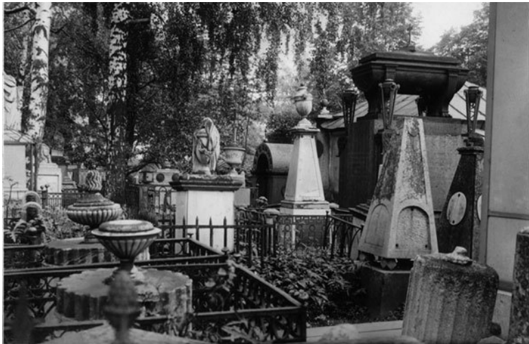
Лазаревское кладбище Александро-Невской лавры