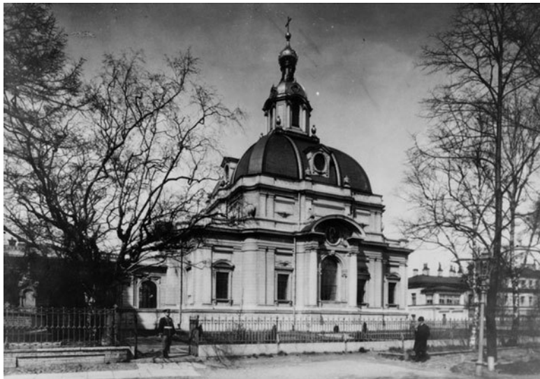
Великокняжеская усыпальница в Петропавловской крепости