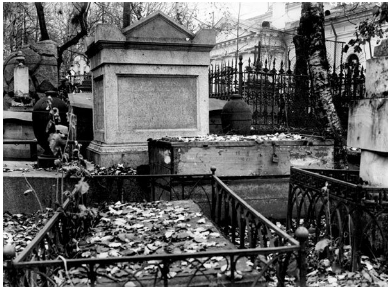
Надгробие А. П. Захарова на Смоленском православном кладбище

Обветшавшая деревянная церковь была в 1772 г. перестроена и освящена во имя Михаила Архангела. На месте старых богаделен в 1786–1788 гг. возвели каменный Смоленский храм, сохранившийся до нашего времени.