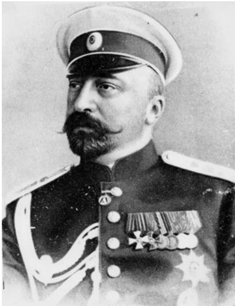
Великий князь Николай Михайлович