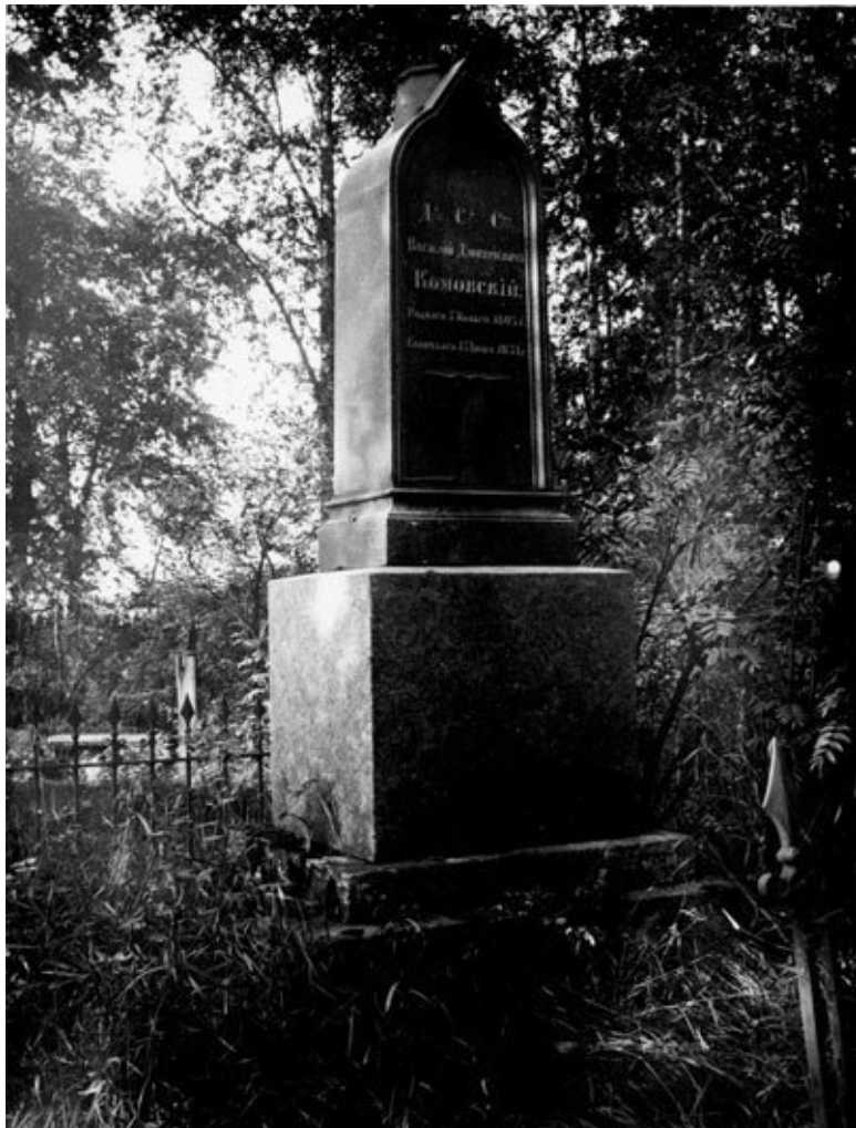
Надгробие Комовского на Митрофаниевском кладбище