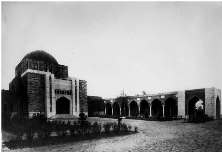
Дом омовения и отпевания на Еврейском кладбище

По мере развития Волковских и Смоленских кладбищ, ставших основными для всего города, были окончательно закрыты старые кладбища при приходских церквях. В 1756 г. вновь поступило распоряжение старые кладбища «засыпать землей и песком и утрамбовать на пол-аршина» 87 . К концу столетия некоторые участки старых кладбищ (Сампсониевского, Вознесенского) продали в частное владение.