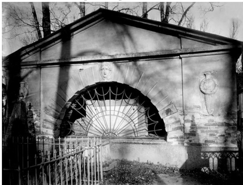
Склеп М. Руска на Волковском лютеранском кладбище

Еще одно отделение Волковского кладбища образовалось в 1799 г., когда часть старообрядческого кладбища перешла к единоверцам , которых активно поддерживал Павел I. Две церкви действовали на единоверческом отделении, федосеевский храм с богадельней – на старообрядческом. Наконец, в 1802 г. лютеранская община выделила небольшой участок земли для устройства еврейского кладбища. Таким образом, Волковское кладбище превратилось в огромный массив, включавший некрополи разных исповеданий.