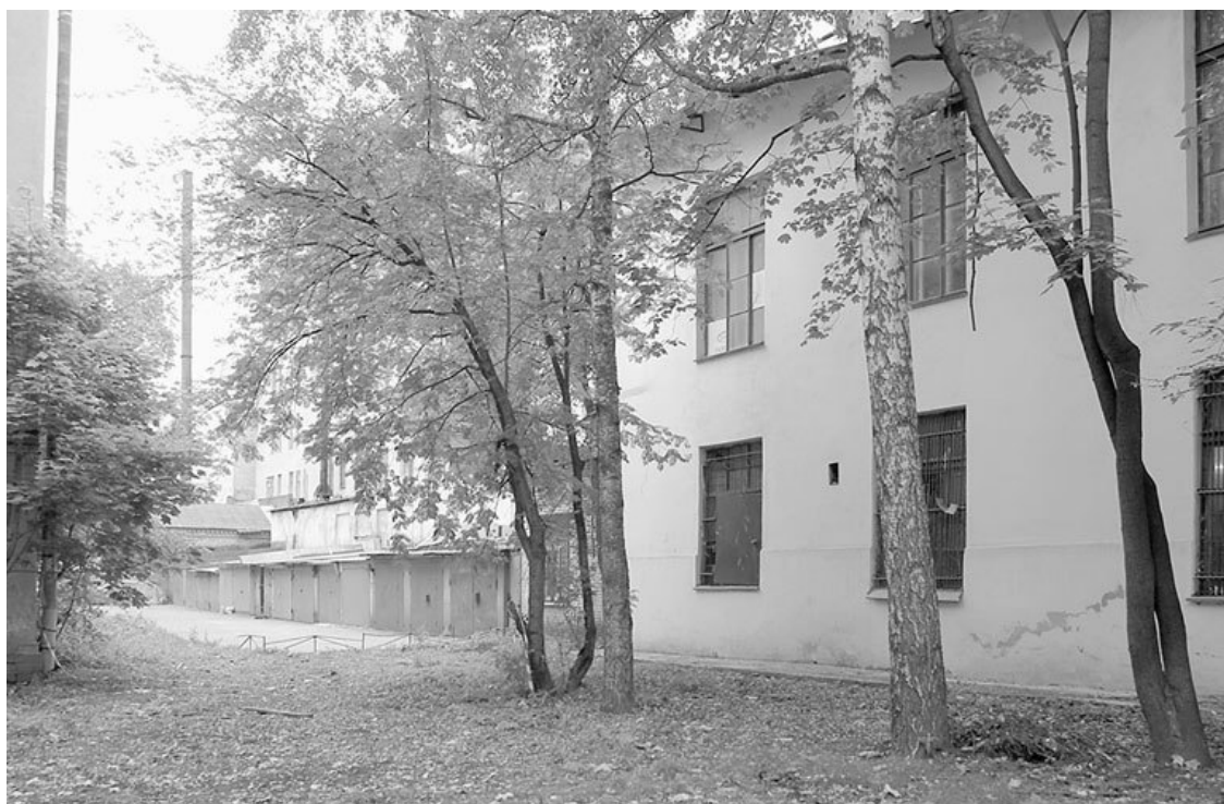
Пустырь, откуда произошел «старт на Марс», ныне застроен корпусами завода. Фото 2011 года

Впоследствии «пустопорожнее место» заняли дома № 3 и № 5 по Офицерскому переулку. Частично его застроил в 1930-1950-е годы завод. Основанный в 1925 году и известный ныне под именем «Навигатор», он располагает своими офисными зданиями по Малому пр., 4. В советские времена это был просто п/я (почтовый ящик. – С. П.) № 629. Существовали такие закрытые предприятия, проходные которых утром поглощали уйму народу, а вечером выплескивали обратно, но какие-либо вывески на фасадах зданий отсутствовали. Вроде есть предприятие, а вроде и нет, захочешь устроиться со стороны, но не найдешь отдела кадров... Правда, окрестные жители знали, что завод выпускает радиотехническую аппаратуру космического назначения, однако секретность предприятия от этого не убавлялась. Даже подготовленную к отгрузке продукцию вывозили с завода исключительно ночью, отчего жителям прилегающих кварталов приходилось спать при шуме мощных грузовиков. Мама очень жаловалась на этот ночной шум.