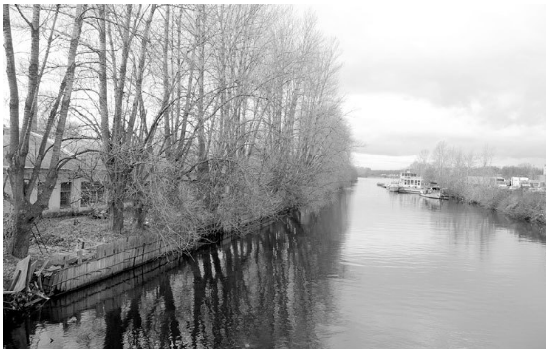
Устье Ждановки. Фото 2011 года

Именно при возведении нового моста попутно засыпали Ватный остров, а сам мост несколько поменял свое местоположение. Чуть позже заменили и три деревянных моста, ведущих к Петровскому острову: Ждановский, Красного курсанта (ныне – Кадетский) и Мало-Петровский. Тогда же занялись обустройством и Петровского острова. Ликвидировали многочисленные деревянные постройки и привели в порядок парк; одели в гранит Ждановку, и рыбаки почти исчезли; а когда на правом ее берегу высадили дубы, обрывистые берега этой «забытой» речки приобрели весьма ухоженный вид.