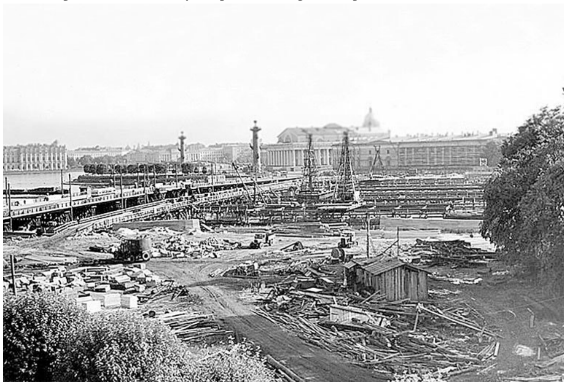
Строящийся мост Строителей (Биржевой). Фото 1958 года

Но особенно тяжело приходилось Биржевому мосту, называвшемуся в то время мостом Строителей. В 1957 году мост сильно пострадал от весеннего ледохода, а еще раньше, в ноябре 1956 года, произошел навал около 30 судов, ожидающих ночного прохода на опоры этого моста. После этого происшествия мосту потребовался срочный ремонт.