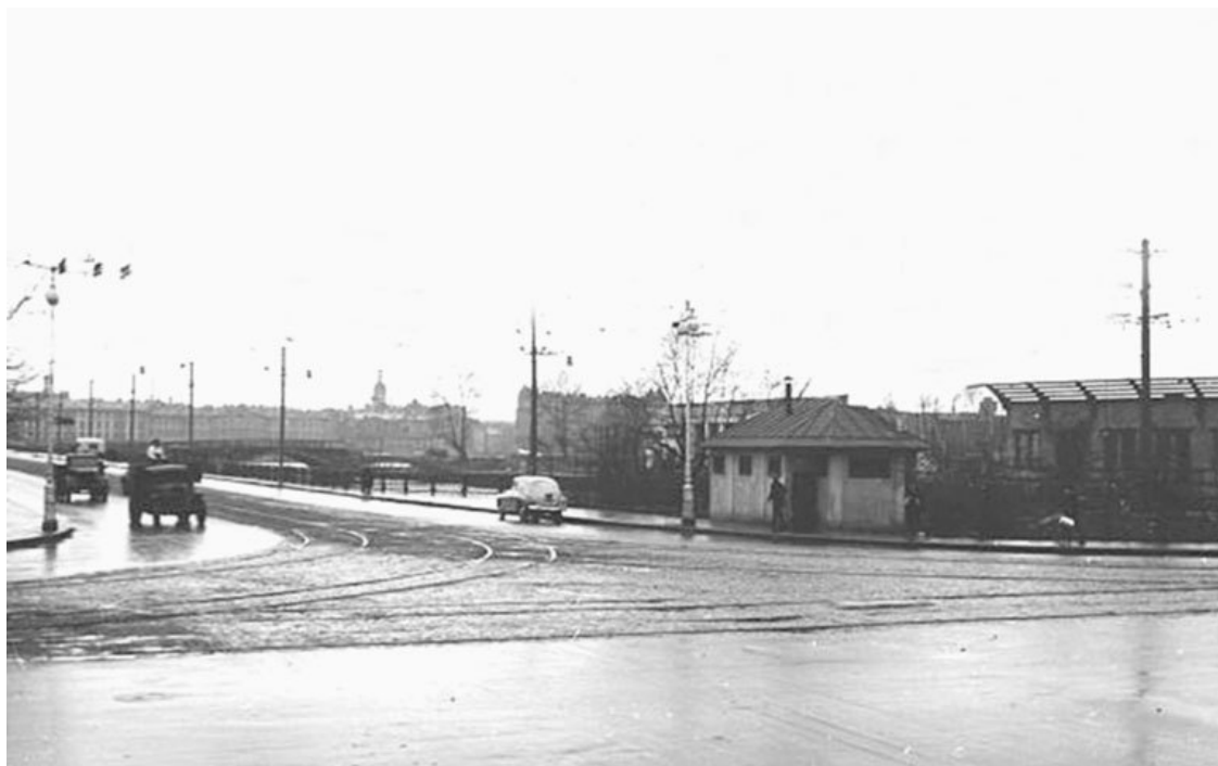
Тучков мост. Фото 1955 года

с прогнившими досками и покосившимися опорами, вечные склады бревен и досок возле них, ну а рядом парники и оранжереи городского питомника. Запах дерева и цветов, но никак не выхлопных газов!