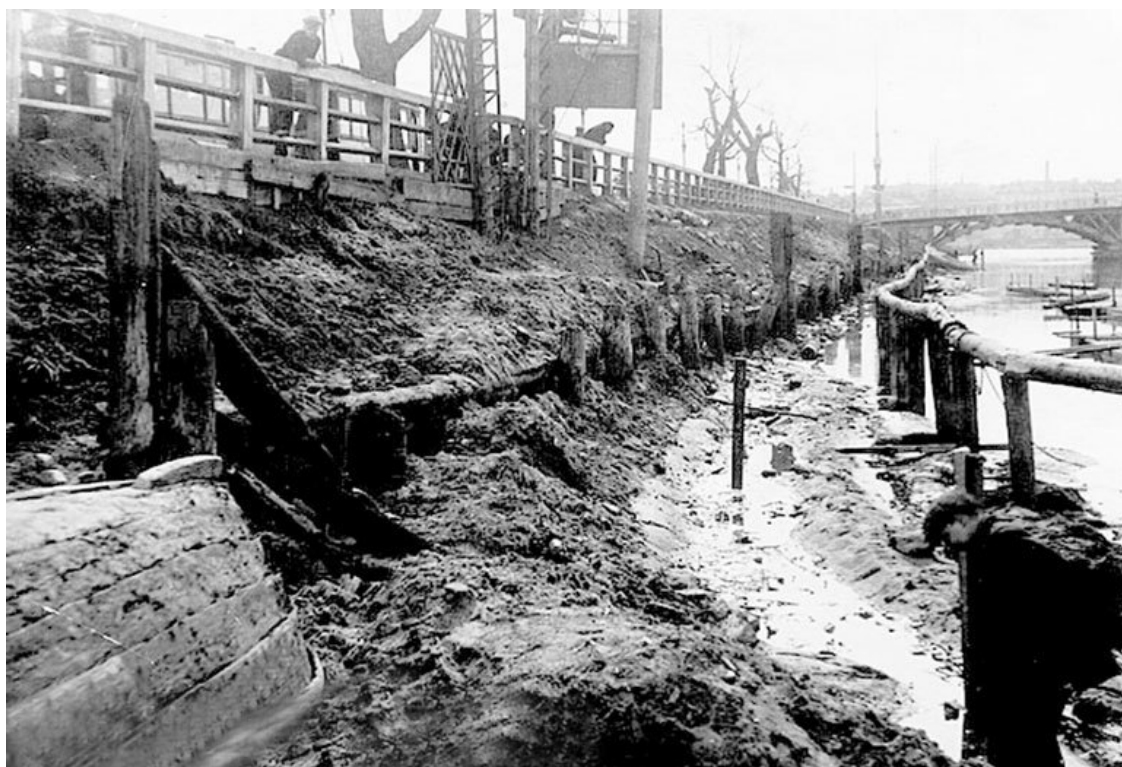
Ждановская набережная в 1934 году