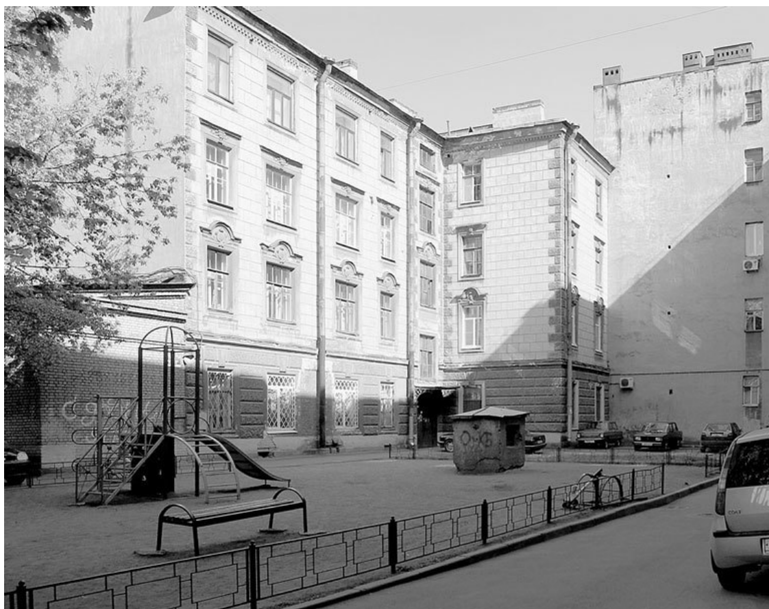
Дом 11, во дворе. Фото 2011 года

Заросшие берега реки Ждановки, Петровский остров, где на месте еще не построенного стадиона паслись козы; дома за глухими заборами, окруженные обширными пустырями, – все это не очень вязалось с окружающей действительностью, ибо ни дощатых заборов, ни пустырей почти не осталось. Разве только на Петровском острове, тогда еще не обустроенном, да в устье Ждановки – у завода «Вулкан».