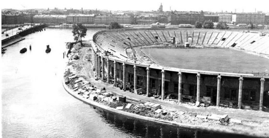
Строящийся новый стадион им. В.И. Ленина. Фото 1950-х годов

Доступ на территорию стадиона им В.И. Ленина, как я уже отмечал, был открыт постоянно, поэтому территория стадиона считалась как бы продолжением Петровского парка. По выходным играла музыка, продавалось мороженое, возле Ждановского моста стояла бочка с квасом, из нее за 3 и 6 копеек (маленькая и большая кружка) наливали настоящего хлебного кваса. Зимой непременно заливался каток, по выходным там всегда был аншлаги; впрочем, отдыхали тогда только один день – в воскресенье.