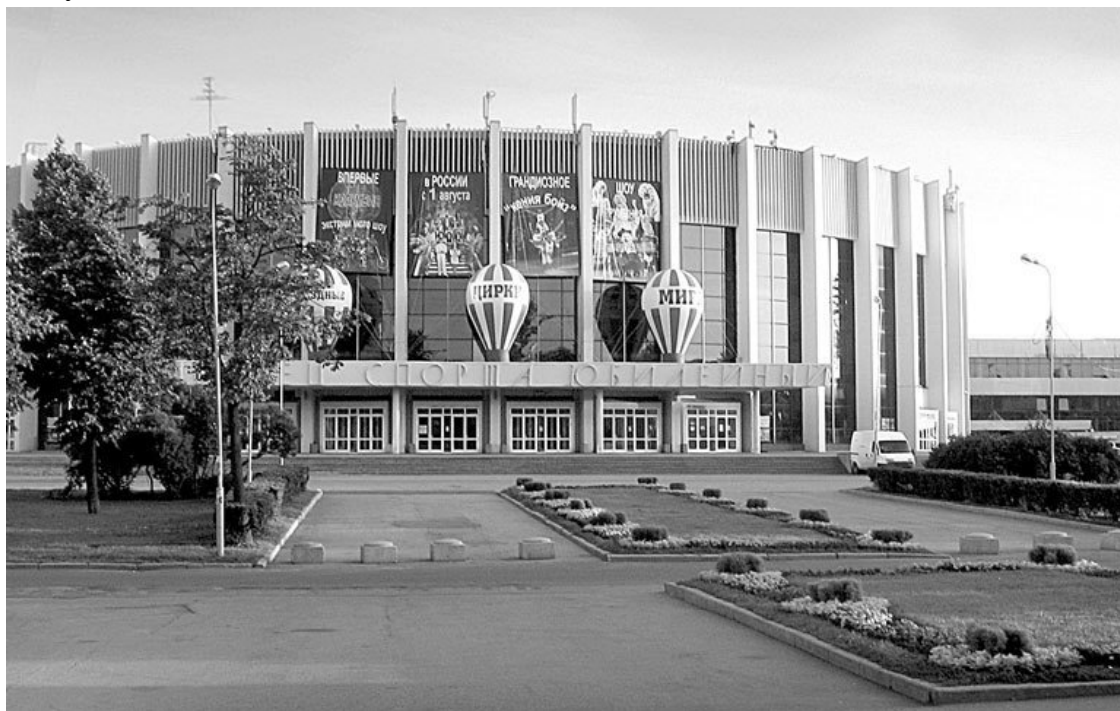
Дворец спорта «Юбилейный». Фото 2011 года

Конечно, он так ответил из мальчишеского бахвальства, но, думаю, спроси его об этом сейчас, он ответил бы то же самое, но уже совершенно искренне.