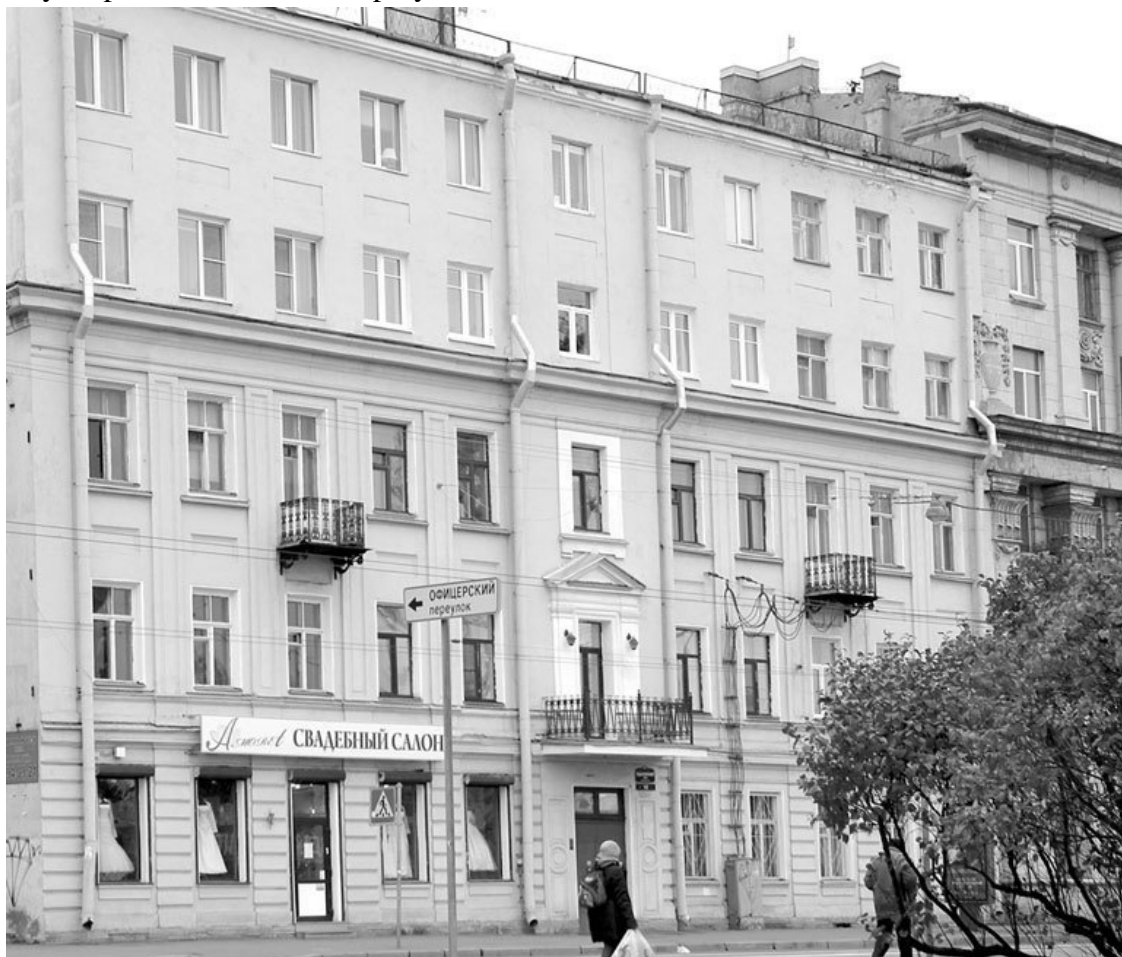
Дом датского подданного Х. Крейзера по Ждановской ул., 1, в XIX веке имел всего 3 этажа. Фото 2011 года

Если кто-то, прочитав строки «Аэлиты», заглянет ныне во двор дома № 11, едва ли он найдет много примет былого. Нет, формально двор выглядит почти также – за исключением одного здания все остальные старой постройки, однако нет существенных «мелочей»: двух деревянных домов по углам Офицерского переулка, пристроек, сараев с поленищами дров. Нет и пустыря, начинавшегося сразу за домом № 11/1.