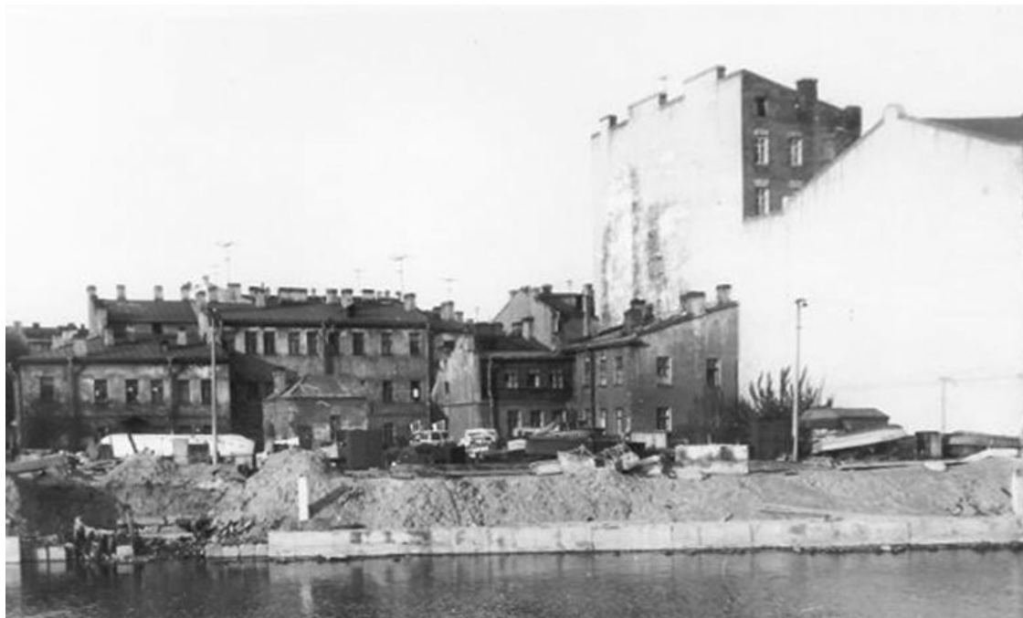
Строительство гранитной набережной. Фото 1950-х годов

Параллельно отстраивались рядом расположенные «большие» мосты: Строителей (так тогда назывался Биржевой мост) и Тучков. В 1961 году сдали мост Строителей, а в 1965 – Тучков мост.