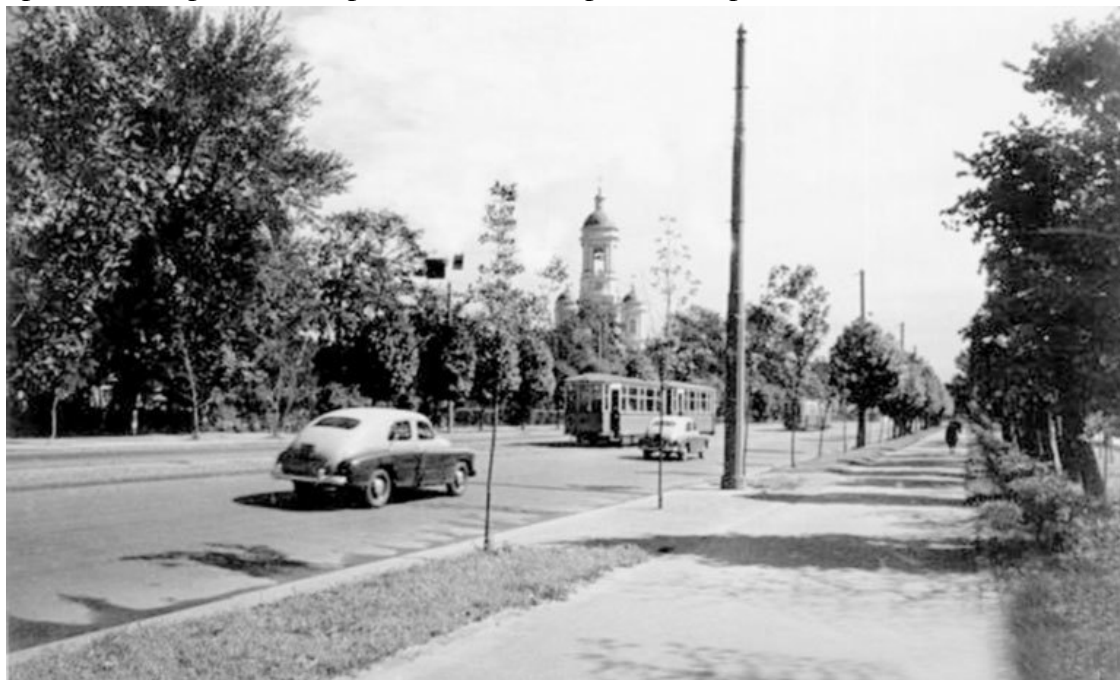
Проспект Добролюбова. Справа городские питомники. Фото 1950-х годов