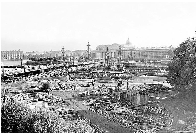
Строящийся мост Строителей (Биржевой). Фото 1958 года

Из-за ежегодного натиска ледовой стихии мосты были недолговечны, часто ремонтировались, возле них всегда пахло свежей древесиной – она шла на латание пробоин. Можно сказать, за мостами ухаживали почти как за живыми, и никогда нельзя было заранее сказать, выдержит ли данный конкретный мост очередную ледовую атаку или нет.