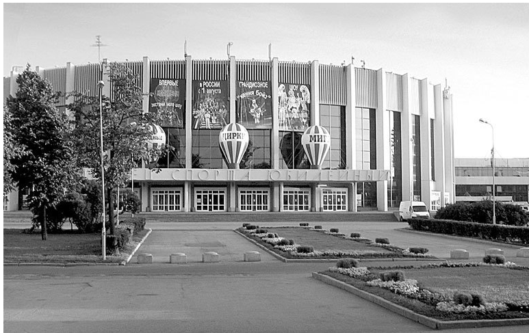
Дворец спорта «Юбилейный». Фото 2011 года

Конечно, он так ответил из мальчишеского бахвальства, но, думаю, спроси его об этом сейчас, он ответил бы то же самое, но уже совершенно искренне.