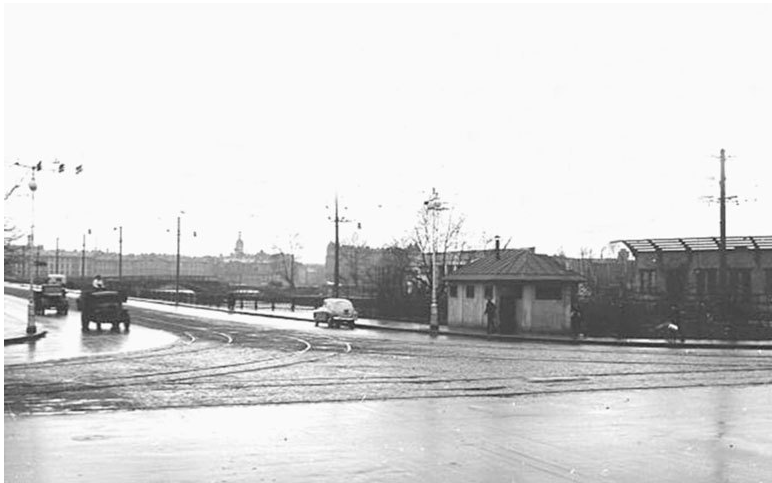
Тучков мост. Фото 1955 года

берегу Малой Невы – бывший склад пеньки, созданный архитектором А. Ринальди и более похожий на дворец, и тут же старомодные мосты с прогнившими досками и покосившимися опорами, вечные склады бревен и досок возле них, ну а рядом парники и оранжереи городского питомника. Запах дерева и цветов, но никак не выхлопных газов!