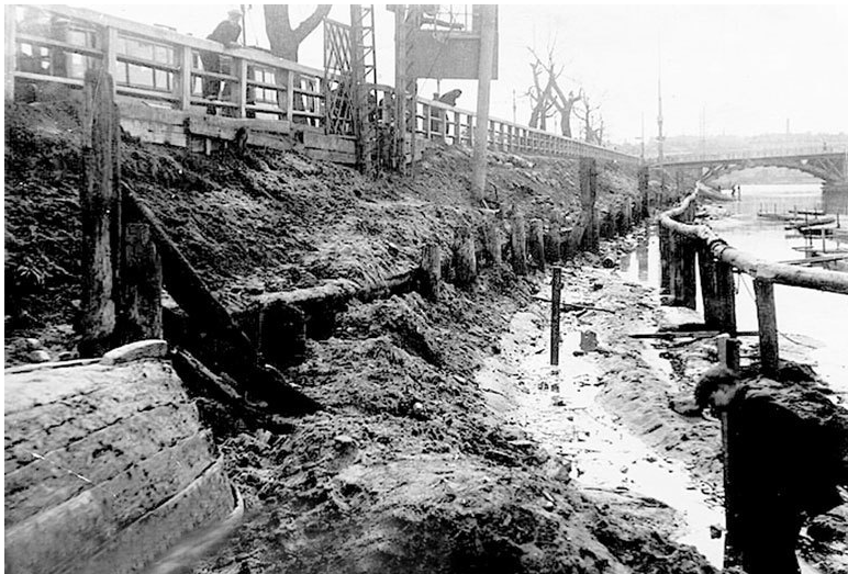
Ждановская набережная в 1934 году