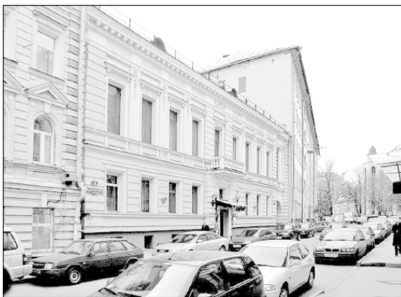
Дегтярный переулоч, дом № 6

В 1820-х гг. на территории усадьбы некий Лехнер снимал помещение для своего пансиона, и у него поселился великий польский поэт Адам Мицкевич, высланный русским правительством из своей родной страны. Он приехал в Москву 24 декабря 1825 г. и поселился в этом пансионе, в котором жили и «имели общий стол, комнату и услуги» его польские друзья.