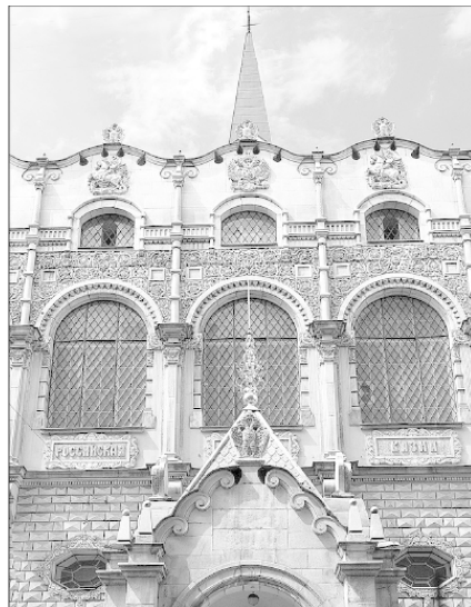
Здание Российской ссудной казны. Архитектор В.А. Покровский. 1913–1916 гг.

лучший перспективный вид» на него. Внутри находился обширный двухсветный аукционный зал, к которому примыкало здание кладовых с обходной галереей для охраны. Ссудная казна выдавала деньги под заклад золота, серебра, платины и драгоценных камней, а также других ценных вещей, кроме процентных бумаг, одежды и «обыкновенной мебели».