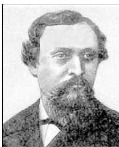
Дмитрий Иванович Иловайский

За перекрестком с Воротниковским переулком в несохранившемся доме (№ 12) в 1893–1896 гг. жил художник В.А. Серов, в начале 1890-х гг. историк В.К. Трутовский, автор интересной статьи о происхождении названия «Арбат», путеводителей по Оружейной палате и по «Дому бояр Романовых» и многих трудов по нумизматике, геральдике, истории.