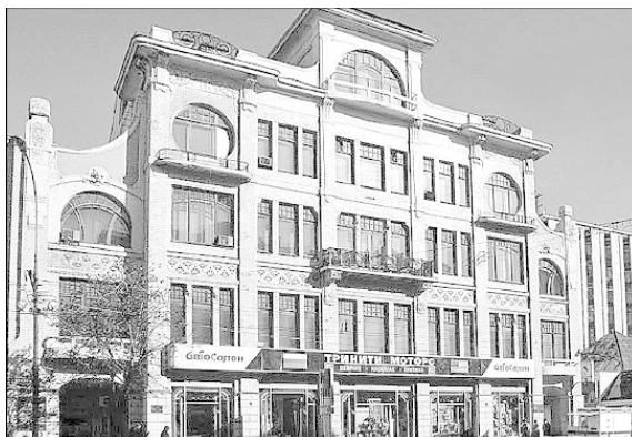
Дом Сытина, Тверская улица, дом № 18