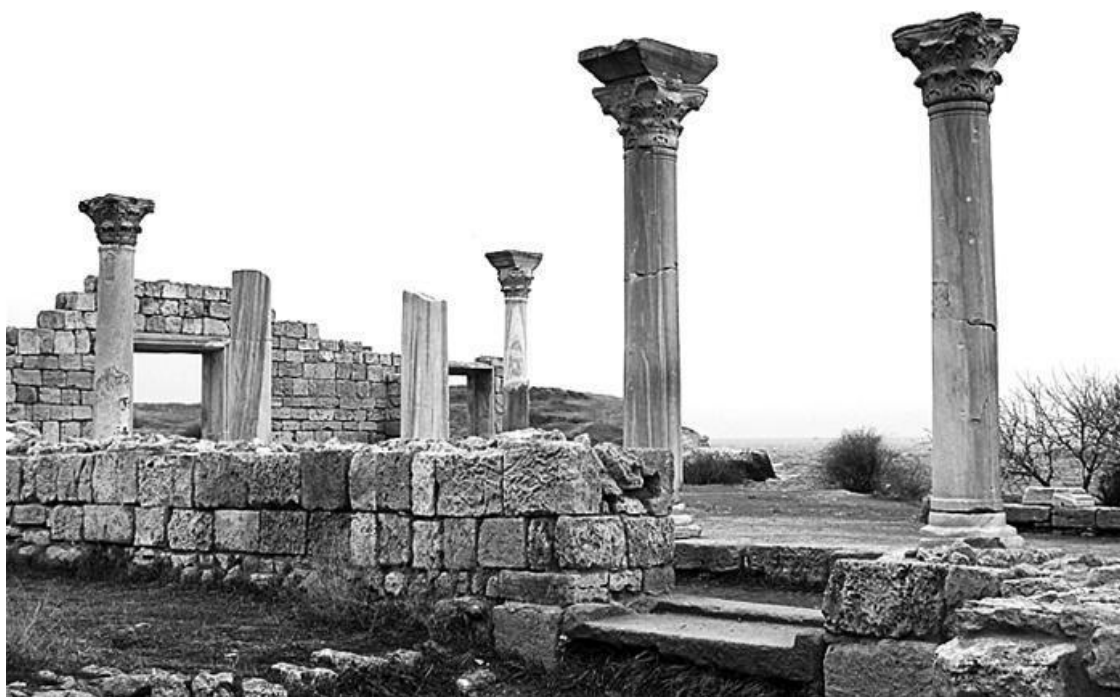
Руины древнего города Херсонеса Таврического в Севастополе

Богатая история полуострова живет в памятниках, сохранившихся до наших дней. Будете в Крыму – обязательно посетите историко-археологический заповедник Херсонес – это едва ли не самая известная в мире крымская достопримечательность. Руины древнего городища находятся на территории современного Севастополя. Если посмотреть на остатки усадеб зажиточных горожан и оценить размеры и качество построек, выводы напрашиваются сами собой: город процветал. Он даже сейчас поражает своим размахом и великолепием и привлекает массу туристов, желающих прикоснуться к древности.