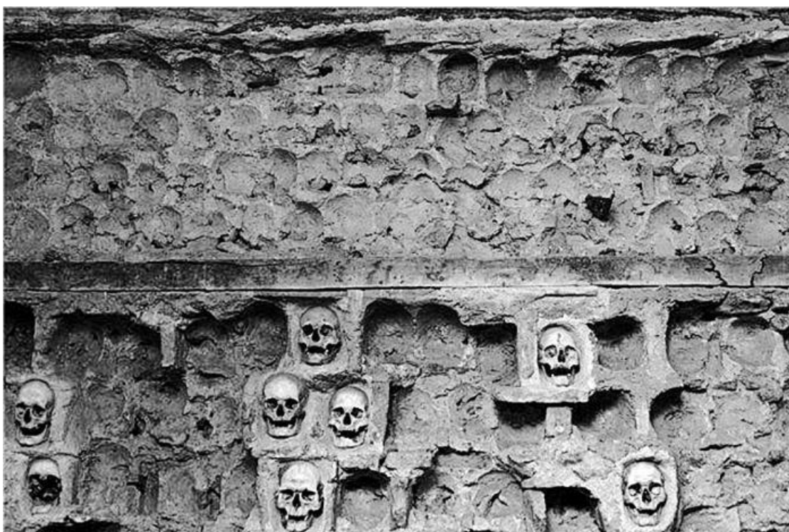
Стена башни Челе-Кула

Это кажется невероятным совпадением, но причина, по которой в 1853 году началась Крымская война, была точно такой же, по которой сегодня США и Евросоюз хотят предъявить санкции России. Вся Европа ополчилась на Российскую империю за попытки освободить Молдавию, Валахию, Болгарию, где ущемлялись права христианского населения, и Сербию, где турки устроили настоящий геноцид. В цивилизованном XIX веке творились страшные вещи. Так, в нескольких километрах от сербского города Ниш есть памятник Челе-Кула, в переводе «Башня из черепов»: после одного из сербских восстаний по приказу паши турки замуровали в скалу несколько тысяч черепов убитых сербов.