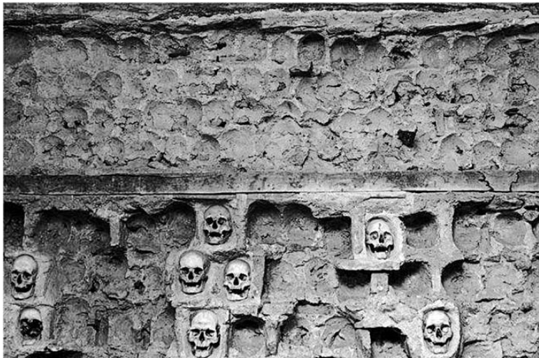
Стена башни Челе-Кула

Но российского заступничества за сербский народ Европа не поняла. К примеру, небезызвестный Фридрих Энгельс тогда написал: «Россия хочет захватить Константинополь, чтобы потом двинуться со своими ордами дальше в Европу». А британский статс-секретарь по иностранным делам лорд Кларендон заявил: «Пора начать битву цивилизации против варварства». И битва началась – против России выступили самые мощные европейские державы – Англия и Франция, к ним присоединилась Сардиния, а позже – Австро-Венгрия. Только представьте, почти весь современный Евросоюз!