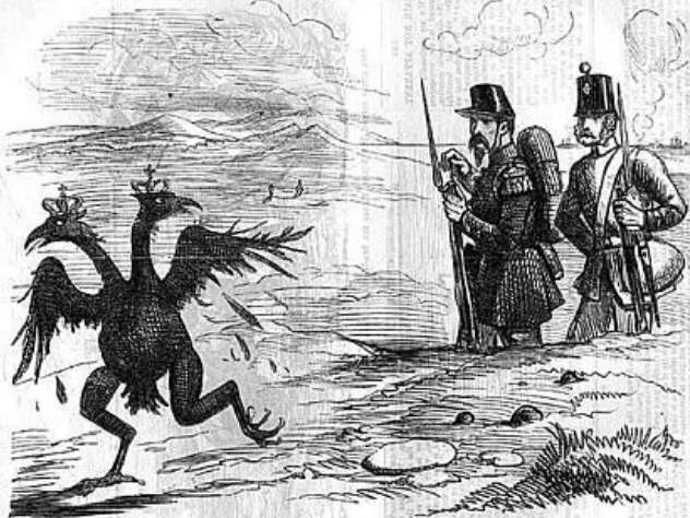
THE SPLIT CROW IN THE CRIMEA.