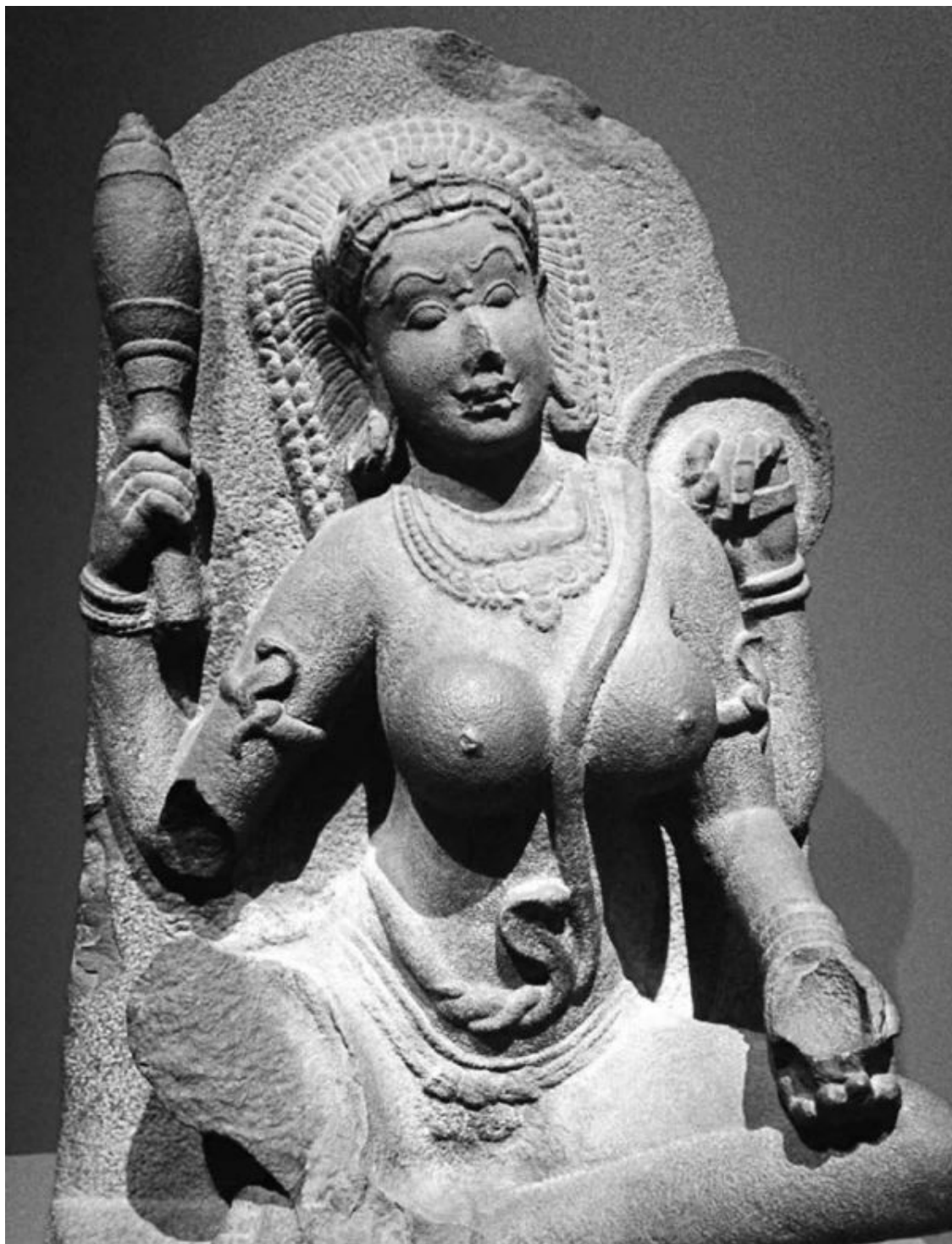
Скульптурное изображение йогини (Тамилнаду, X в.)

Слово dūtī («посланница») применительно к женщинам-тантрикам в БЯТ всегда выступает равнозначной заменой слова «шакти». А в отношении божественного уровня это слово обозначает четырех из восьми богинь, составляющих свиту Капалишабхайравы, главного мужского божества в БЯТ [Hatley 2019: 6].