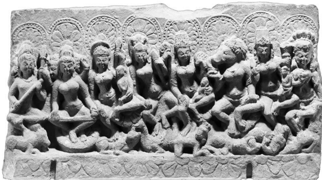
Барельеф X века н. э. Господь Шива (крайний слева) сидит с семьей богинями, известными как матери (Чамунда крайняя справа)

или соседний с ним регион северо-западной Индии [Goudriaan 1981: 40]. Более внимательно к этому вопросу подходит Ш. Хэтли. Он отмечает, что в БЯТ военное и политическое могущество редко называется целью совершения ритуальной практики, а городские центры (Каши и Уджджайни) упоминаются только как важные центры паломничества. Эти обстоятельства, по его мнению, побуждают предположить, что БЯТ возникла в сельской и относительно незлитарной среде [Hatley 2018: 133].