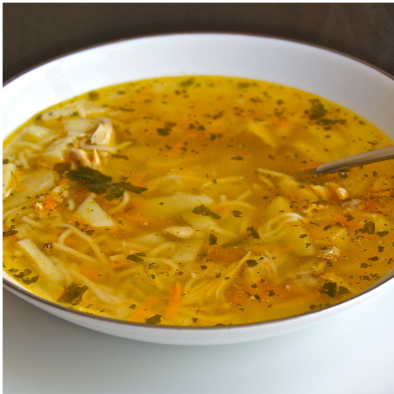
Куриный суп с вермишелью