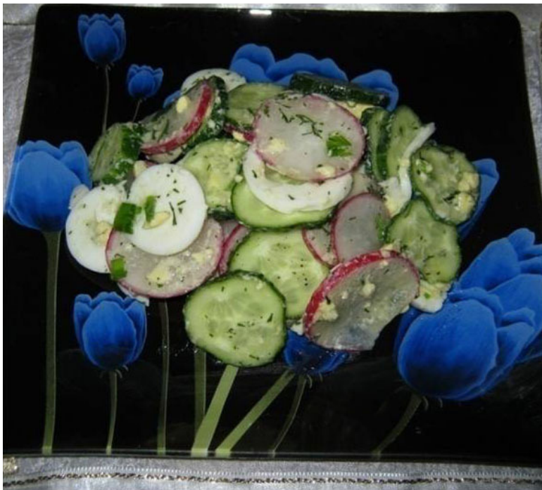
Салат «Весенний» (морской паёк) Рецептура: