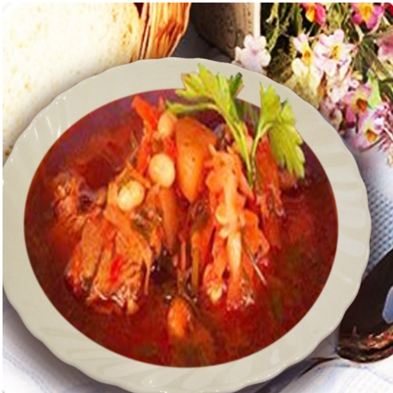
Борщ с фасолью