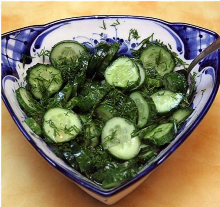
Салат из огурцов (морской паёк)