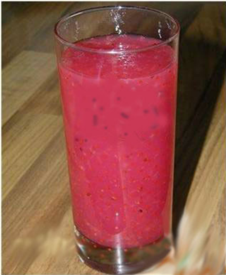
Кисель из красной смородины ( лечебный паёк )