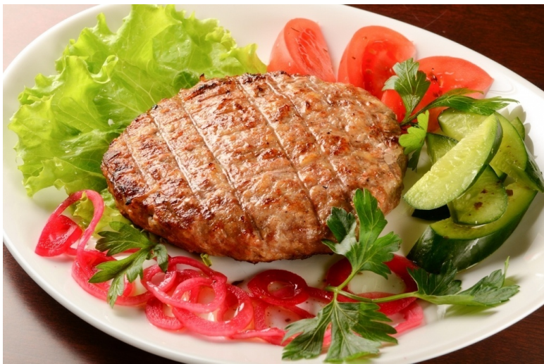
Бифштекс рубленый (лётный паёк)