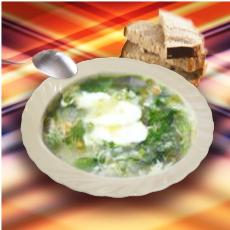
Зелёный суп с щавелем