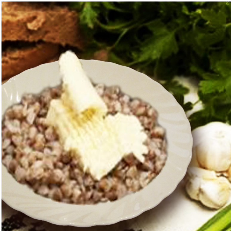
Каша гречневая рассыпчатая с маслом