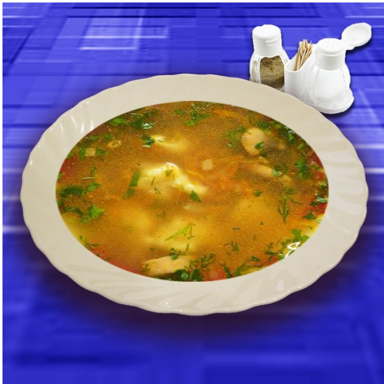
Гречневый суп с картофельными клёцками