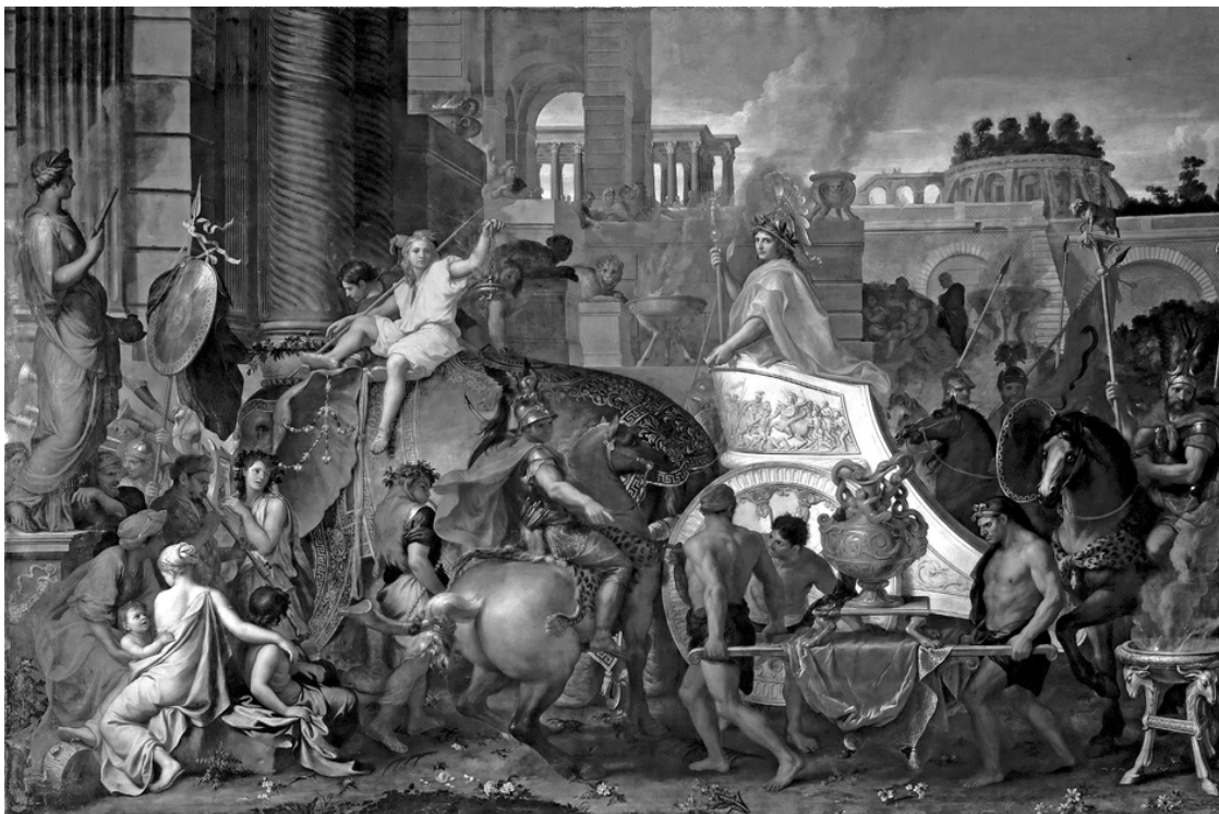
Вступление Александра в Вавилон. Шарль Лебрен, 1664

Древняя Македония до IV века до н. э. была небольшим и слабым царством, страдавшим от вторжений фракийцев и иллирийцев с севера, а также от эллинской (греческой) экспансии с юга.