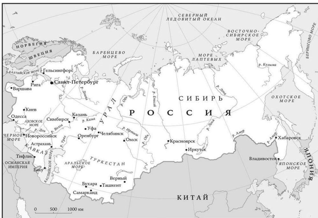
Российская империя 5

хода к предоставлению убежища. Весь «цивилизованный мир» знал о практике политической ссылки в Сибирь и резко осуждал ее, как позже, в период холодной войны, будет осуждать и ГУЛАГ. Несмотря на огромный размер и статус великой державы, шаткое положение царизма стало очевидно в 1905 г., когда Россия понесла унизительное поражение в войне с Японией и еле устояла в ходе революции, которая вспыхнула чуть ли не на всей ее территории: чтобы усмирить волнения, потребовалось больше года. Революция 1905 г. обеспечила российских радикалов героической легендой и стихийно породила новый революционный институт – выборный орган под названием «совет», наделяемый как исполнительной, так и законодательной властью. Она же вознесла к вершинам популярности харизматического лидера Петербургского совета Льва Троцкого, марксиста из фракции меньшевиков. Вождь большевиков Владимир Ленин, который, как и Троцкий, вернулся из эмиграции, к революции 1905 г. опоздал и заметной роли в ней не сыграл.