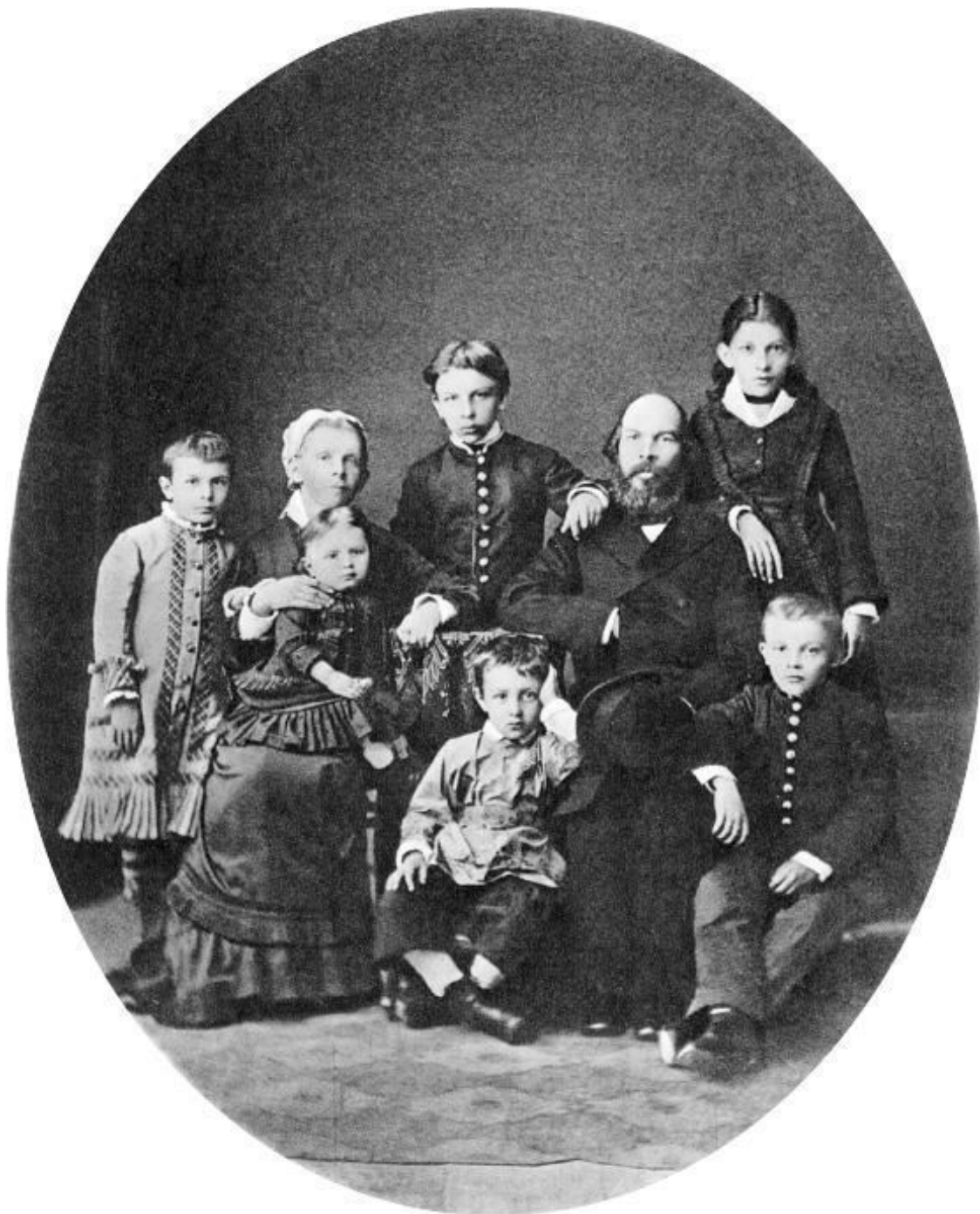
Фотопортрет семьи Ульяновых: Владимир, гимназист, сидит справа впереди; старший брат Александр, который в возрасте 21 года будет казнен как террорист, стоит слева от отца 6

Российские марксисты столкнулись с серьезной проблемой: согласно марксистскому пониманию законов истории, «их» революция – та, которой они посвятили свою жизнь, – пока что не стояла на политической повестке дня; перед ней должна была случиться еще одна. Россия же все еще находилась в самом начале капиталистической фазы развития, и русская буржуазия была слишком слаба и пассивна, чтобы совершить либеральную буржуазную революцию, опрокинув отжившую свое автократию. В результате, в отличие от Британии или Германии, Россия еще «не созрела» для пролетарской социалистической революции.