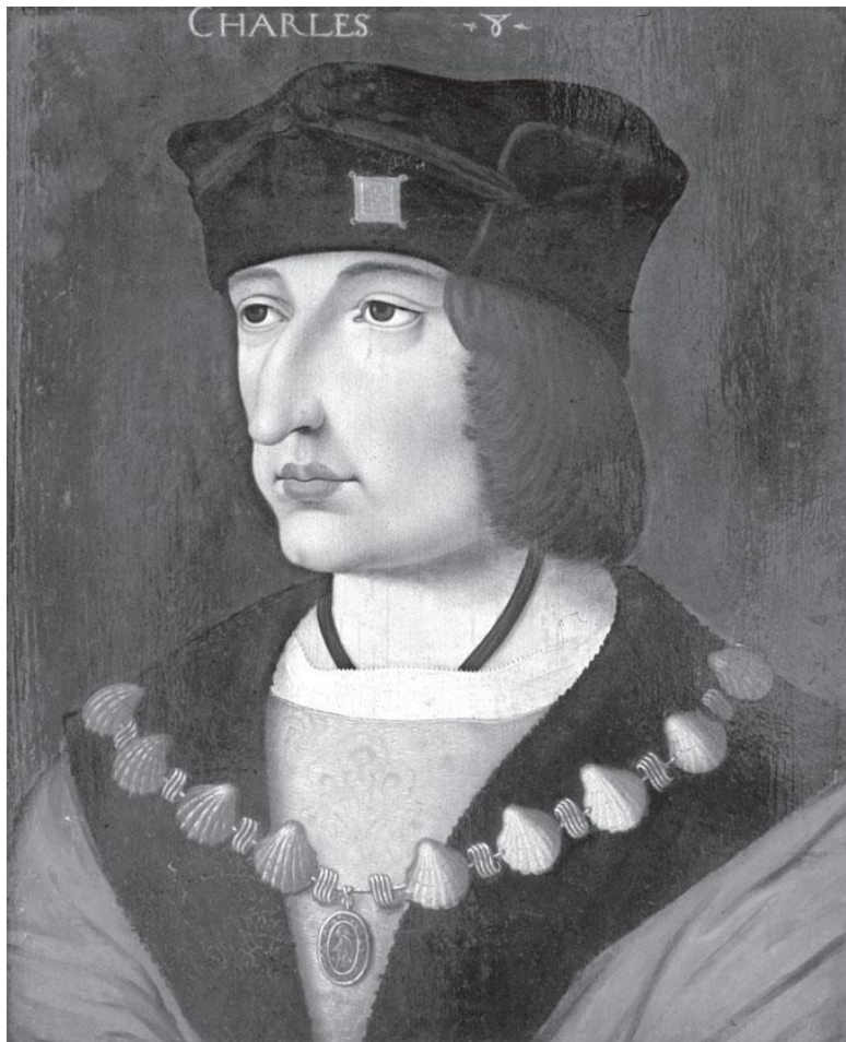
Неизвестный художник. Портрет Карла VIII Французского. Конец XV в. Дерево, масло.