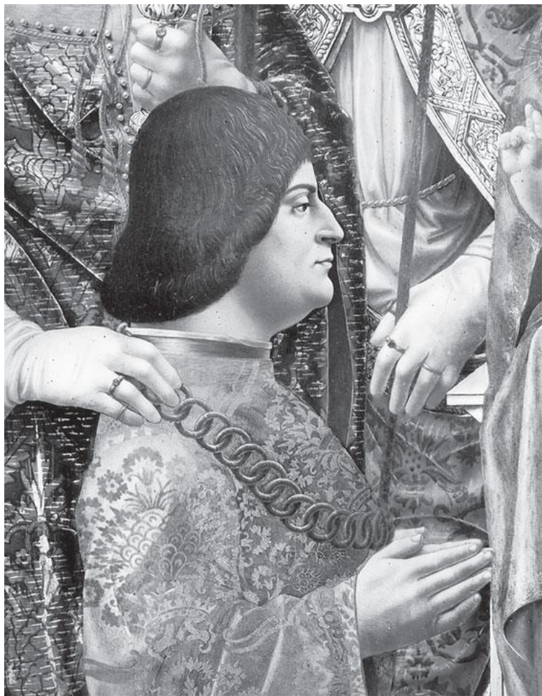
Мастер Пала Сфорцеска (ок. 1490–1520). Алтарь Сфор-