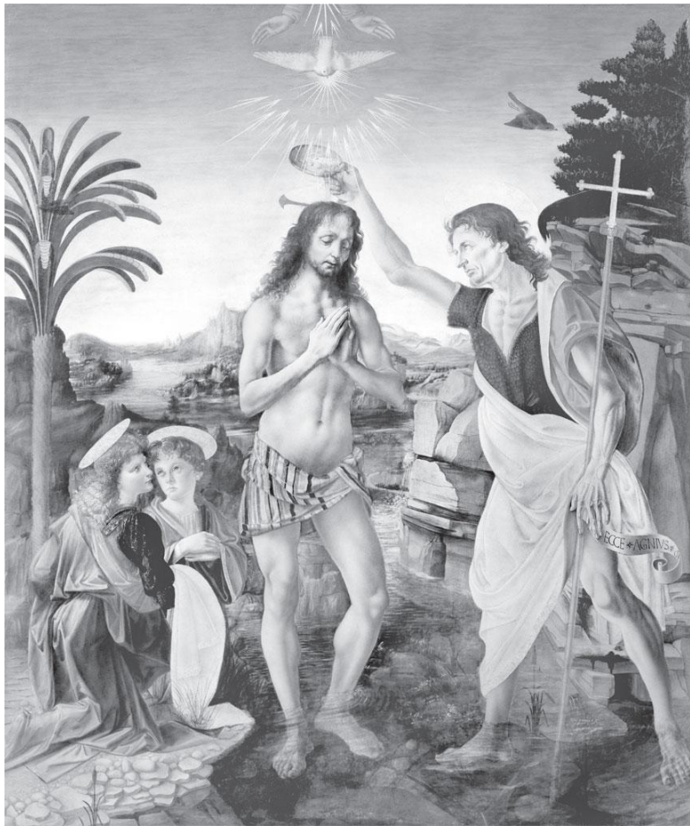
Андреа дель Верроккьо (1435–1488) и Леонардо да Винчи (1452–1519). Крещение Христа. Ок. 1475. Дерево, масло.