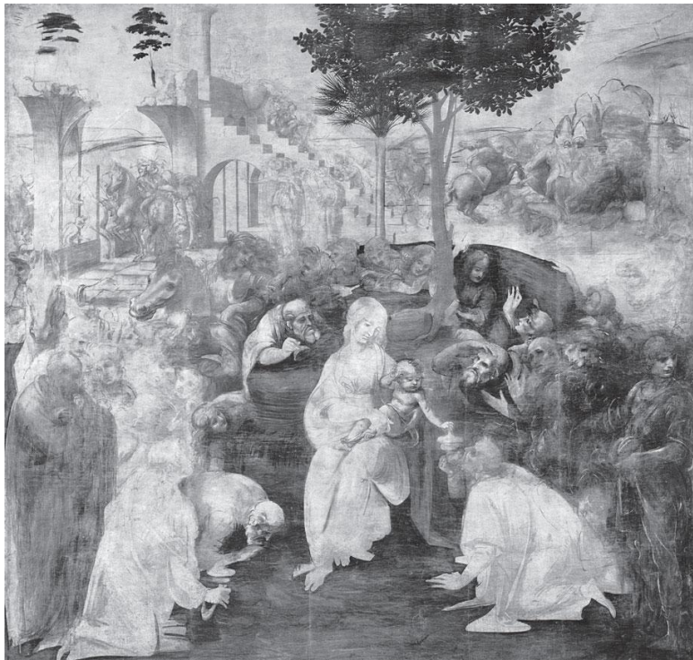
Леонардо да Винчи (1452–1519). Поклонение волхвов. 1481–1482. Дерево, масло.

Итак, во Флоренции перед Леонардо, похоже, забрезжил успех. На подступах к тридцатилетию Леонардо постепенно превращался в ценного мастера, принадлежавшего к почтенной мастерской Верроккьо; талант и связи в высоких кругах обеспечивали ему многочисленные и очень престижные за-