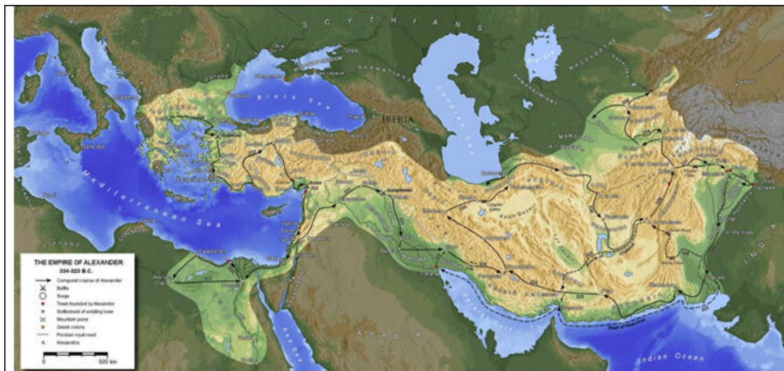
Рисунок 3. Карта современной реконструкции походов Александра Македонского.

кистана в восточном междуречье Амударьи и Сырдарьи ( Рисунок 3 ), которые на карте Эратосфена называются Окс и Яксарт. Почему же за столь длительное время нахождения здесь ученые не обследовали этот район и не внесли хоть какие-то изменения в более ранние представления? Ведь не для прогулки их брал с собой Александр.