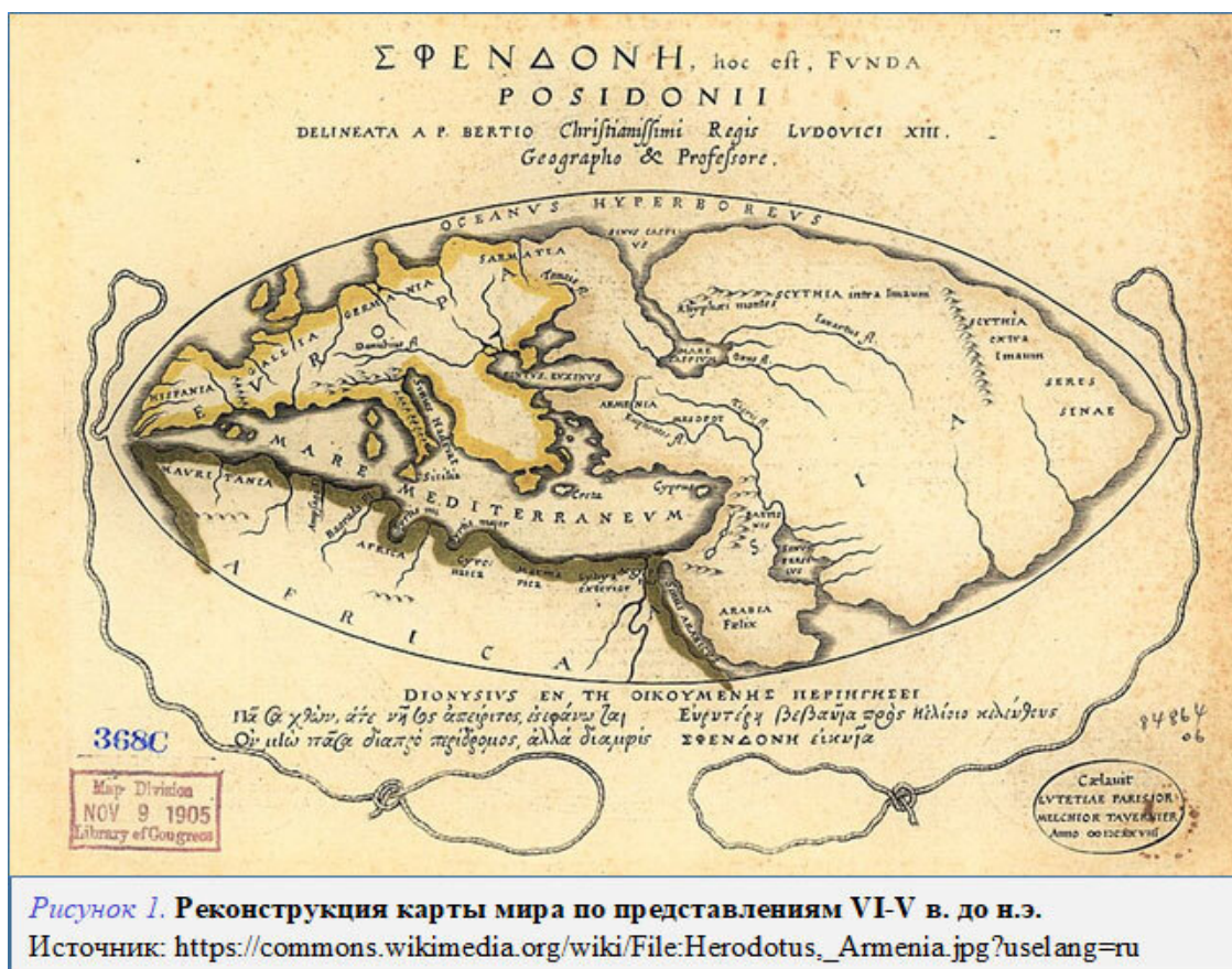
Рисунок 1. Реконструкция карты мира по представлениям VI-V в. до н.э.