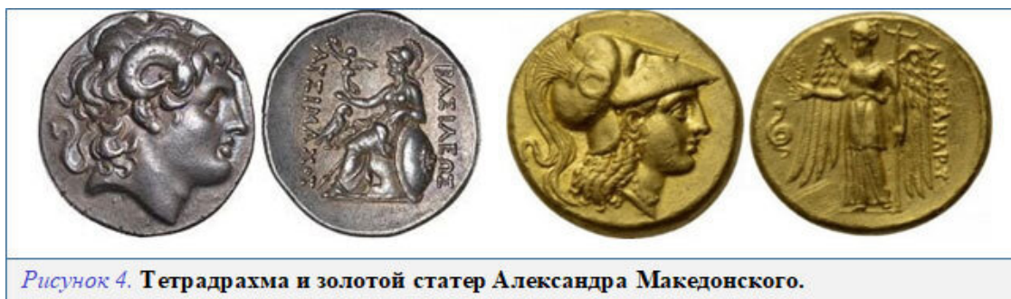
Рисунок 4. Тетрадрахма и золотой статер Александра Македонского.

Помимо медной разменной монеты в ходу были различные варианты серебряных тетрадрахм (вес – 17,13 г, диаметр – 25 мм) и золотых статеров (вес – 8,67 г, диаметр – 16 мм) с изображением профиля Александра Македонского (Рисунок 4.). На серебряной тетрадрахме голова Александра покрыта скальпом Немейского льва или диадемой с рогами бога Аммон-Ра, на золотом статере Александр изображается в коринфском шлеме. На обратной стороне изображения варьируются – различные боги, богини, герои (Геракл, Зевс, Афина, крылатая Ника) и их атрибутов (орел, палица, жезл, щит, головы животных, змея, лавровый венок и т. д.). В этих двух монетах Александр явно захотел отразить свою метаморфозу – от рогатого варвара, каковым его считали греки, до царя Азии, олицетворяющего весь цивилизованный мир.