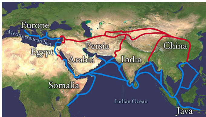
Рисунок 5. Карта древних торговых путей.