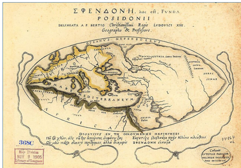
Рисунок 1. Реконструкция карты мира по представлениям VI-V в. до н.э.

свои имена от слов, обозначающих восход/восток (древ. – асу) и заход/запад (древ. – эребу), сохраняя преемственность с религиозно-мифической картиной древнего мира, нашли отражение на этой карте и навсегда закрепились в картографии.