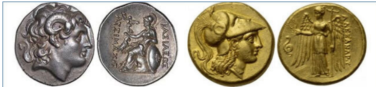
Рисунок 4. Тетрадрахма и золотой статер Александра Македонского.

Денежные знаки Александра Македонского оказали влияние на чеканку и хождение монет на трех континентах – от Индии до западной Европы, от Причерноморья до Египта. Если в начале его правления деньги использовались преимущественно лишь для оплаты содержания военных и взимания дани и налогов, то к началу нашей эры небывалый размах приобрела оптовая торговля. Торговые пути растянулись от Атлантического океана до Тихого, от Европы до Китая ( Рисунок 5 ). По Великому шелковому пути в Средиземноморье потянулись караваны с китайским шелком. По морскому пути, открытому Александром, из Индии в Европу пошли приправы, специи, золото, драгоценные камни, хлопковые ткани, из тропической Африки – слоновая кость и эбеновое дерево, из Аравии – благовония. Средиземноморские товары пошли в обратном направлении. Сильный импульс получает работорговля. Попутно развивается банковская система, совершенствуется система налогообложения.