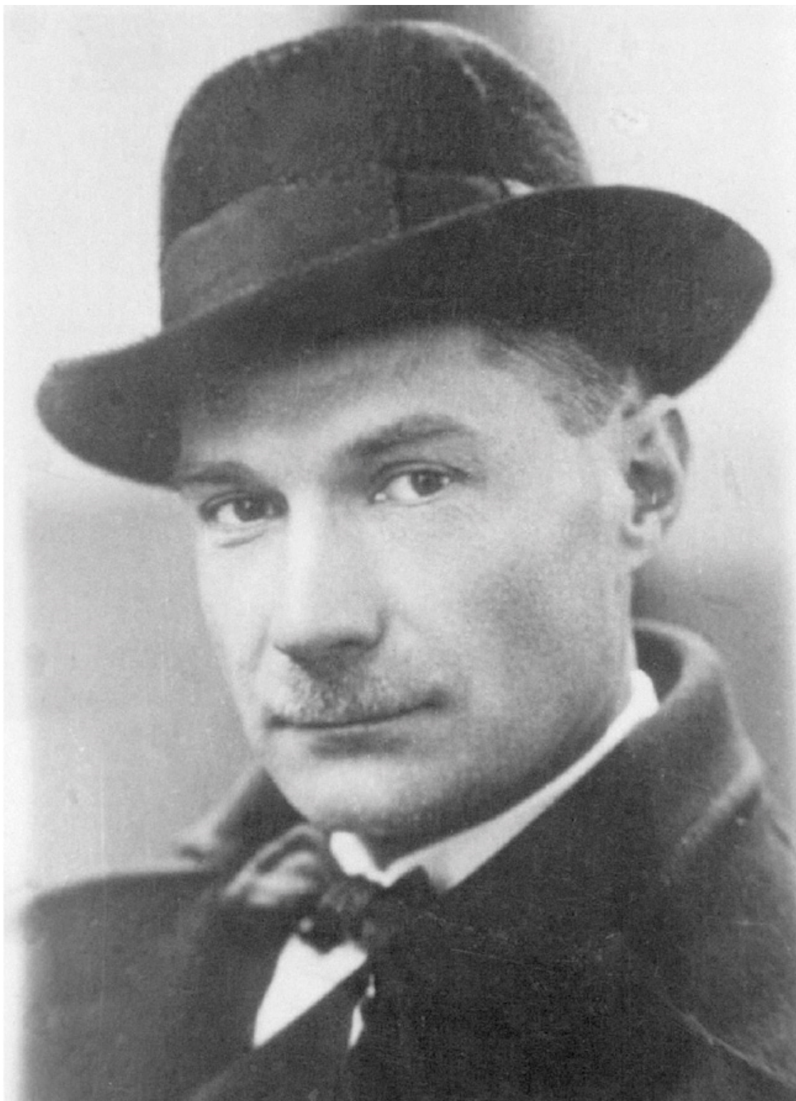
Евгений Замятин. 1919 год. 1