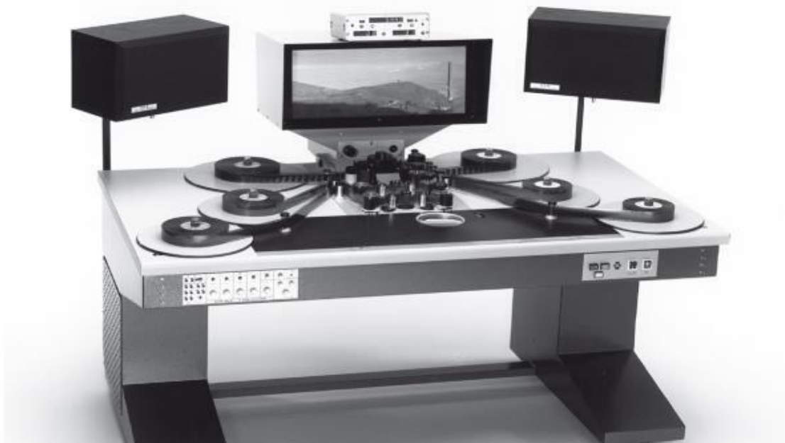
Изображение 1.2 Монтажный стол KEM.

KEM rolls: KEM – марка монтажных столов (Keller- Elektro-Mechanik). KEM roll – серия дублей, склеенных вместе так, что их можно просматривать последовательно друг за другом и использовать в качестве комбинированного источника.