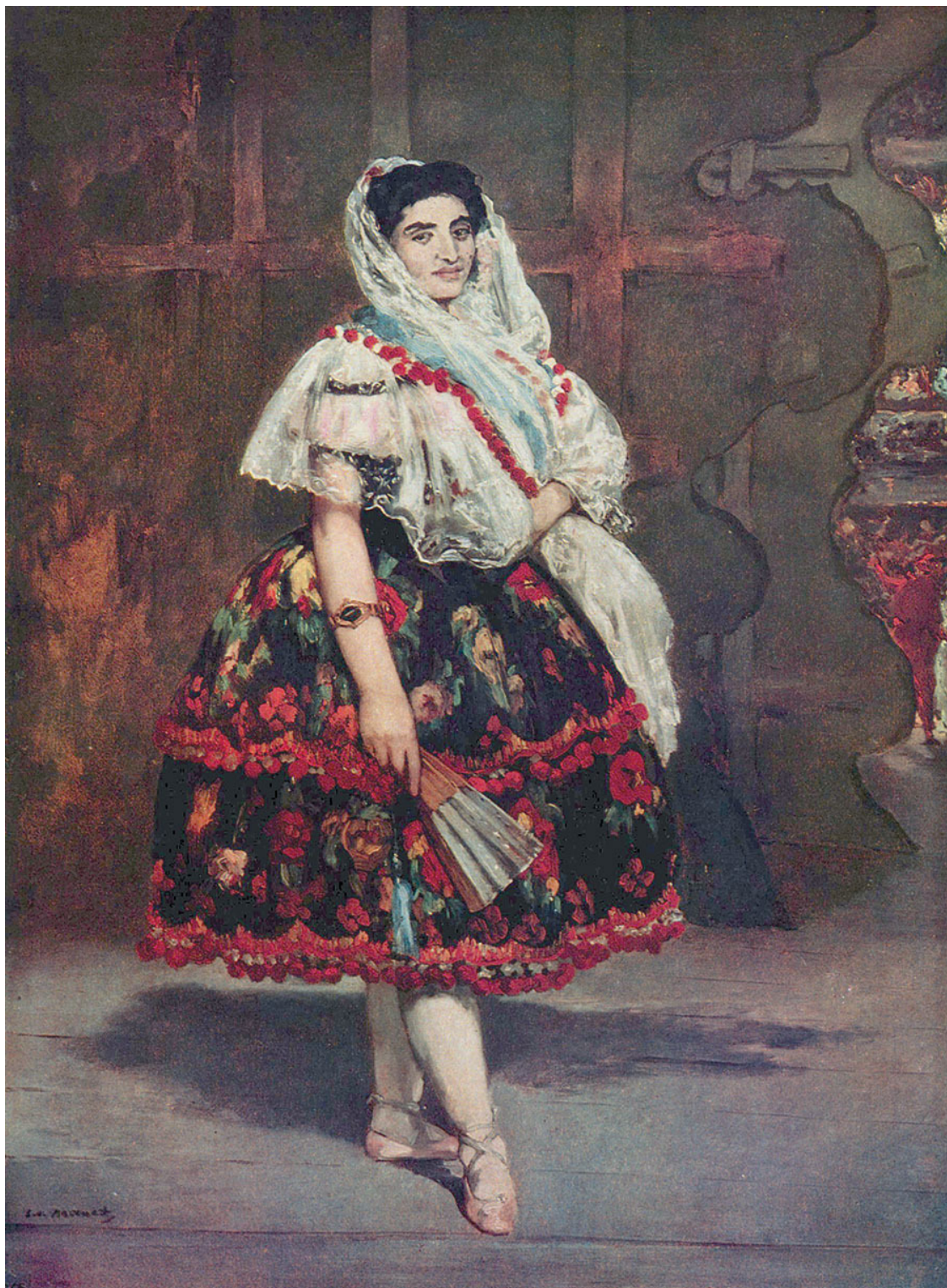
Э. Мане. Лола из Валенсии. 1862. Музей Орсе, Париж

В природе существуют миллионы оттенков цветов. Возникает вопрос: можно ли утверждать, что кто-то в силах оценить цвет во всем спектре его оттенков? Ведь по сути цвет – это «терра инкогнита», целая Вселенная.