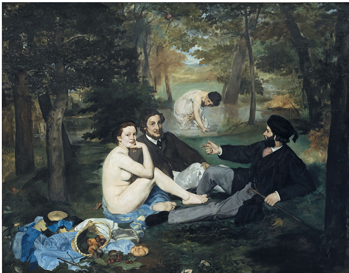
Э. Мане. Завтрак на траве. 1862–69. Галерея института искусств Курто, Лондон

В силу нескрываемого эпатажа полотно стало предметом всеобщего внимания, а Эдуар Мане приобрел скандальную известность.