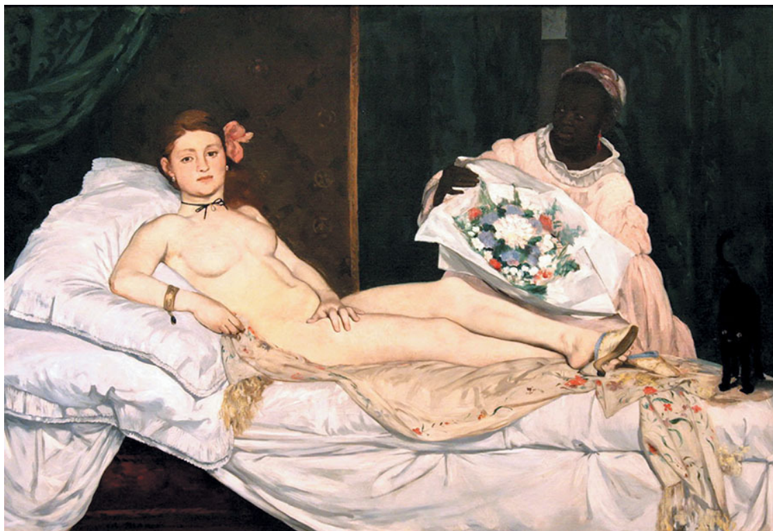
Э. Мане. Олимпия. 1863. Музей Орсе, Париж

ник обращается к сюжету с известной долей иронии. Не видно и намека на изящные и утонченные черты. Тициан и его многочисленные последователи писали Венеру в соответствии с каноном, изысканно.