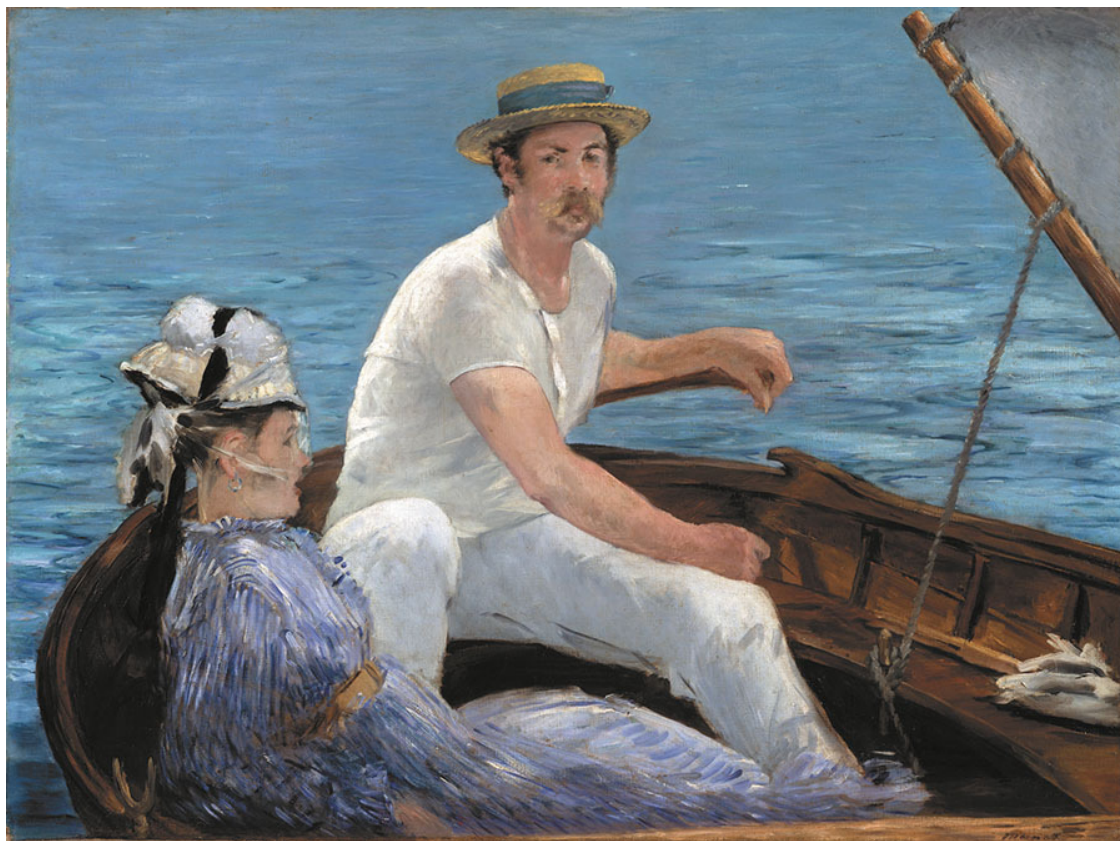
Э. Мане. В лодке. 1874. Музей Метрополитен, Нью-Йорк

Общеизвестно, что новое вызывает на первых порах вполне естественную отрицательную реакцию, являющуюся следствием определенной инерции мышления. Сейчас зритель в основном понимает и принимает творчество Мане, которое заняло достойное место в истории искусства.