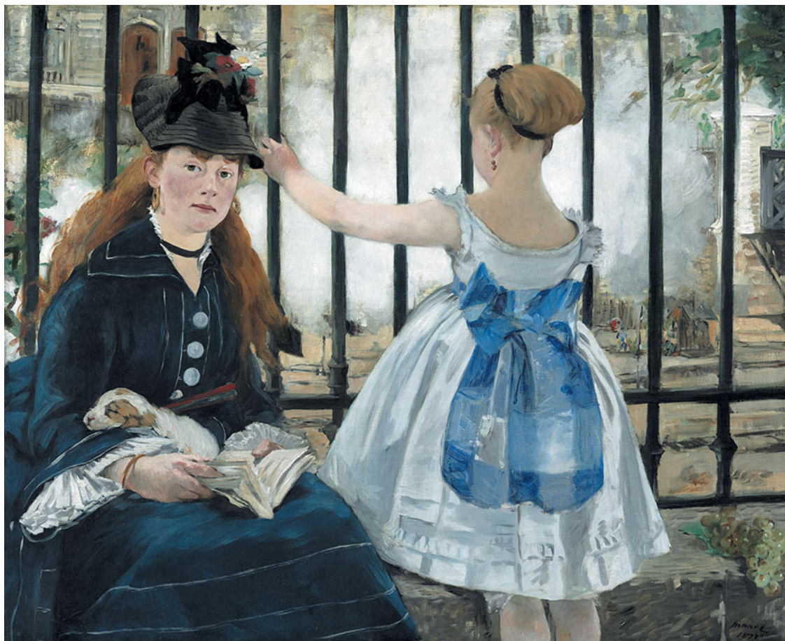
Э. Мане. Железная дорога. 1873. Национальная галерея искусств, Вашингтон

Героиня в какой-то момент оторвала глаза от книги и как бы задумалась. Взгляд ее завораживает и интригует. Состояние умиротворения подчеркивает щенок, который мирно посапывает у нее на руке. Девочка, схватившись за железную решетку, забыв обо всем, с восторгом смотрит на окутанный дымом паровоз. Она даже бросила гроздь винограда, которую, по всей видимости, только что держала в руке. Во всем негромкая гармония. Даму же отнюдь не занимает вид поезда, который, вероятно, она видела не раз, для нее в этом нет никакой новизны. Особым образом работает и цвет. Рыжие волосы модели перекликаются с волосами девочки. Как сочно написан голубой пояс с бантом девочки, как написаны ее шея, перехваченные черной лентой волосы! Несомненно, есть что-то волнующее в этой сцене; она напоминает о знакомых, обычных и вместе с тем вечных вещах.