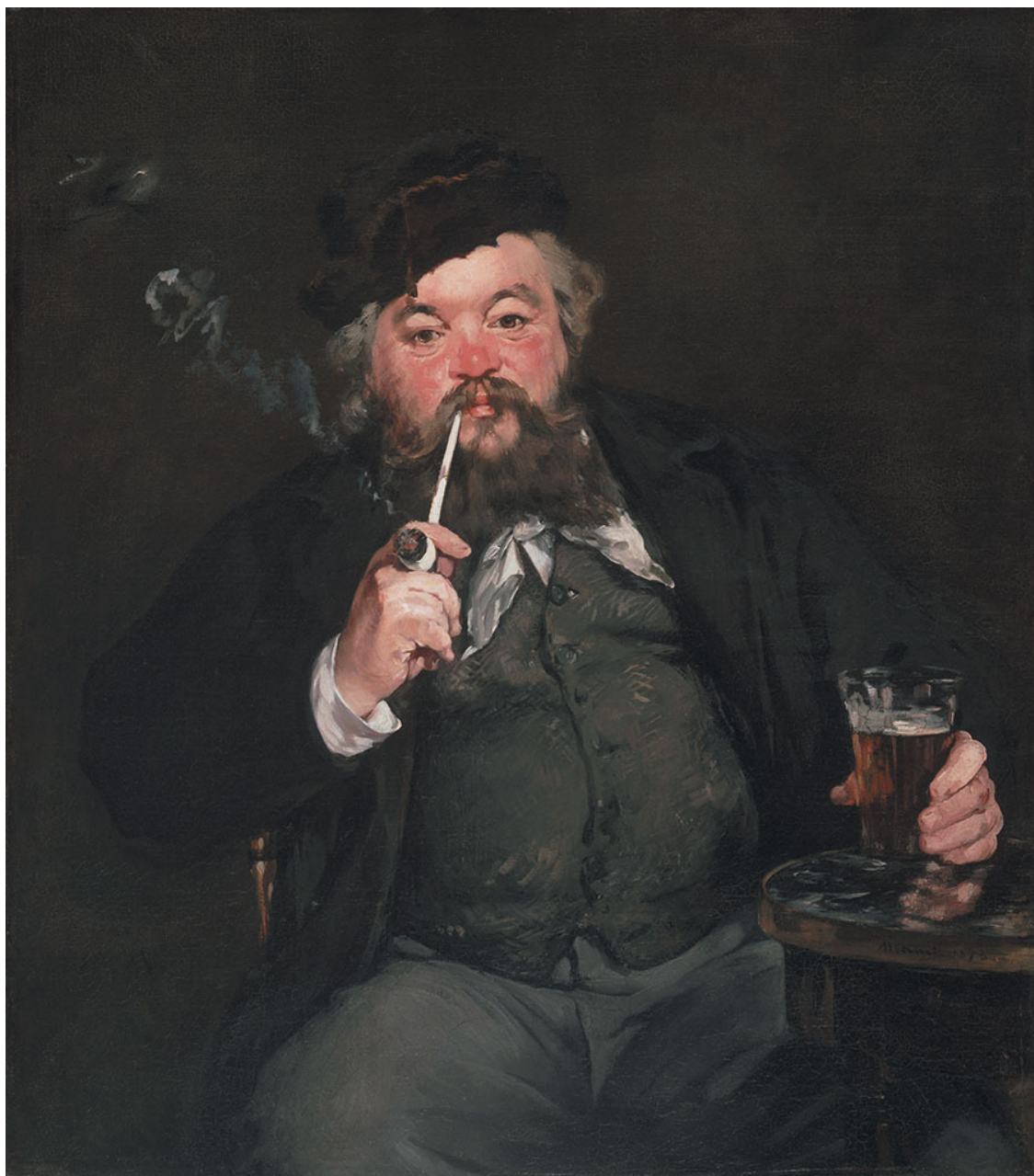
Э. Мане. За кружкой пива. 1873. Художественный музей, Филадельфия

Еще одно значимое полотно художника – «Балкон». Со своей любимой подругой и моделью Бертой Моризо Мане познакомился в Лувре, когда она копировала какую-то работу. Она тоже была художницей и входила в круг импрессионистов. Он представился и пригласил ее к себе в мастерскую. Поначалу она приходила к нему в сопровождении матери, потом с сестрой, что вполне объяснимо: вряд ли родители решились бы отпустить юную особу к художнику.