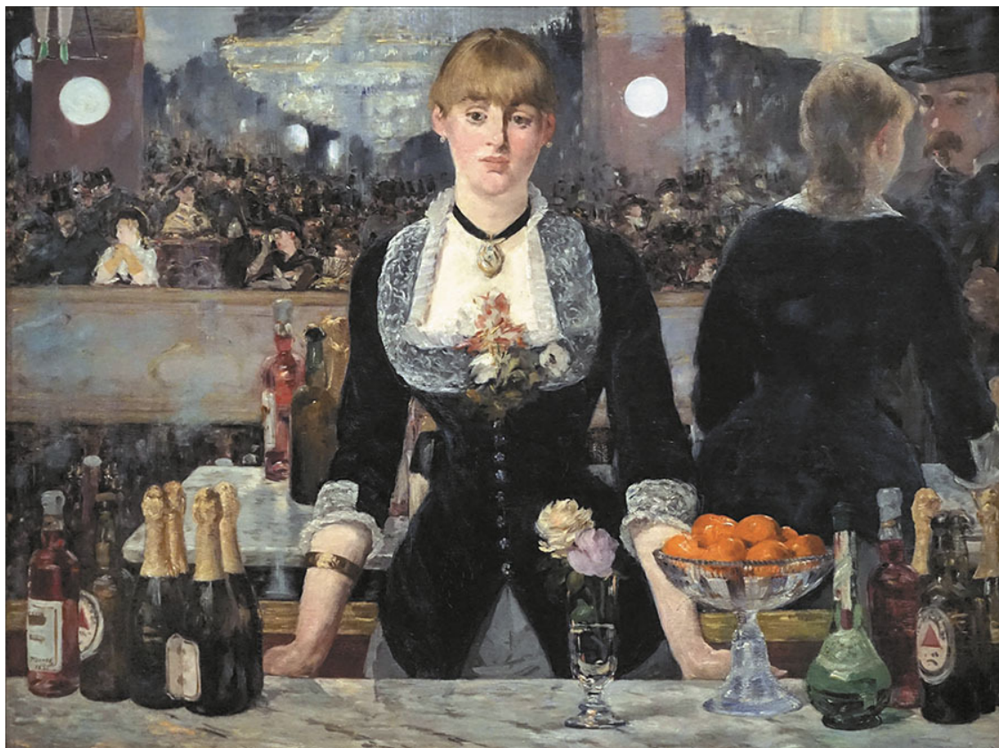
Э. Мане. Бар в «Фоли-Бержер». 1882. Галерея института искусств Курто, Лондон