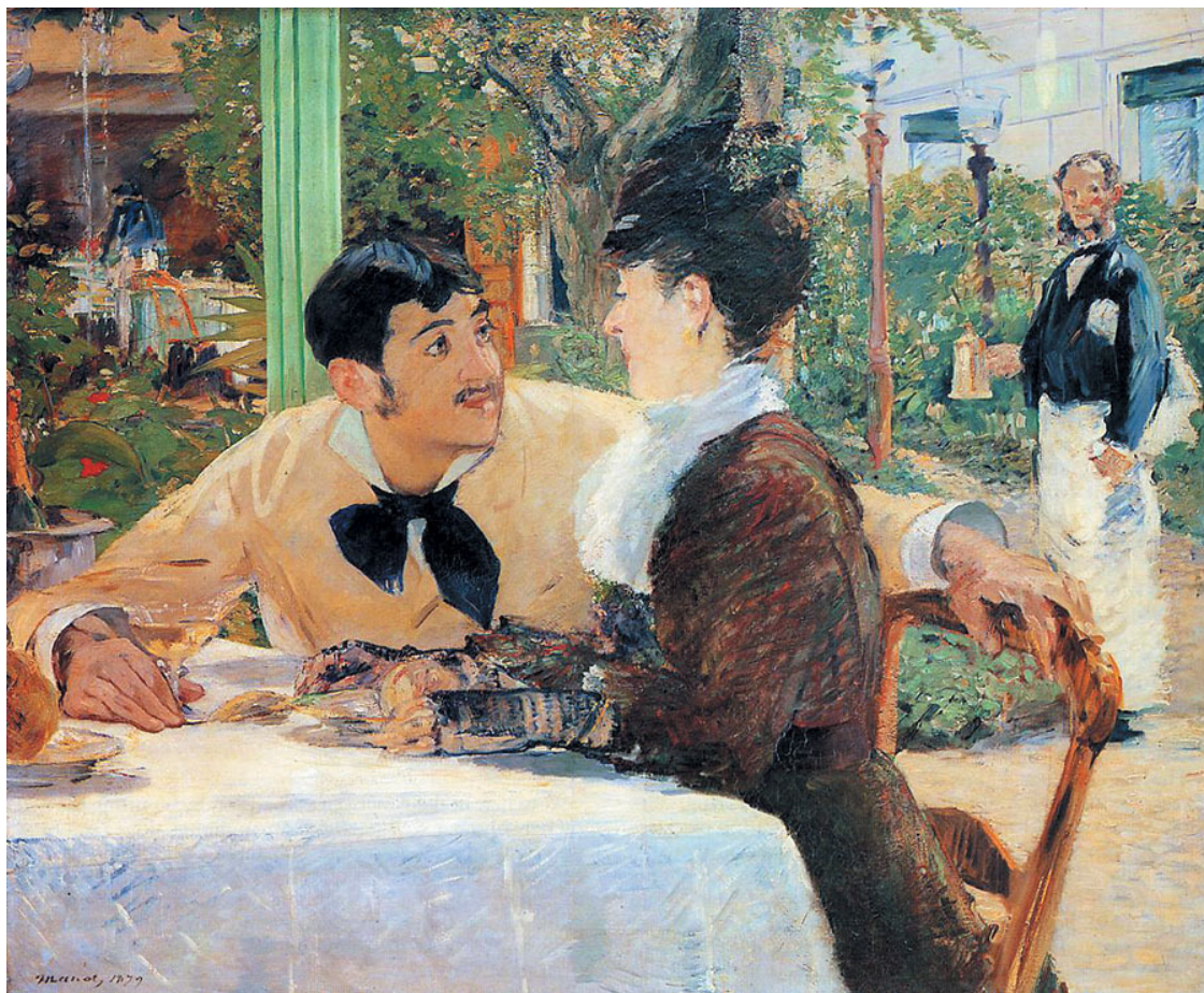
Э. Мане. У папаши Латюиля. 1879. Музей изобразительных искусств, Турне

Вызывает сожаление тот факт, что человек такого дарования ушел в расцвете творческой зрелости, в возрасте 53 лет. Хотя, к сожалению, подобная судьба не миновала многих художников. О широте творческих возможностей Мане можно судить по искрящемуся и невероятно полифоническому полотну «Бар в “Фоли-Бержер”» , одному из его заключительных шедевров, созданному незадолго до смерти, в 1882 г. Художник уже был болен, приходилось часто лежать на диване, тем не менее он находил силы вставать, чтобы вновь и вновь идти в бар, делать там наброски, общаться, шутить со своими светскими друзьями. В мастерской он воспроизвел прилавок, для того чтобы писать, что называется, с натуры. В качестве модели он изобразил Сюзон, работавшую в баре, которую знали все завсегдатаи.