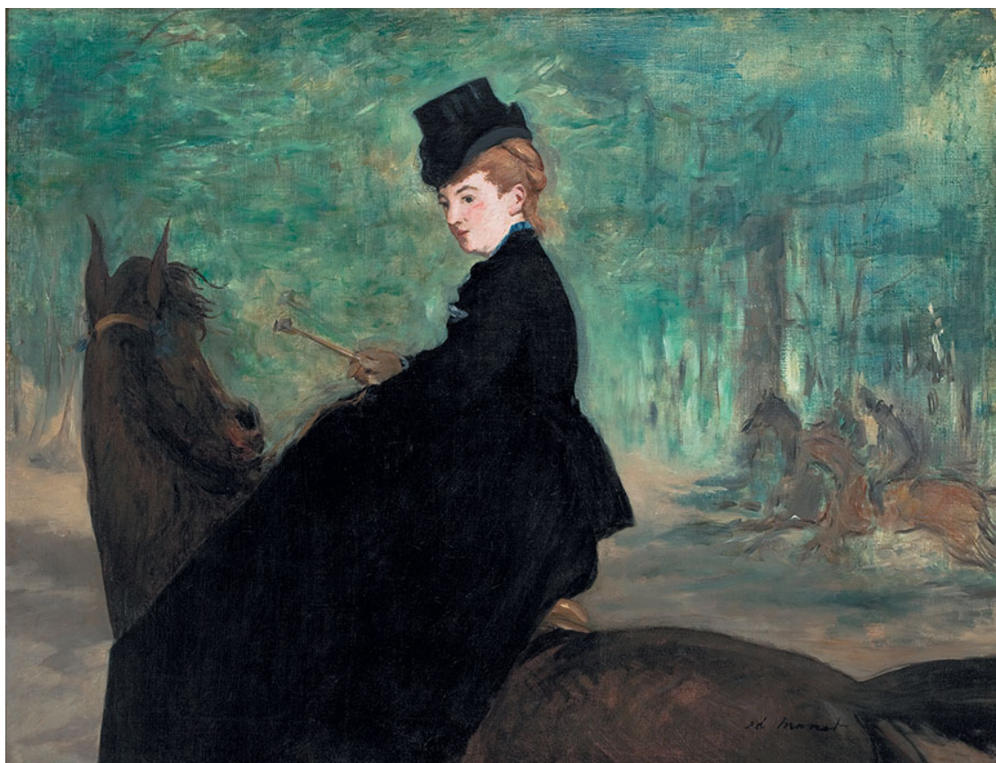
Э. Мане. Амазонка. 1875. Музей искусств, Сан-Паулу

Но, невзирая на свое состояние, он начал работу над новой большой картиной, которая предназначалась для Салона. Это была «Амазонка». Стремился успеть написать. Во время работы, как рассказывал один его приятель, он то поднимался с дивана, писал, то ложился. Однажды Мане подошел к картине, стал наносить изображение быстрыми мазками, вдруг зашатался, пошел к дивану как сомнамбула и упал на него. Придя в себя, некоторое время критически смотрел на картину, затем резко встал, схватил нож и разрезал полотно. Картина не была закончена и не была представлена на Салоне.