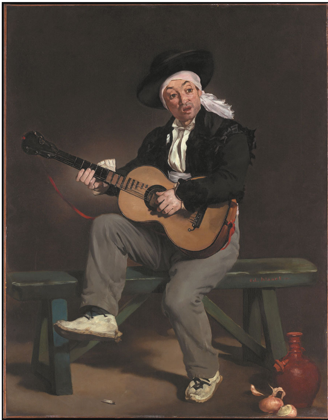
Э. Мане. Гитарреро. 1860. Музей Орсе, Париж

Однако экспозиция картин в Парижском салоне ни в какой мере не повлияла на признание мастера, потому что следующее его полотно, «Купание» , в 1863 г. наряду с тремя тысячами работ других художников было отвергнуто членами жюри и стало причиной скандала, буквально взорвавшего общественность. В результате по распоряжению императора Луи Наполеона Бонапарта была создана альтернативная площадка – Салон отверженных. Здесь и были представлено знаменитое «Купание» , получившее впоследствии название «Завтрак на траве» , моделями для которого, помимо Викторины Меран, стали брат Мане и его шурин.