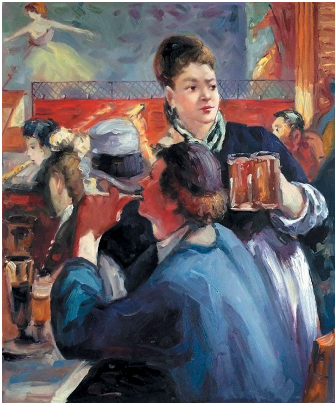
Э. Мане. За столиком в варьете. 1878–80. Национальная галерея, Лондон

Большим успехом пользовалась и картина «За кружкой пива» . Она была принята Парижским салоном и понравилась критикам. Мане не интересуется, в каком пространстве находится его персонаж: когда выявляется суть, не столь важно место, где происходит действие, если оно никак не раскрывает и не дополняет основную мысль. Впечатляет своеобразная «химия» происходящего, то, какими изобразительными средствами пользуется художник. Действительно, перед нами типичный любитель пива. Это видно по характеру, по выражению лица – этакий полный довольства, слегка опьяненный пивными парами типаж. Он – сама доброта. Находясь в состоянии расслабленности, полного блаженства, он может покурить любимую трубочку. Контрастные кольца дыма растворяются на темном фоне. Художник только пятном, светом выделяет главное – румяное лицо, полное внутреннего довольства, отрешенности от