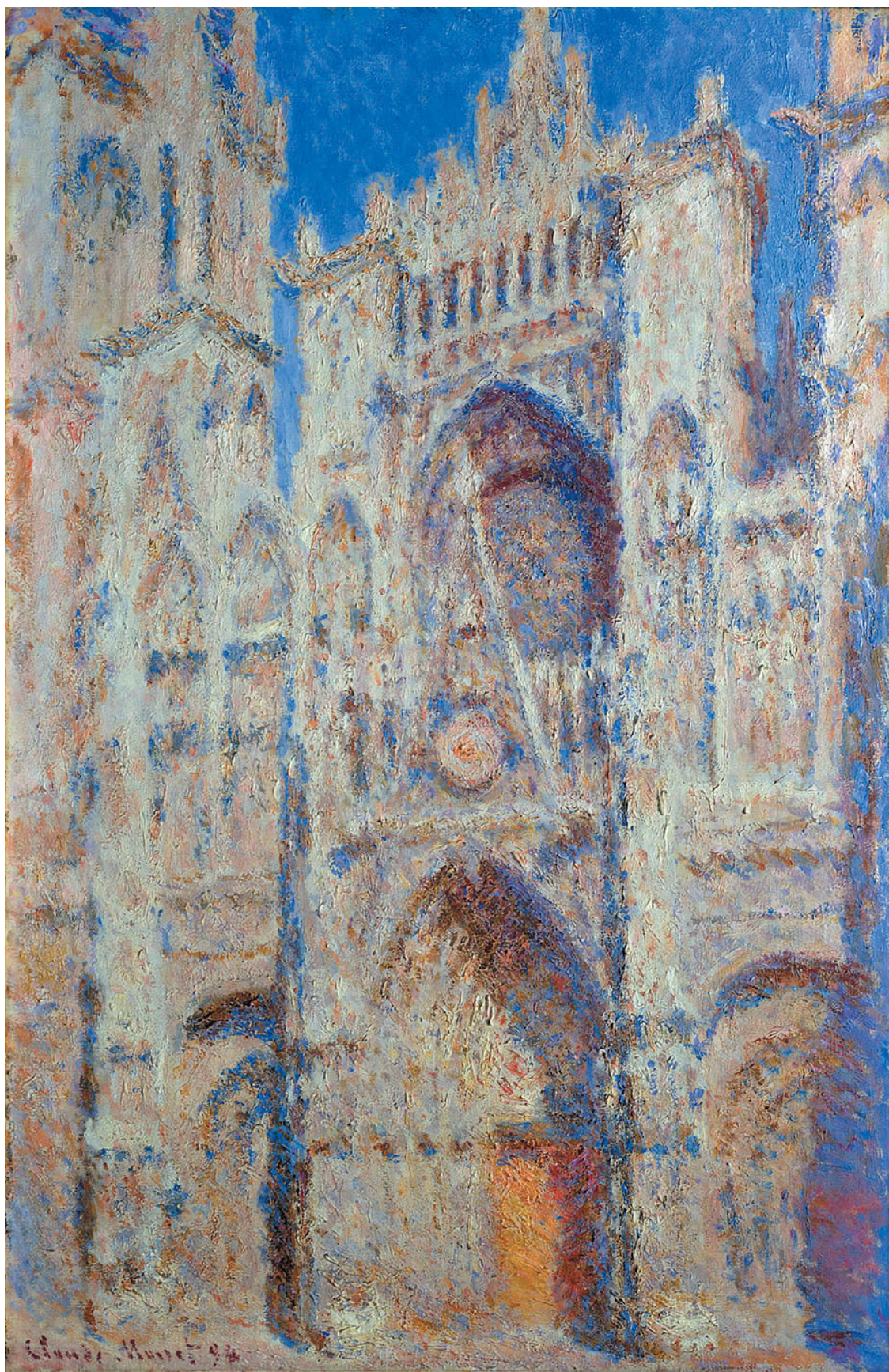
К. Моне. Руанский собор, фасад (закат), гармония в золотых и синих тонах. 1892–94. Музей Мармоттана Моне, Париж