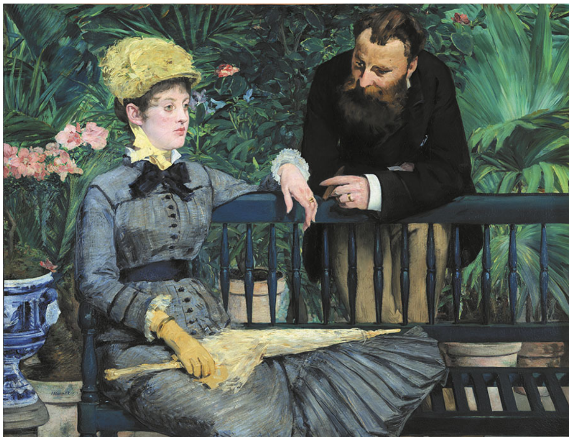
Э. Мане. В оранжерее. 1878–79. Старая и Новая Национальные Галереи, Музей Берггрюна, Берлин

Возможно, именно в минуты подобных откровений возникает понимание полноты восприятия жизни. Это как момент истины, момент глубины самоощущения, когда приходит обостренное сопоставление истинного и ложного, важного и несущественного, когда зерна отделяются от плевел. Возникает понимание, что самое важное для нас – мы сами, наш жизненный опыт, наши переживания, наше бытие. Многим свойственен поиск философского камня жизни, эдакой «чаши Грааля» собственного бытия. Общеизвестно, что большинство из нас живет будущим, опираясь, однако, при этом на прошлое и настоящее, соотнося одно с другим. Поэтому, время от времени кладя на чашу весов гирьки чужого опыта, мы быстрее приходим к необходимым выводам. Хотя подчас они и кажутся недо статочно убедительными при определении истинного и ложного.