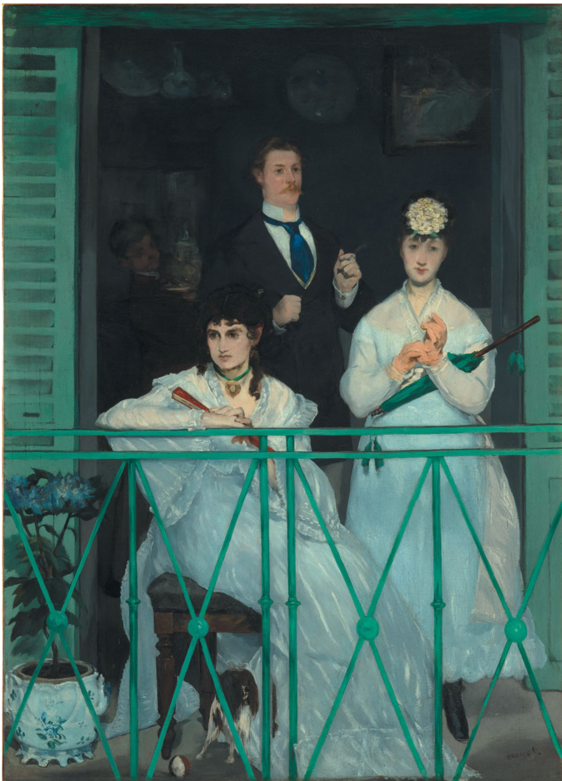
Э. Мане. Балкон. 1868. Музей Орсе, Париж

В подлинном качестве, в подлинной глубине мы проявляем себя в состоянии созерцания, потому что только в эти мгновения ощущаем себя наиболее естественно. Что-то важное происходит в душе, когда погружаешься в этот удивительный мир. Ибо реальность подчас настолько груба, что порой утрачивается способность воспринимать нюансы, чувствовать тонкие отношения, благодаря которым перед нами открывается подлинная красота мира. Когда мы находимся в созерцательном состоянии, то отключаемся от всего грубого в этом мире, находясь