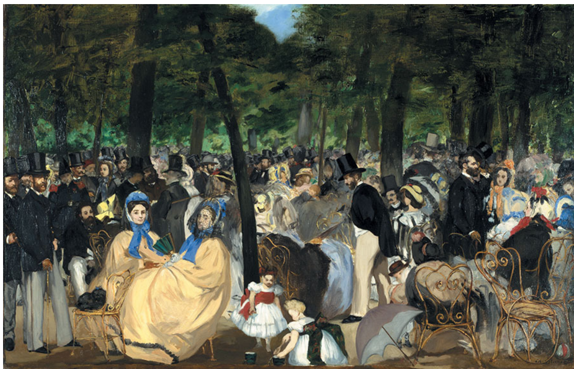
Э. Мане. Музыка в саду Тюильри. 1862. Национальная галерея, Лондон

Еще одна из ранних импрессионистических картин художника, также всколыхнувшая общество, – «Музыка в саду Тюильри». Прогуливаясь по Парижу, Мане и Бодлер забредали порой и в парк Тюильри. В ту пору там часто проводились концерты, где зрители, свободно располагаясь перед сценой, отдыхали, общались и слушали музыку. Мане избрал ракурс зрения в этом полотне со стороны сцены, на которой располагался оркестр. Взору зрителя предстают собравшиеся на концерт представители парижского общества во всем его многообразии.