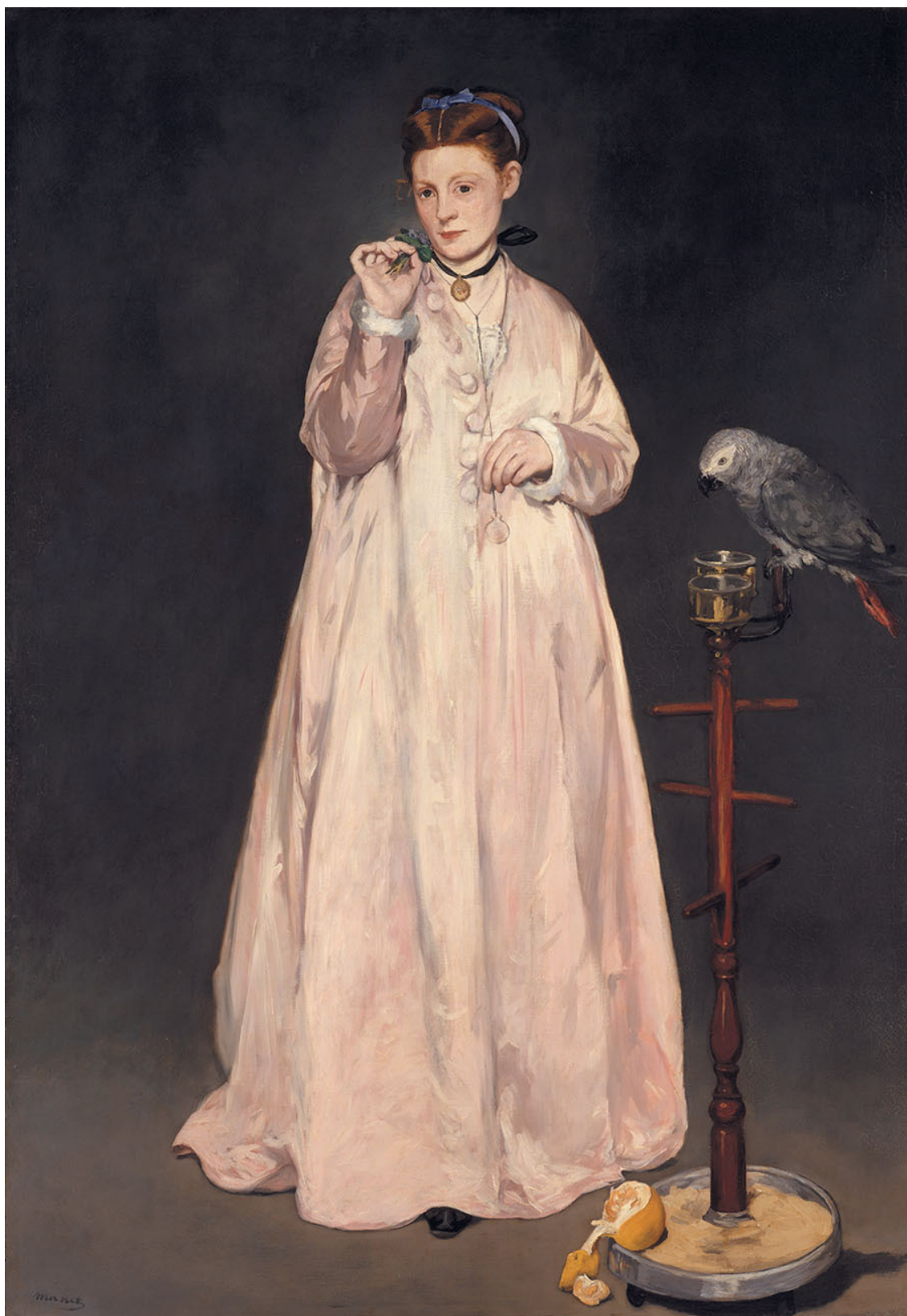
Э. Мане. Молодая дама с попугаем. 1866. Музей Метрополитен, Нью-Йорк