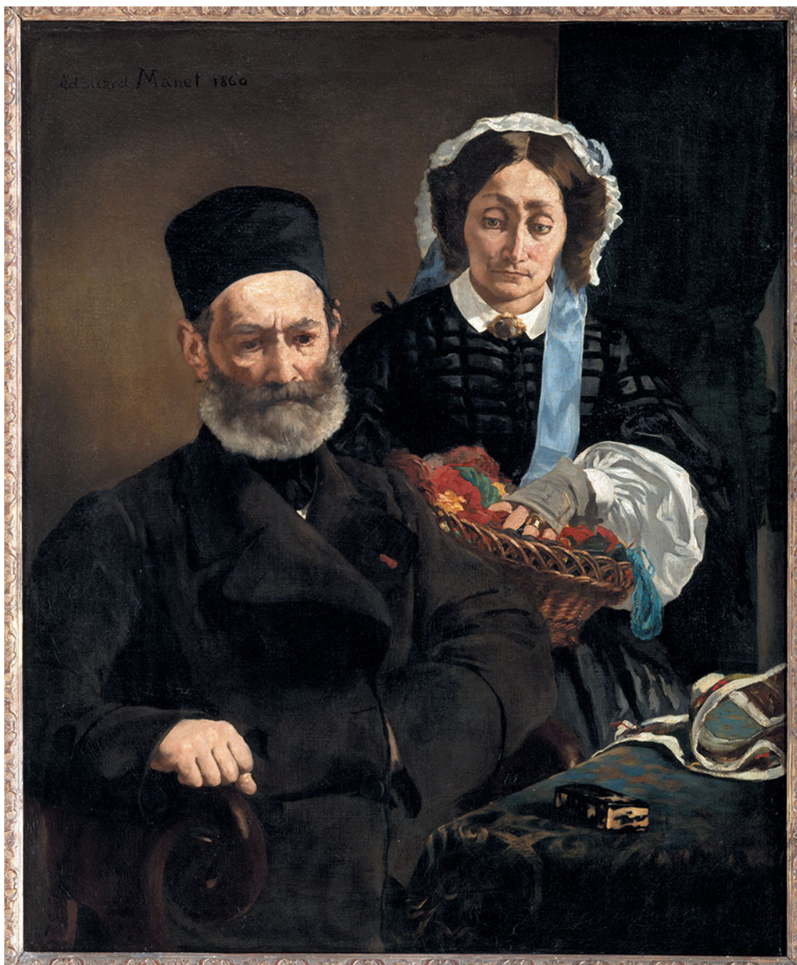
Э. Мане. Родители. 1866. Музей Орсе, Париж