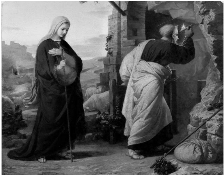
Вечер перед рождением Христа. Михаэль Ризер. 1869 г.

На что русские князья отвечали: «Мы истукану кланяться не будем, а вот вашему хану поклонимся до земли, потому что за наши грехи он поставлен над нами правителем. И мы почтим эту волю Божию. Хану мы будем кланяться, а истуканам мы кланяться не хотим». В том, что верующие люди все воспринимают как из рук Бога, есть своя логика. Если кто-то недоволен своим правителем, на самом деле он должен пенять на самого себя. Значит, наш нравственный облик таков,