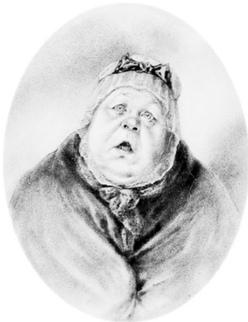
Петр Боклевский. Коробочка. Иллюстрация к «Мертвым душам». 1895 год 9

В этом контексте Чичиков – карнавальный, балаганный чертик, ничтожный, комичный и противопоставленный возвышенному романтическому злу, часто встречающемуся в современной Гоголю литературе («дух отрицанья, дух сомненья» – пушкинский демон – является у Гоголя в образе во всех отношениях приятной дамы, которая «была отчасти материалистка, склонная к отрицанию и сомнению, и отвергала весьма многое в жизни»).