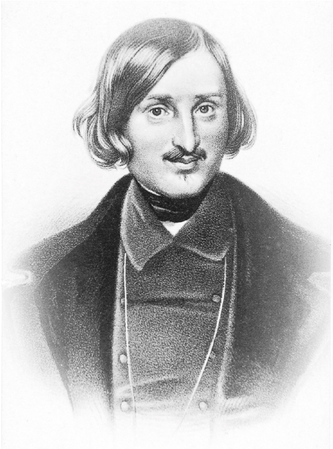
Николай Гоголь. Фотография с портрета работы Федора Моллера 1841 года. 1