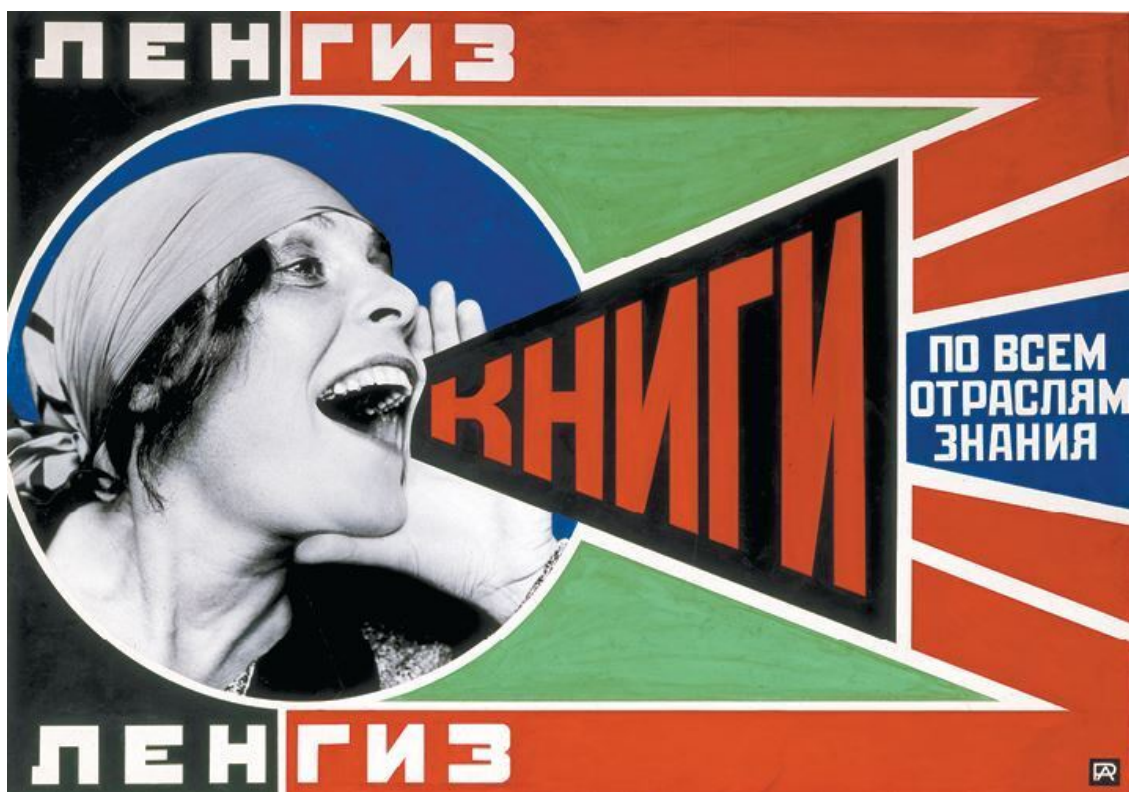
А. Родченко. Плакат «Ленгиз: книги по всем отраслям знаний», 1925 год

Яркий пример авангардной рекламы, включающей все излюбленные приемы того времени: фотомонтаж, яркие открытые цвета, строгую геометричность. Александр Родченко одним из первых начал использовать фотографии в рекламе. Сначала он находил подходящие снимки в журналах, книгах и прочих источниках, а потом начал делать их сам. Основой плаката «Ленгиз» стала его фотография Лили Брик.