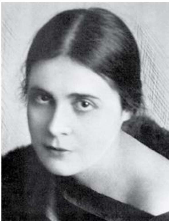
Лиля Брик, 1915 год