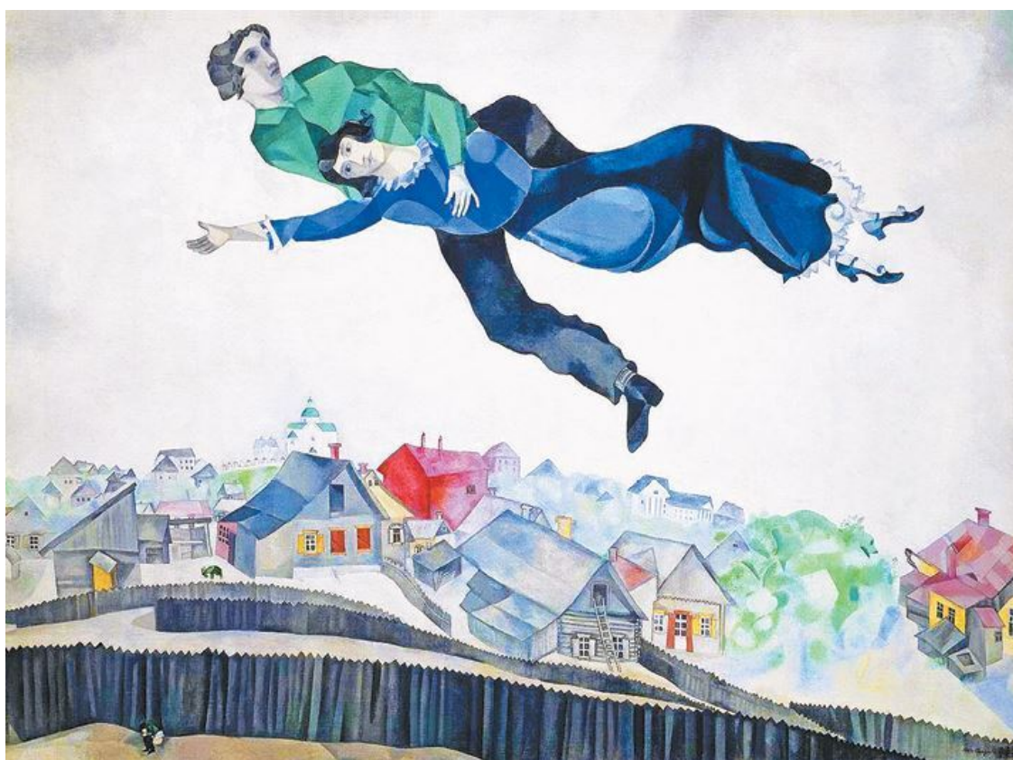
М. З. Шагал «Над городом», 1918 год, Государственная Третьяковская галерея

Бася Рейза Розенфельд – так звучит имя Беллы, данное ей при рождении, – родилась в Витебске в 1895 году. Ее еврейская семья была достаточно обеспечена, отцом Баси был ювелир Шмуль-Ноах, попечитель витебской Талмуд-торы. Девушка любила учиться, что позволило ей без труда поступить в женскую гимназию, выучить французский, немецкий и русский языки. В 1909 году она поступает на историко-философский факультет Московских высших женских курсов. Этот год станет для Баси поворотным – летом она познакомится со своим будущим мужем.