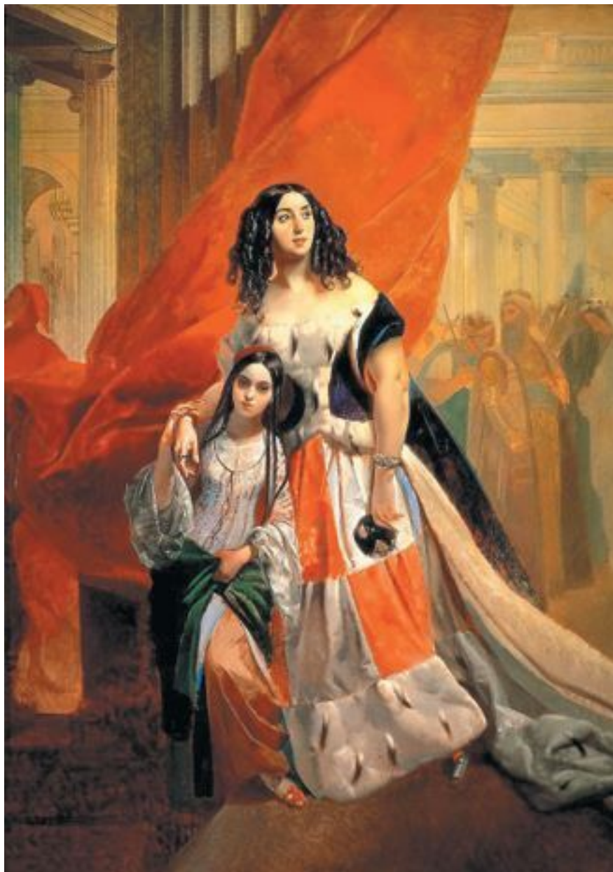
К.П. Брюллов «Портрет графини Самойловой, удаляющейся с бала у персидского посланника (с приемной дочерью Амацилией)», 1842 год, Государственный Русский музей

К слову, художник Карл Брюллов был страстно влюблен в графиню Самойлову. Она много лет была его музой и неоднократно появлялась в работах то в качестве главной героини, то где-то в массовке.