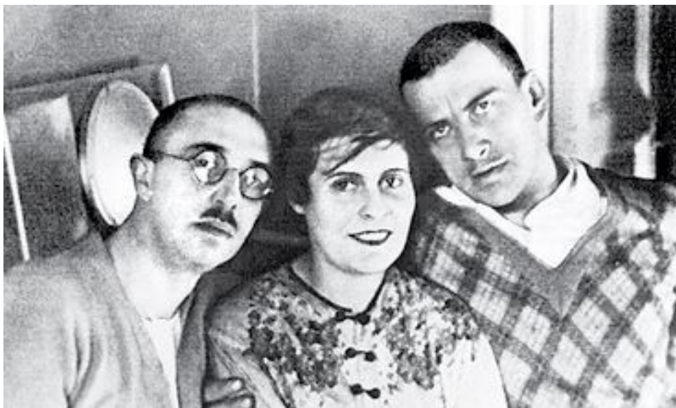
Брики и Владимир Маяковский