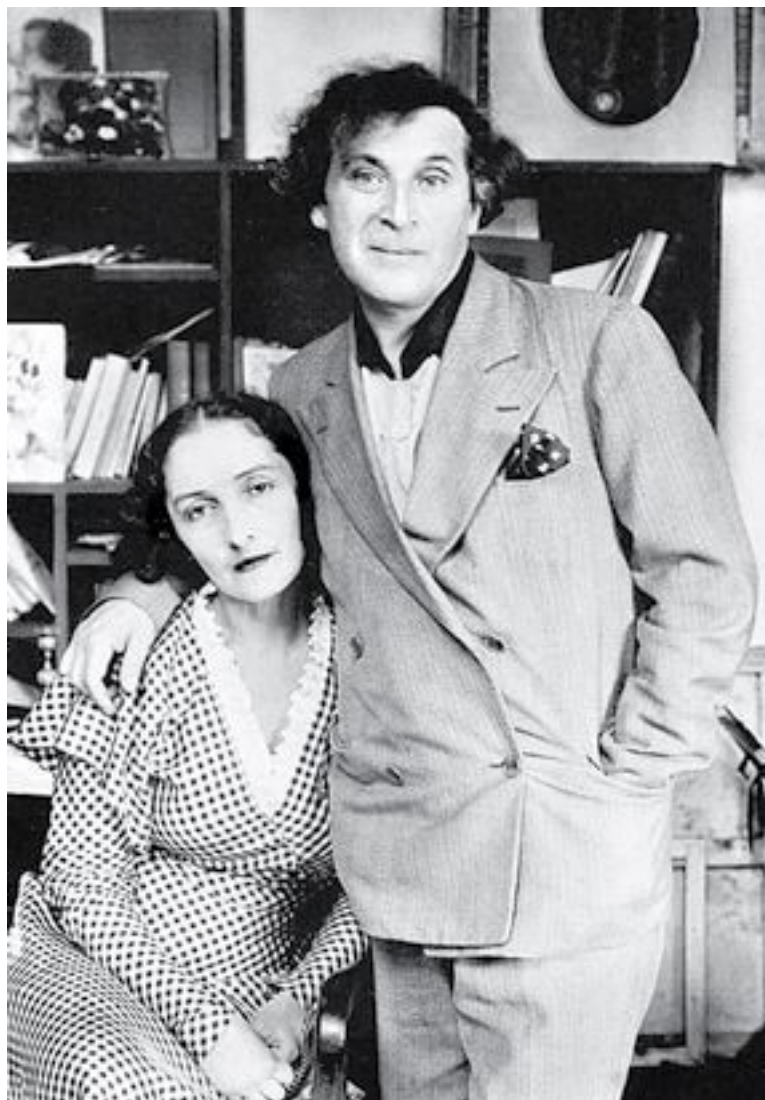
Марк и Белла Шагал

Время шло, Шагал учился живописи сначала в Санкт-Петербурге, а потом в Париже. Белла тоже продолжила обучение. Но серд-цу не прикажешь – долгие годы учебы они переписывались и в 1915 году, спустя шесть лет после знакомства, сыграли свадьбу. Через год у Марка и Беллы рождается единственная дочь – Ида. Белла отказывается от сценической карьеры, на годы забывает о литературе и посвящает себя мужу и дочери.