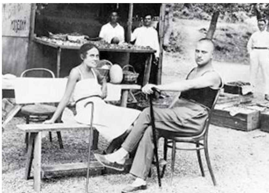
Лиля Брик и Владимир Маяковский на море

Первый кризис в отношениях наступил зимой 1922 года. Лиля предложила Маяковскому расстаться хотя бы на несколько месяцев, возможно, надеясь разогреть былую страсть. Брик пережила паузу весьма спокойно, тогда как для Маяковского это время оказалось невыносимым.