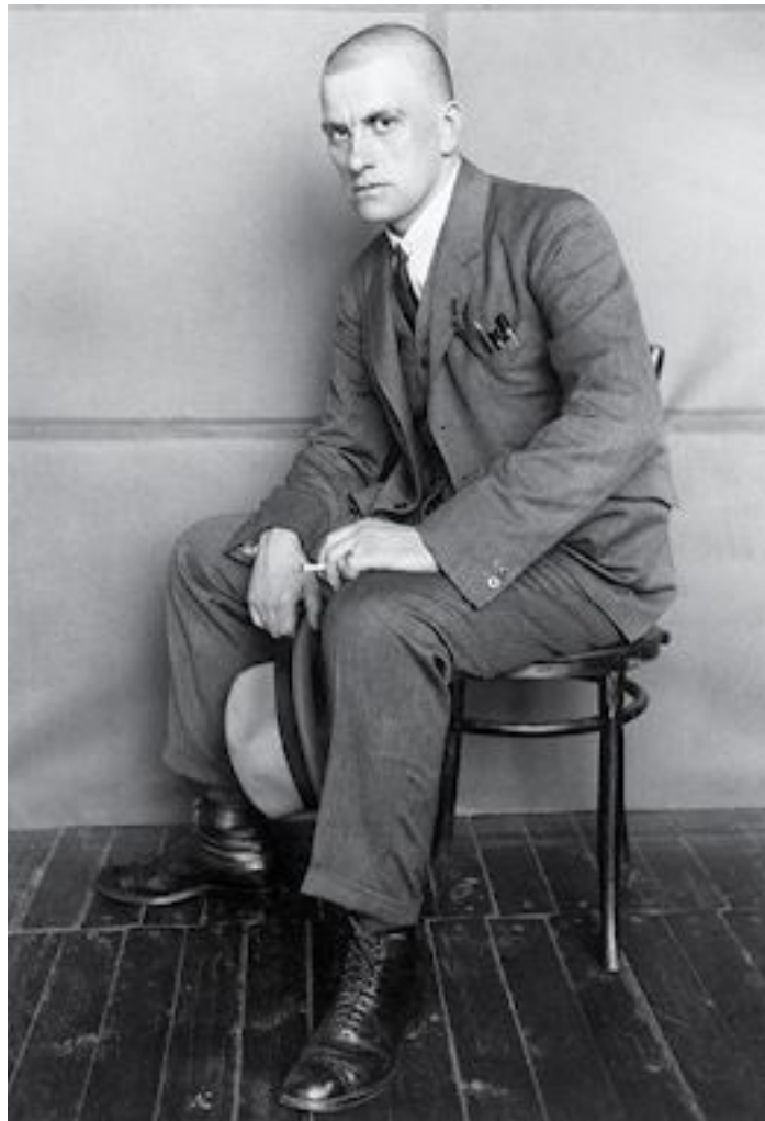
Владимир Маяковский, 1924 год

Из мемуаров Лили Брик, опубликованных после ее смерти, стало известно, что тогда супруги заключили своеобразный договор, по которому оба могли жить своей личной жизнью, не ущемляя права друг друга и сохраняя узы брака. По утверждению Лили, ее интимные отношения с Осипом Бриком прекратились после знакомства с Маяковским, однако он на всю жизнь остался для нее близким человеком. Маяковский хоть поначалу и не был готов делить Лилю с ее законным мужем, но все же покорился ее воле. К слову, именно на средства Осипа Брика была напечатана поэма «Облако в штанах». Забегая вперед – любовный треугольник просуществует почти 15 лет.