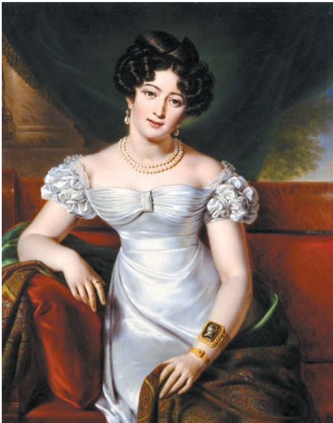
Б. Ш. Митуар «Юлия Павловна Самойлова», 1825 год, Государственный Эрмитаж

Картина была написана в 1832 году по заказу графини Самойловой, происходившей из рода Скавронских, бывших в родстве с императрицей Екатериной I. Графиня была богатейшей женщиной России начала XIX века. После развода со своим первым мужем, графом Николаем Самойловым, Юлия уезжает в Италию и перевозит туда большую часть своего состояния. Не изменяя своим привычкам, в эмиграции продолжает устраивать шикарные приемы и званые ужины, на которых собирается весь высший свет того времени.