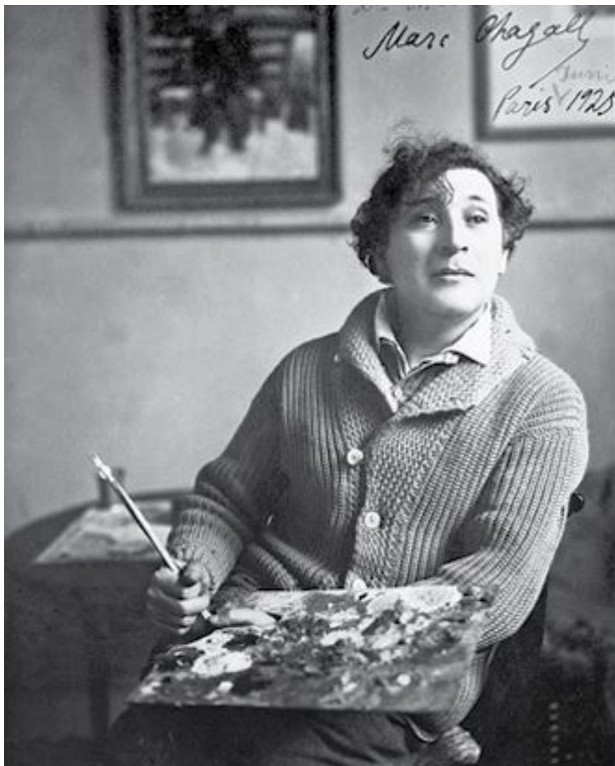
Марк Шагал, 1925 год