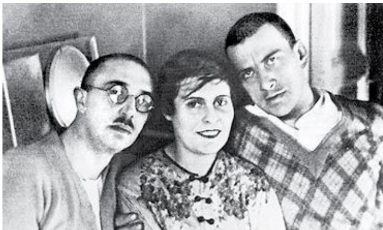
Брики и Владимир Маяковский