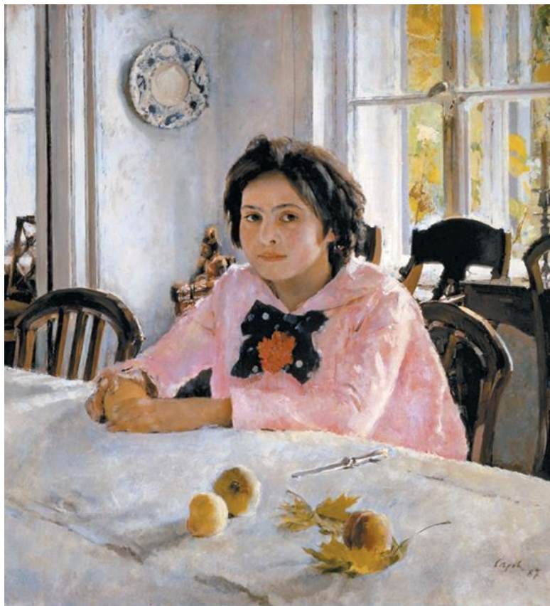
В. А. Серов «Девочка с персиками», 1887 год. Государственная Третьяковская галерея