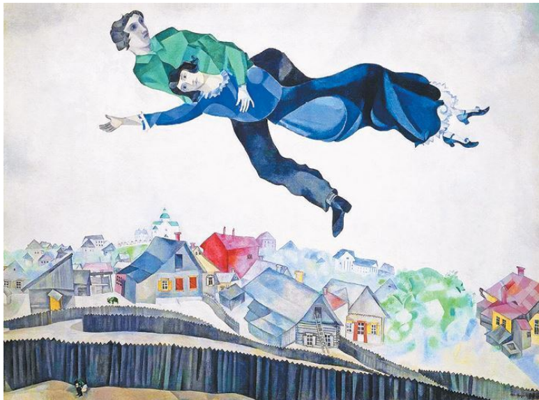
М. З. Шагал «Над городом», 1918 год, Государственная Третьяковская галерея