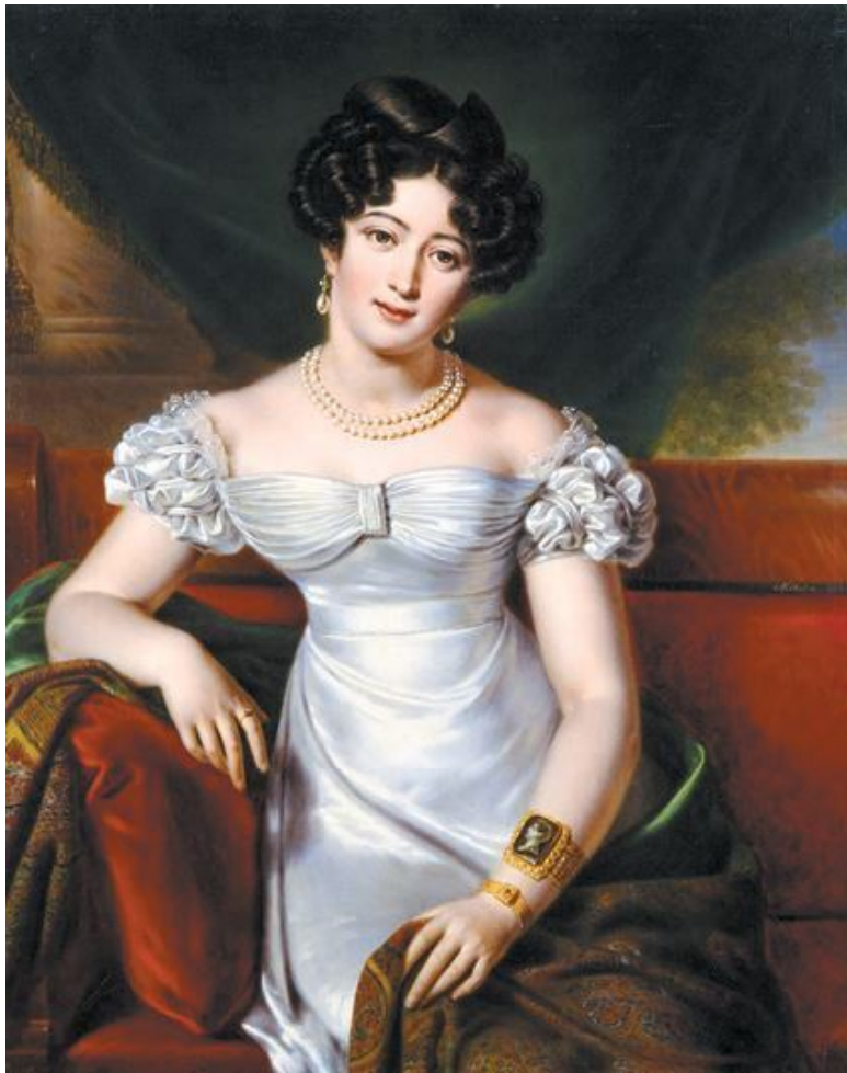
Б. Ш. Митуар «Юлия Павловна Самойлова», 1825 год, Государственный Эрмитаж