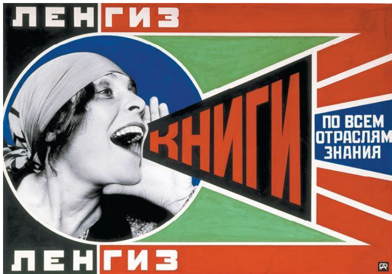
А. Родченко. Плакат «Ленгиз: книги по всем отраслям знаний», 1925 год

Яркий пример авангардной рекламы, включающей все излюбленные приемы того времени: фотомонтаж, яркие открытые цвета, строгую геометричность. Александр Родченко одним из первых начал использовать фотографии в рекламе. Сначала он находил подходящие снимки в журна-