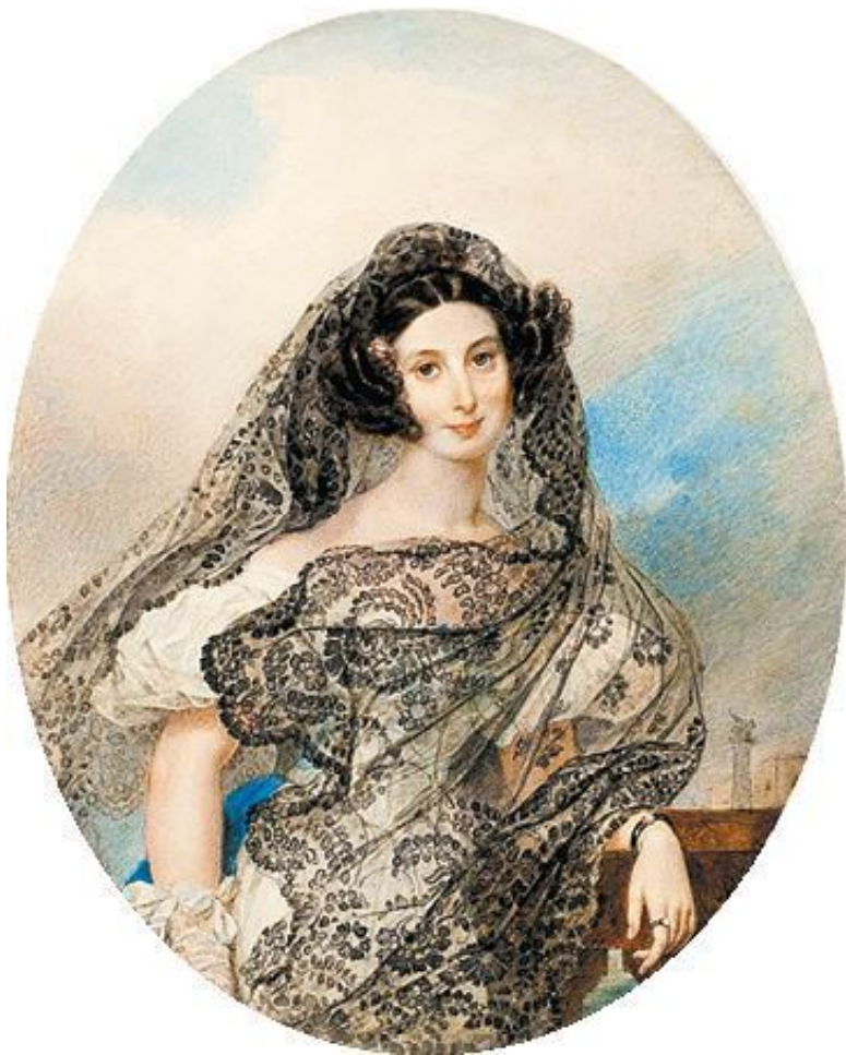
К.П. Брюллов «Джованина Пачини», 1831 год, частная коллекция