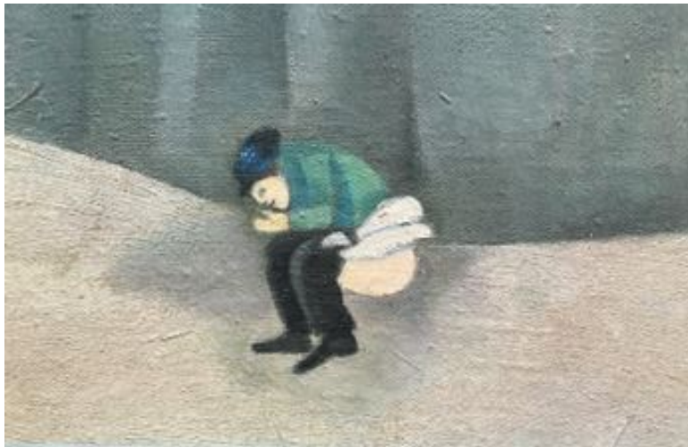
М. З. Шагал «Над городом», фрагмент, Государственная Третьяковская галерея