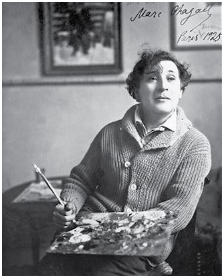
Марк Шагал, 1925 год