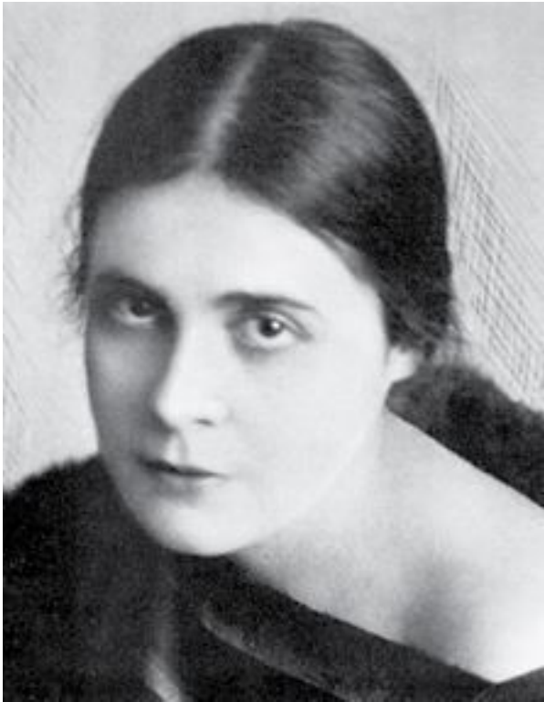
Лиля Брик, 1915 год

лах, книгах и прочих источниках, а потом начал делать их сам. Основой плаката «Ленгиз» стала его фотография Лили Брик.