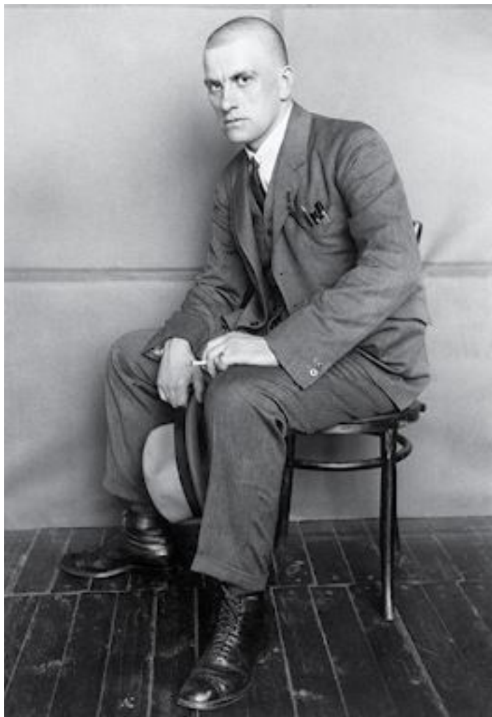
Владимир Маяковский, 1924 год