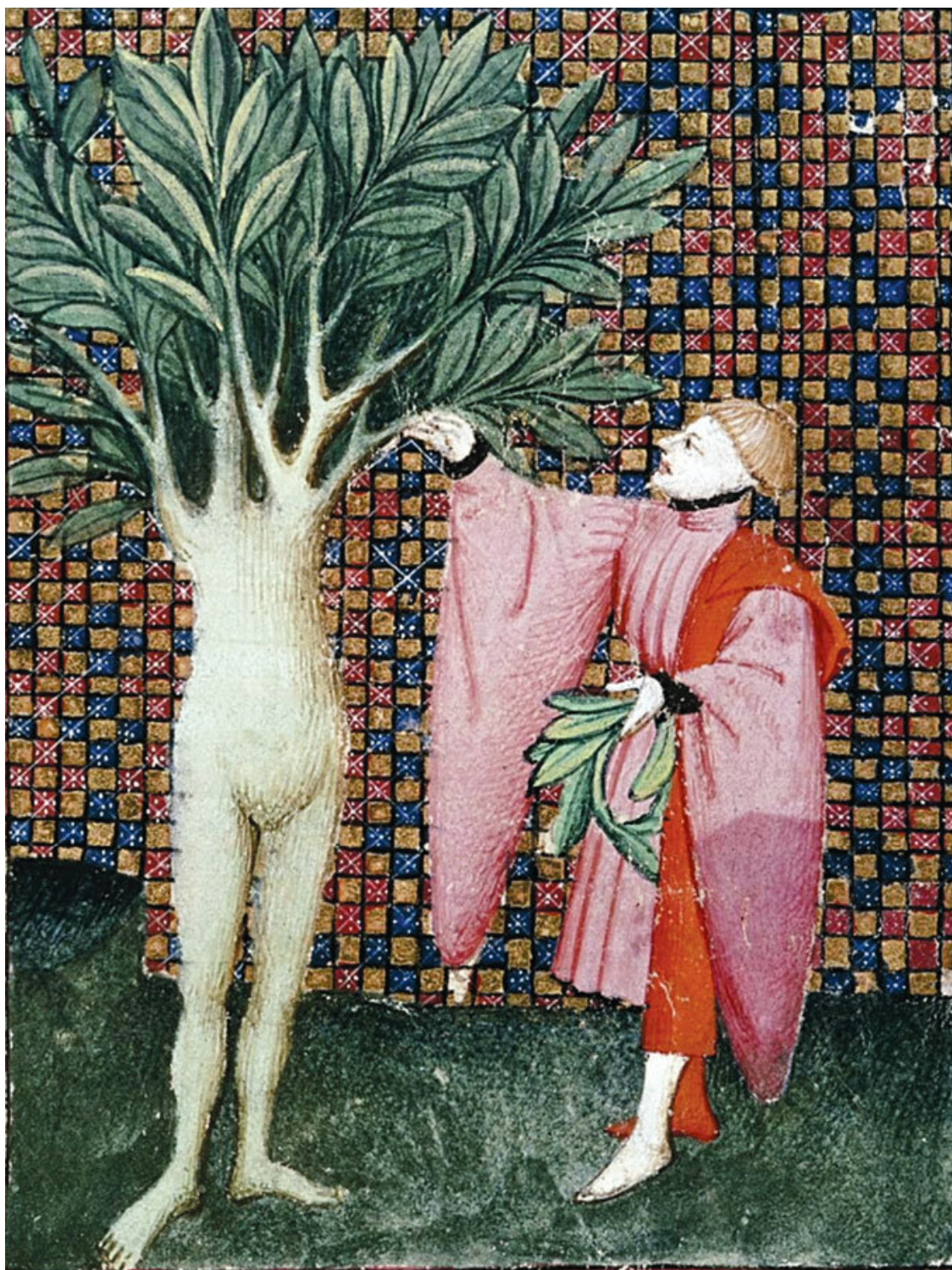
«Аполлон и Дафна», 1410–1414. Миниатюра из «Послания Офеи Гектору» Кристины Пизанской, BL, Harley 4431, Британская библиотека (Лондон)

Иллюстрация к средневековой поэме по сюжетам из «Метаморфоз» Овидия изображает заключительный эпизод мифа о Дафне. Она уже отчаялась спастись от Аполлона и превратилась в лавр (по-гречески название дерева звучит именно как «дафнэ»). Ее руки, голова и волосы окончательно стали ветвями, обнаженное тело постепенно обращается в ствол, покрытый корой, хотя ноги еще различимы. Бог Аполлон (одетый как богатый