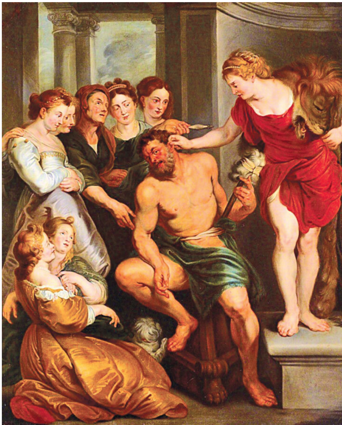
Теодор ван Тольден. «Геркулес и Омфала». 2-я пол. XVII века. Художественный музей Токио Фуджи (Токио)