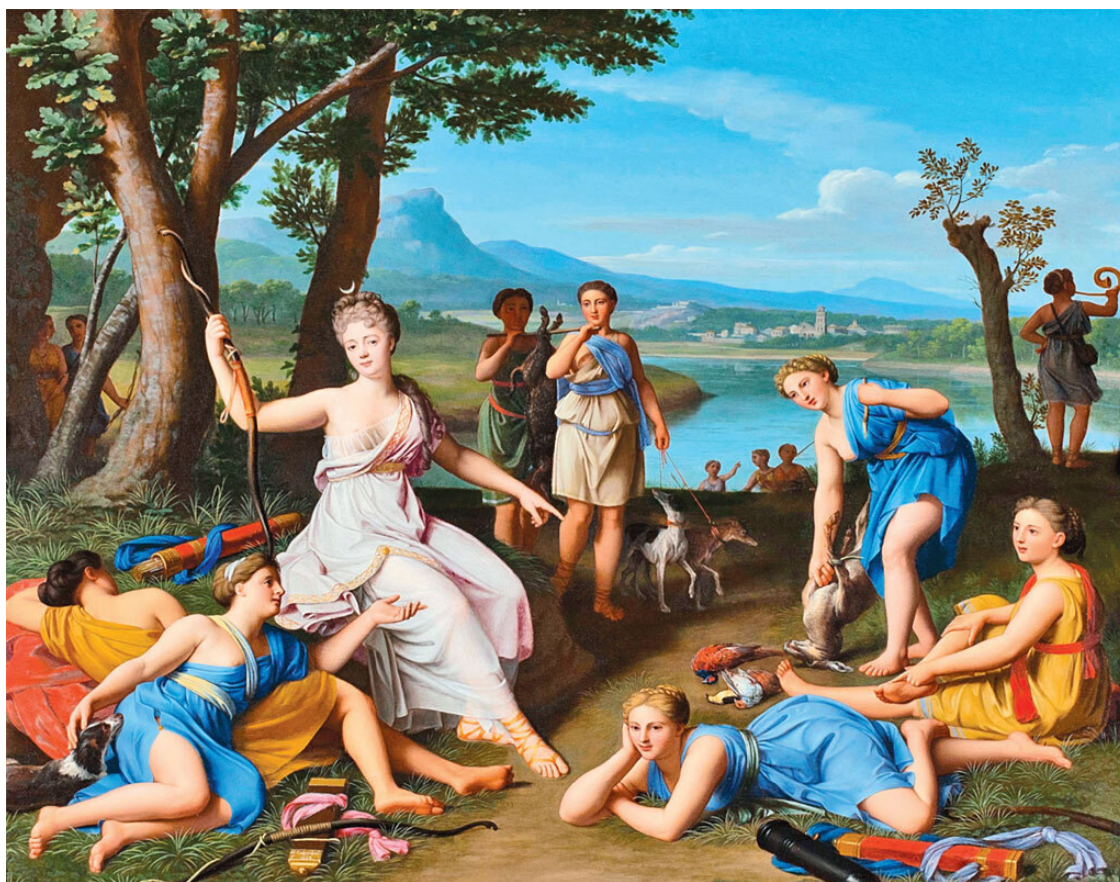
Николя Коломбель. «Возвращение Дианы с охоты». 1697. Частная коллекция. Аукцион The Matthiesen Gallery

На этой мирной картине французского художника эпохи классицизма Диана – богиня луны и охоты с полумесяцем в волосах, изображена в окружении прекрасных полуобнаженных спутниц-нимф. Возможно, это не просто иллюстрация мифа, а парадный «мифологизированный» портрет, на котором какая-то знатная дама эпохи Людовика XIV написана в образе богини. Эту теорию подкрепляет достаточно целомудренно по сравнению с окружающими прикрытая грудь Дианы. Дополнительный довод – модная прическа главной героини: в отличие от нимф ее волосы уложены как у придворных дам конца XVII века и чуть ли не напудрены. Такой тип портретов в образе богов и богинь был очень распространен, но обычно в них отсутствуют второстепенные персонажи, и поэтому сразу понятно, что картина является портретом. Здесь же перед нами предстает целая повествовательная сцена со множеством деталей.