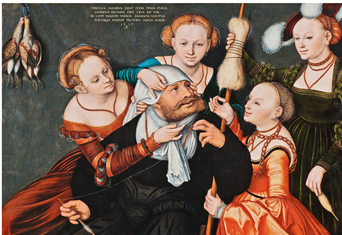
Лукас Кранах Старший. «Геркулес и Омфала». 1537. Музей герцога Антона-Ульриха (Брауншвейг)

Мораль: даже занимаясь увлекательным проектом на любимой работе, не забывай копить деньги на отпуск своей мечты у моря. А чем именно ты будешь там заниматься – знать никому не обязательно.