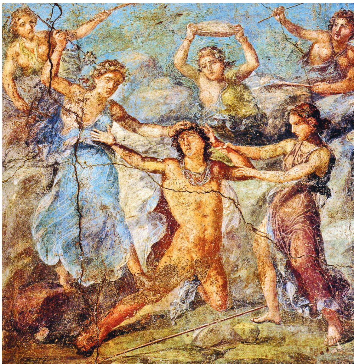
«Пенфей и менады». Древнеримская фреска, ок. I в. н. э. Дом Веттиев (Помпеи)