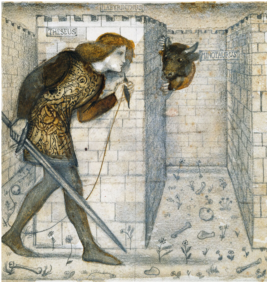
Эдвард Берн-Джонс. «Тезей и Минотавр в Лабиринте». 1861. Художественный музей и галерея Бирмингема

На рисунке известного прерафаэлит Тезей изображен в обличье средневекового рыцаря – вполне типичная трактовка античных мифов для представителей этого художественного направления. Тем более что Берн-Джонс опирался на изложение истории в поэме Джеффри Чосера «Легенда о примерных женищинах» 1388 года.