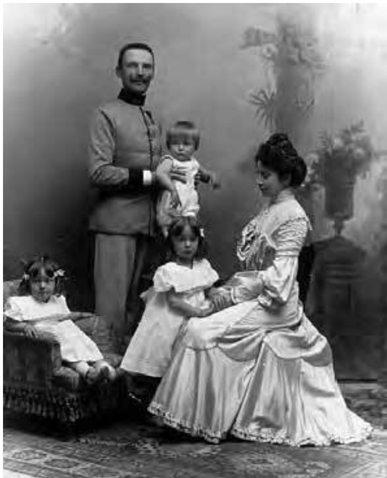
У Отто было две старших сестры: Герта (1898 г. р.) и Иль-