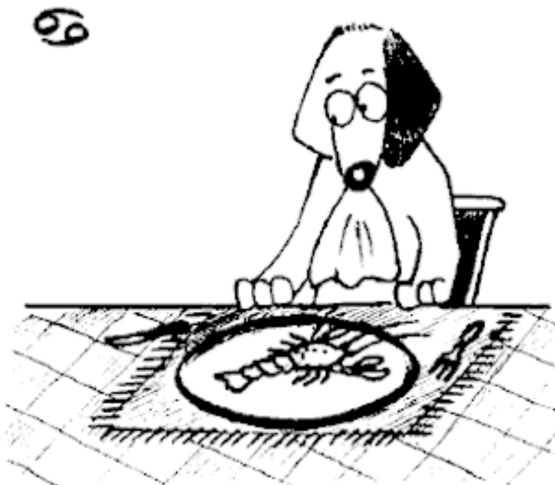
Рис. 4 Собака-Рак.

Собаки, родившиеся под знаком Рака, находятся в постоянном противоречии, они всегда в чем-то сомневаются, о чем-то беспокоятся. Настроение у них постоянно меняется: то они с удовольствием прыгают с другими собаками, то уже собираются домой. Очень часто настроение собак-Раков такое же, как у их хозяев. В связи с неустойчивостью духа такие собаки требуют деликатного обращения и большого терпения и дипломатии. На ссоры они не идут и в драки с другими собаками стараются не вступать. Собаки-Раки очень осторожны. Они очень ценят свою независимость и самостоятельность, при их воспитании надо иметь это в виду. Собаки-Раки не выносят одиночества, их лучше не оставлять одних на долгое время. Во время дрессировки проблем практически не возникает. Собаки-Раки отличаются хорошим интеллектом и памятью, а, кроме того, с ними приятно общаться, они сами стараются наладить хорошие отношения с хозяином. Собаки-Раки очень ценят душевную близость, недаром они лучше всех знаков чувствуют настроение хозяина. Они очень игривые и ласковые. Собаки-Раки – большие домоседы, конечно, они никогда не против прогуляться при хорошей погоде, но домой всегда идут с большим желанием. Дома предпочитают посидеть рядом с хозяином в тишине. Громкие звуки, шум, слишком энергичная музыка могут вызвать у собак этого знака нервные расстройства. Раки злопамятны, они могут долго помнить плохое к ним отношение.