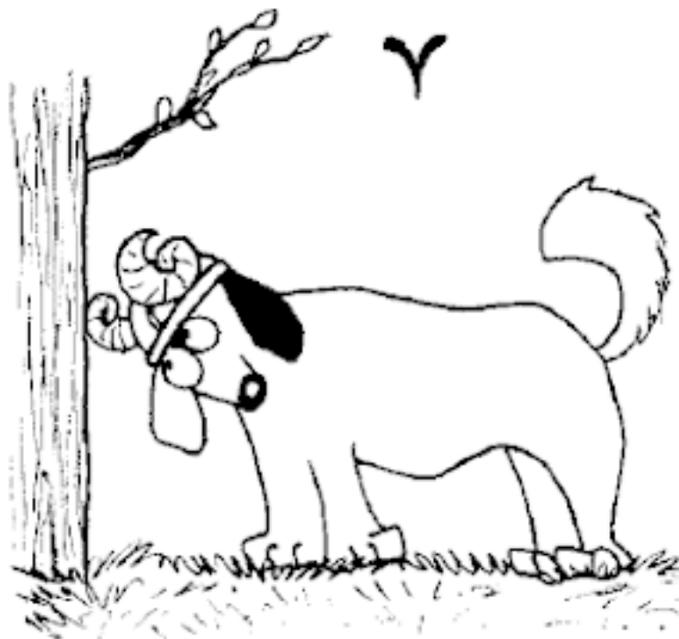
Рис. 1 Собака-Овен.

Овны, родившиеся с 21 по 31 марта, отличаются большой жизнеспособностью, физической силой и энергией, смелостью и храбростью, благородством. Они всегда будут защищать более слабого и беззащитного.