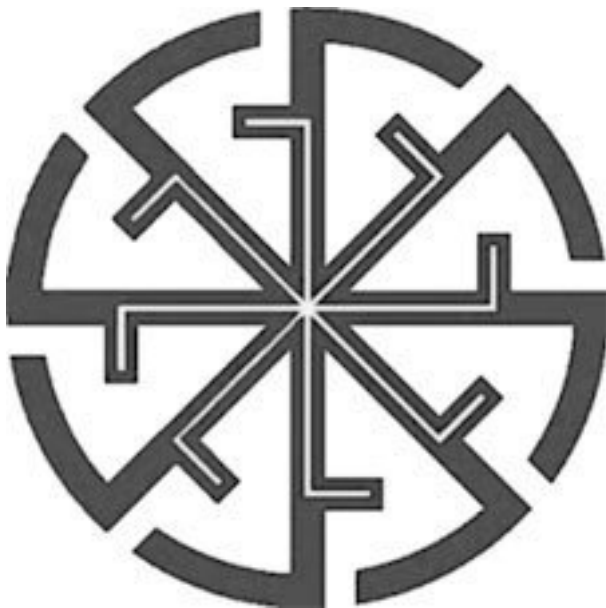
Свастика «Великая Рожаница»

Подобной силой наделен и другой древний славянский символ – Новородник.